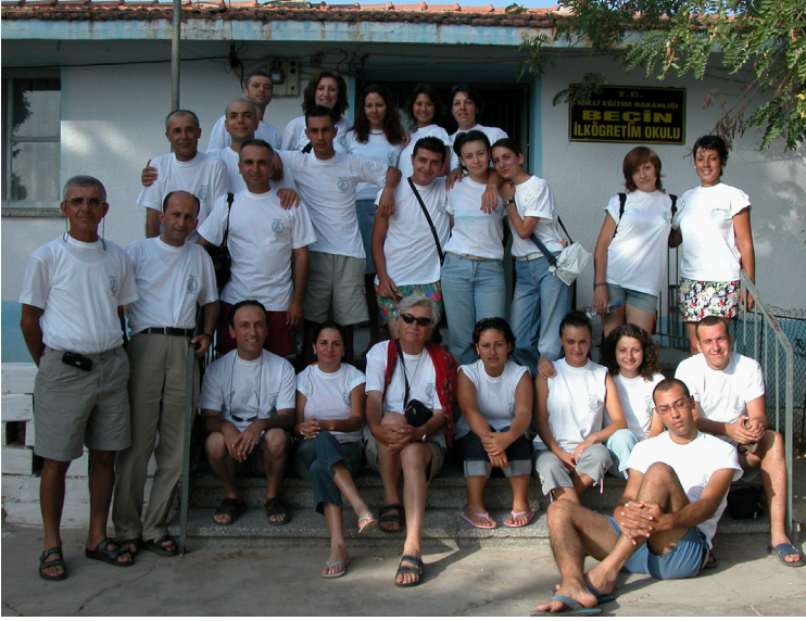
Hocamız ve kazı ekibi Beçin Kazı Evi'nde. (2004)

Titizliği sadece bilimsel çalışmalarıyla sınırlı değildi. Günlük yaşamında da son derece disiplinliydi. Beslenmesine dikkat eder, sporunu aksatmazdı. Genç yaşlarda yaşadığı bir böbrek sorunu nedeniyle güne her sabah içtiği ılık su ile başlardı. Okulda öğle yemeği bir dilim ekmek ve domates ya da mısır gevreği ve süttten ibaretti. Araştırma gezileri ve kazılarda da hocamızın bu hassasiyeti nedeniyle öğle yemeklerimiz son derece hafif yiyeceklerden oluşurdu.