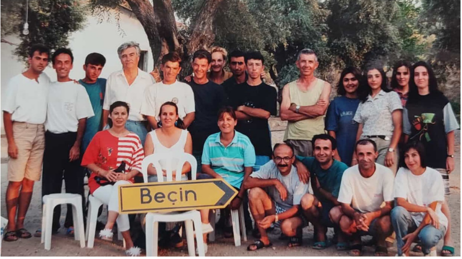
Beçin Kazısı'nın ilk yılında Beçin İlkokulu (kazı evi) bahçesinde (1995)