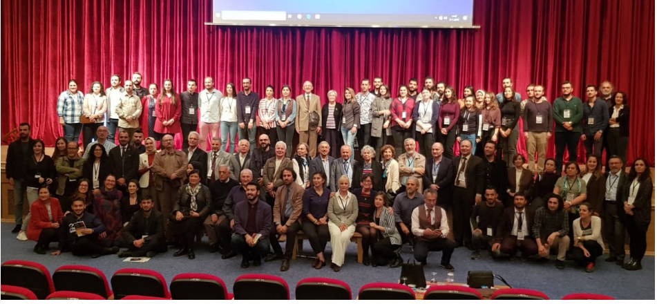
23. Ortaçağ-Türk Kazıları ve Sanat Tarihi Araştırmaları Sempozyumu'nda, Edirne. (9 Kasım 2019)