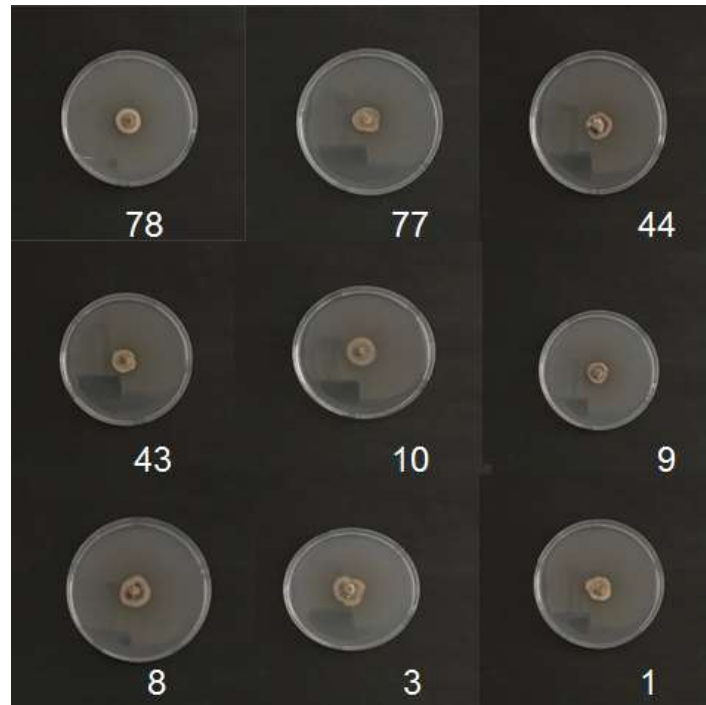
Şekil 3. pH 6'da farklı Ascochyta rabiei izolatlarının gelişimi

pH 6'da gelişimi en kuvvetli izolatlar 9 ve 44 numaralı izolatlar olmuştur. 8, 10 ve 43 numaralı izolatların gelişiminde fark gözlemlenmemiştir. Gelişimi en zayıf olan izolat ise 1 numaralı izolattır (Şekil 3).