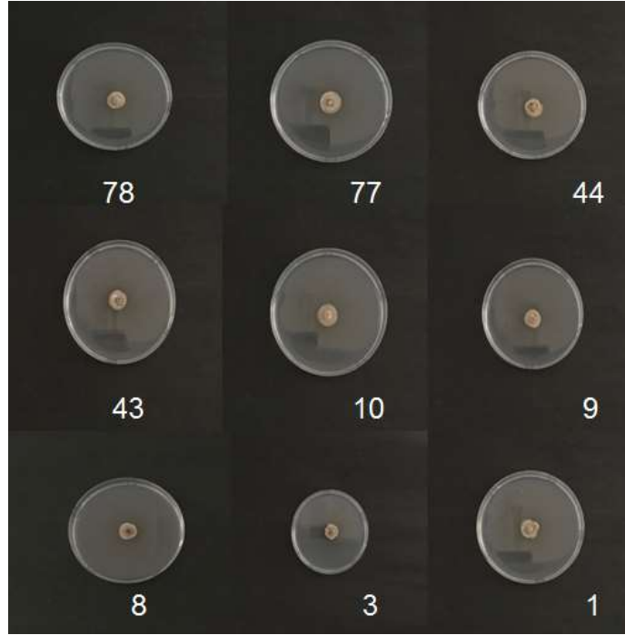
Şekil 2. pH 5'te farklı Ascochyta rabiei izolatlarının gelişimi

pH 6'da gelişimi en kuvvetli izolatlar 9 ve 44 numaralı izolatlar olmuştur. 8, 10 ve 43 numaralı izolatların gelişiminde fark gözlemlenmemiştir. Gelişimi en zayıf olan izolat ise 1 numaralı izolattır (Şekil 3).