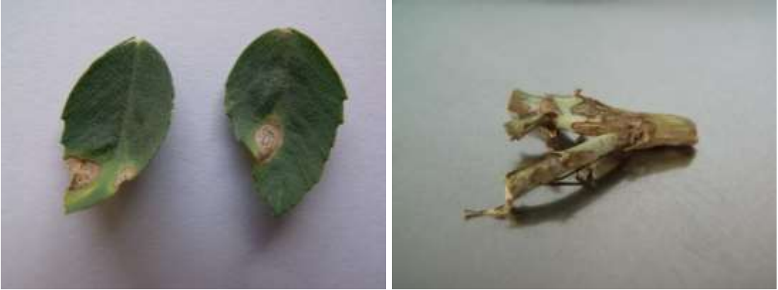
Şekil 1. A. rabiei ’nin nohut bitkisinin yaprakları ile gövde ve yan dallarda oluşturduğu karakteristik hastalık belirtileri

Hastalığın kimyasal mücadelesinde; thiram+benomyl karışımı önerilmektedir. A. rabiei ’nin kontrolünde yeşil aksam ilaçlaması ekonomik olmayıp, uygulama zamanına ve hava koşullarına bağlı olarak etkili olabilmektedir (Maden, 1987). Morjane ve ark. (1993), prochloraz ve prochloraz+mancozeb karışımı 2 kez uygulandığında hastalığın kontrolünde etkili olduğu ve verimde artışa sebep olduğunu bildirmişlerdir. Ayrıca Boscalid ve Prothioconazole uygulaması antraknoz hastalığının şiddetini azaltmakta ve üründe artışa neden olmaktadır (Wise ve ark., 2006).