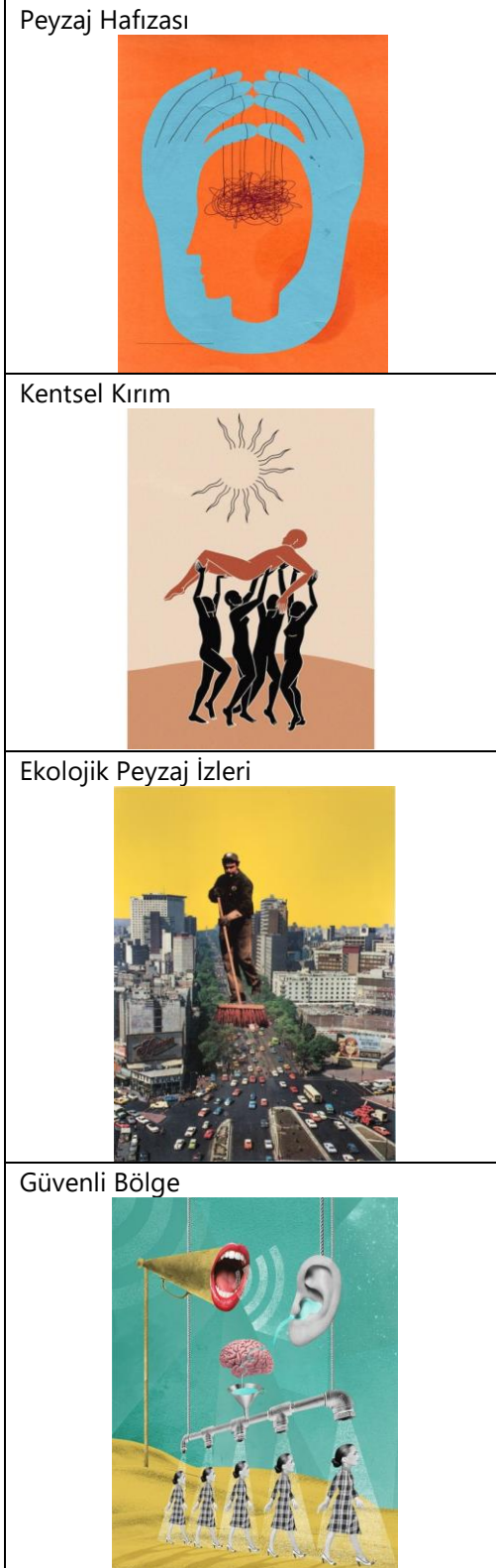
Çizelge 7. Savaş sonrası peyzajların anahtar kavramlarına ilişkin soyut kolaj çalışmaları (Çizen: Özgenur Aydın)

Doğrudan mekana müdahaleyi içeren savaşlar, mekan hafızasının dolayısıyla kültürel peyzajın kilit noktalarını belirleyen, onu şekillendiren bir olgudur. Mekanda neden-sonuç ilişkisine bağlı olarak gelişen yeni yaklaşımlar toplumun hafızasını da şekillendirmektedir. Aşağıda mekana doğrudan müdahale şansı olan peyzaj mimarlığı meslek disiplinine ilişkin konuya yönelik olarak farklı paydaşlara yönlendirilen sorular belirtilmiştir (Çizelge 8).