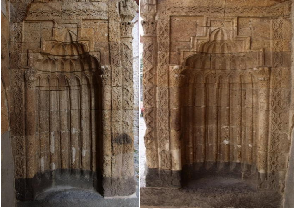
Görsel 5. İsmail Aka Medresesi Yan Nişleri

Kavsara Kuşatma Kemerli yoktur fakat kavsaraya göre şekillenen ve kavsaranın alt kısmından yükselerek kavsaranın tepe noktasında birleşen bir silme bulunur.