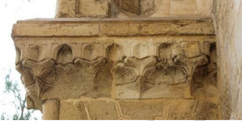
Görsel 4. Ermenek Tol Medrese Yan Niş Saçakları

Saçak taç kapı kavsarasıyla alt birimleri birbirinden ayıran mukarnaslı kuşağın yan niş üzerinde devam eden bölümüdür. Üst sırada, sade yüzeyli yatay bir silme kuşağı altında yer alan mukarnas sıraları üçer kademeli olarak yapılmıştır. Mukarnasların tepe kısımları dilimlidir. İkinci kademede mukarnas nişleri geniş bademlerden oluşurken, üçüncü sıra mukarnas kademeleri konsol şeklinde yapılmış ve konsollar arasına kemerli, içi boş kartuşlar yerleştirilmiştir.