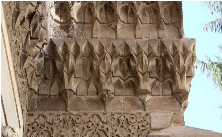
Görsel 8. Ak Medrese Taç Kapı Yan Nişler Saçakları

Saçak, yatay düzlemde sıralanan dört kademeli mukarnas sırasına sahiptir. Mukarnasların tepe kısmı dilimli, ikinci kademesi yelpaze formunda, üçüncü kademesi iki adet bademin yan yana gelmesiyle oluşturulmuştur. Dördüncü kademe mukarnas dizilerinin alt kısmında araları yelpazelerle ayrılan konsol şeklinde düzenleme yer almaktadır.