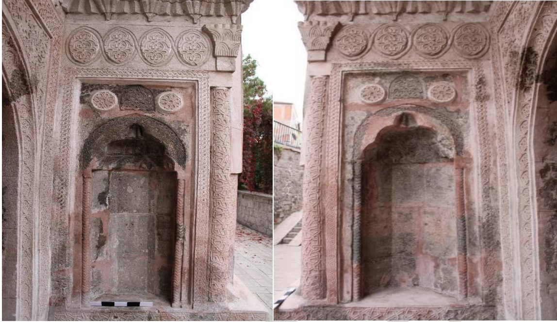
Görsel 1. Zinciriye Medresesi Yan Nişleri

Kısmen simetrik bir şemada inşa edilen medrese dört eyvanlı, revaklı açık avlulu ve tek katlıdır. Yapıya doğu cephede, dışa taşkın olarak yapılan taç kapıdan girilmektedir. Taç kapıdan sonra tonoz ile örtülü giriş eyvanına ve ardından da revaklı avluya geçilir. Avluyu kuzey, güney ve doğru taraflardan kuşatan revakların üzeri çapraz tonoz ve beşik tonoz ile örtülmüştür. Yapının batı tarafında yer alan ana eyvan tonozla, eyvanın iki yanında yer alan mekânlar ise kubbeyle örtülmüştür.