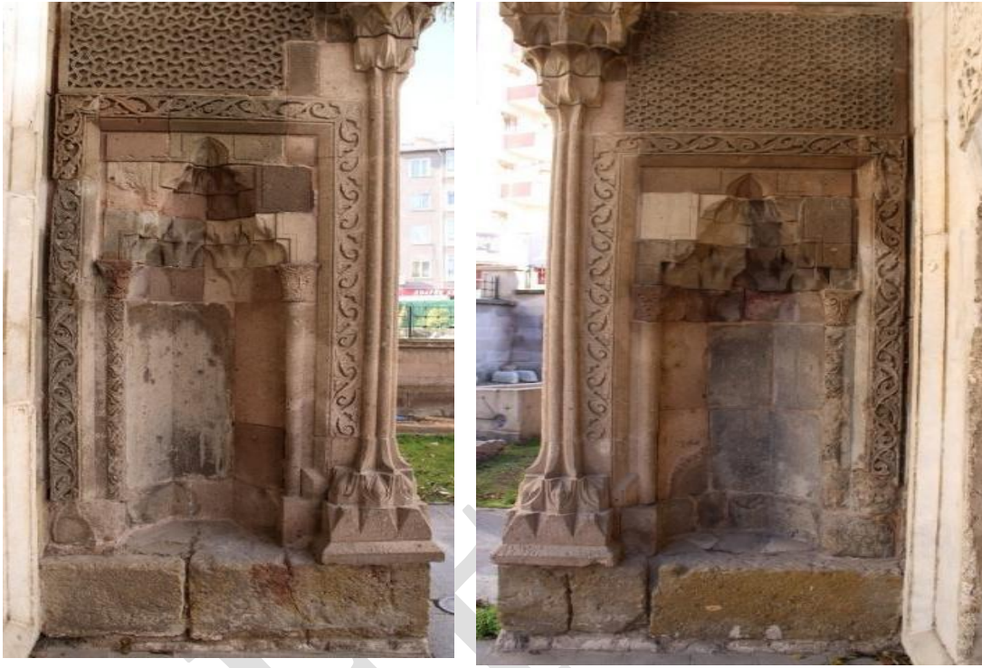
Görsel 7. Ak Medrese Taç Kapı Yan Nişleri

Taç kapı yan nişleri üst panoları dışında bakışimli olarak yapılmıştır ve saçak, üst pano, çerçeve, köşelik, kavsara, niş ve sütunçelerden oluşmaktadır.