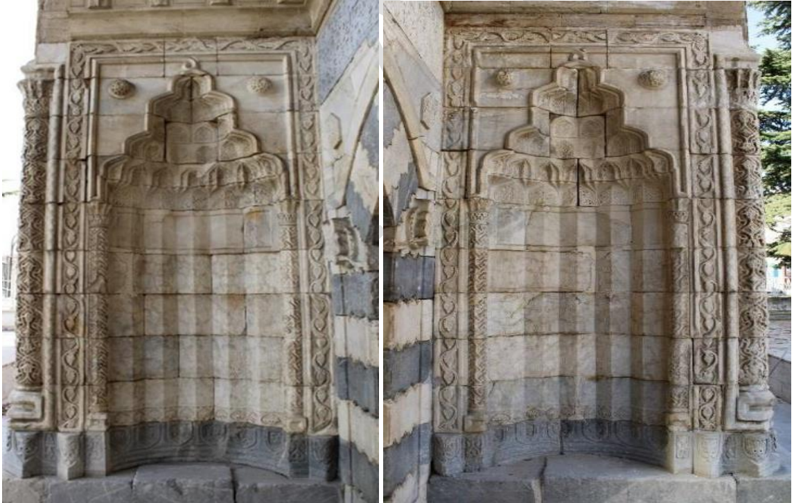
Görsel 6. Hatuniye Medresesi Yan Nişleri

Taç kapıda ters "U" (𐤎) formunda beş adet çerçeve bulunur. Çerçevelerin yüzeyinde kırık çizgilerden oluşan geometrik düzen, kıvrım dallarla beraber rumi yapraklar ve palmet çiçeklerinden oluşan süsleme grupları vardır. Taç kapı açıklığını simetrik olarak yapılmış çift katlı korint başlıklı, silindirik gövdeli ve yatay "C" formu kaideye sahip sütunçeler sınırlandırmaktadır.