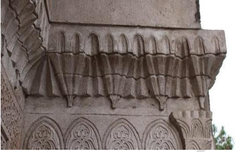
Görsel 2. Zinciriye Medresesi Yan Niş Saçakları

Üst Pano mukarnaslı saçak altında yatay dikdörtgen şeklindedir. Restorasyondan önceki görüntülerde taş yüzeyleri ile motiflerin ileri derecede eriyerek bozulduğu ve bu nedenle tanımlanmasının son derece zor olduğu görülmektedir. Restorasyon sırasında panolar tamamlanmıştır. Restorasyondan sonra ortaya çıkan görüntüye göre üst panoda, birbirine yılankavi formda altlı üstlü geçişlerle çerçeveselenen madalyon formunda dört adet kabartma daireler oluşturulmuştur. Madalyonlarda zemin oyma tekniğiyle yapılmış bitkisel süslemelere yer verilmiştir.