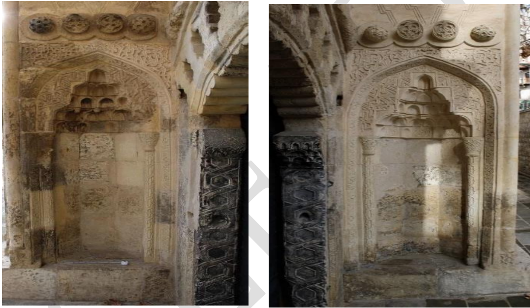
Görsel 3. Ermenek Tol Medrese Yan Nişleri

Taç kapı cephe duvarından çok az çıkıntı yapmaktadır ve duvarlardan yüksek tutulmuştur. Duvar örgüsündeki taş malzeme ile aynı taşın kullanıldığı taç kapıda, restorasyonlar sırasında özellikle özgün süslemelerin yok olduğu kısımlarda yenilemeler yapılmıştır.