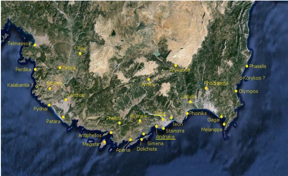
Harita 1. Myra ve Andriake'nin konumu (Aygün 2018, 289, Lev. 1)

Andriake'de 2009 yılında başlayan kazı çalışmaları halen devam etmektedir 2 . Çalışmada incelenen oinophoros cinsi seramikler Şarap İşlikleri ile Liman Yapıları'nda ele geçmiştir (Görsel 1).