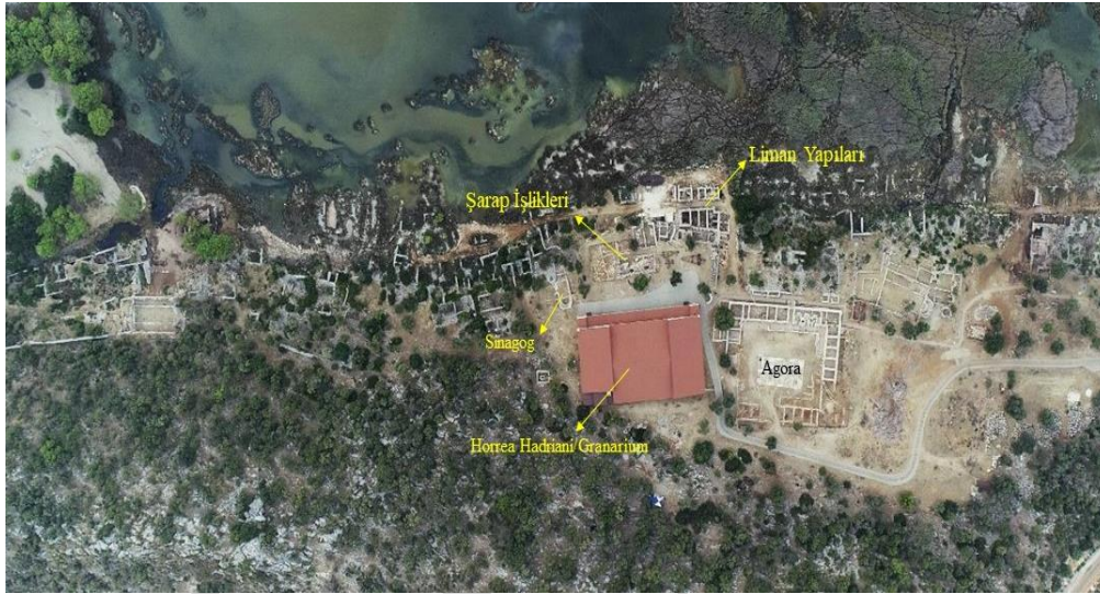
Görsel 1. Seramiklerin ele geçtiği alanlar

Güney yerleşimin merkezinde, Horrea Hadriani/Granarium'un kuzeyinde, Sinagog'un ise batısında yer alan Şarap İşlikleri'nin kazısına 2012 yılında başlanmıştır. İşliklerin ilk yapım tarihi bilinmezken ikincil kullanımı için MS 4. yüzyıl tarihi önerilmektedir (Çevik vd., 2013, s. 93-94; Aygün, 2018, s. 202-203). Alanda yapılan kazı çalışmalarında yoğun olarak ele geçen MS 1-12. yüzyıl aralığına tarihlenen seramiklerden anlaşılacağı üzere, mekânın Şarap İşliği olarak kullanımının sona ermesiyle seramik çöplüğüne dönüştürülmüş olduğu düşünülmektedir (Çevik vd., 2013, s. 93). Kazıları 2009 ve 2010 yılında gerçekleştirilen, Şarap İşlikleri'nin kuzeydoğusunda yer alan Liman Yapıları dükkân, tersane, depo ve gemi barınaklarından oluşan yapılar topluluğudur. Mekânlardan ilk olarak dükkânların kazısı yapılmıştır. Elde edilen verilere göre inşa tarihleri MS 3. yüzyıl, en yoğun kullanım evreleri MS 4-5. yüzyıl, son kullanım evreleri ise MS 7. yüzyılın başlarına tarihlenmektedir (Çevik & Bulut, 2010, s. 45-46; Çevik & Bulut, 2011, s. 6-8; Aygün, 2018, s. 163-165; Öz, 2020, s. 25).