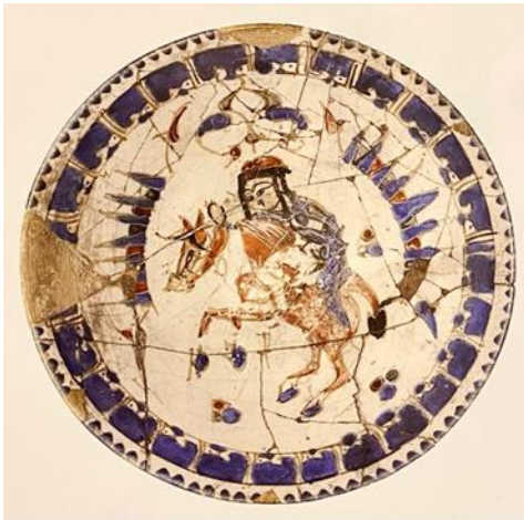
Şekil 1: Miai Kase, 13. Yy. Rey-Tahran, İran Ulusal Müzesi