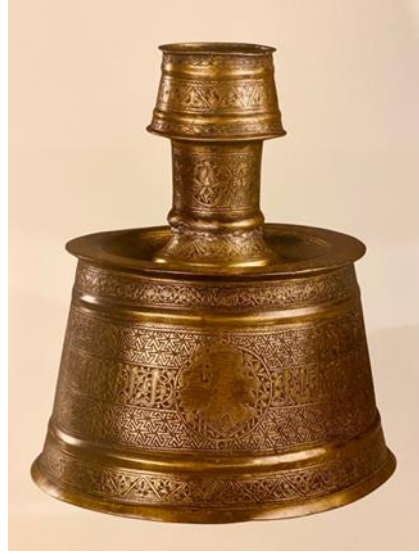
Şekil 4: Şamdan 12-13.yy. Büyük Selçuklu Türk İslam Eserleri Müzesi