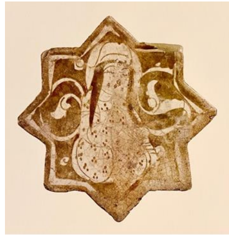
Şekil 2: Lister Çini, 12.yy son çeyreği Selçuklu, Sadberg Hanım Müzesi