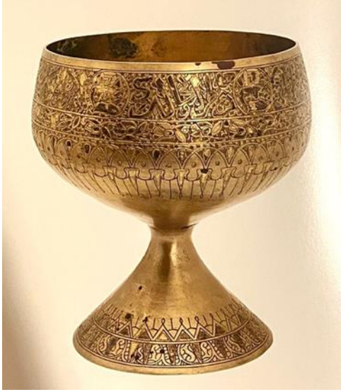
Şekil 3: Bitkisel ve geometrik motifli, insan figürlü ve yazılı kadeh 13-14.yy. Refsencan-Kirman İran Ulusal Müzesi