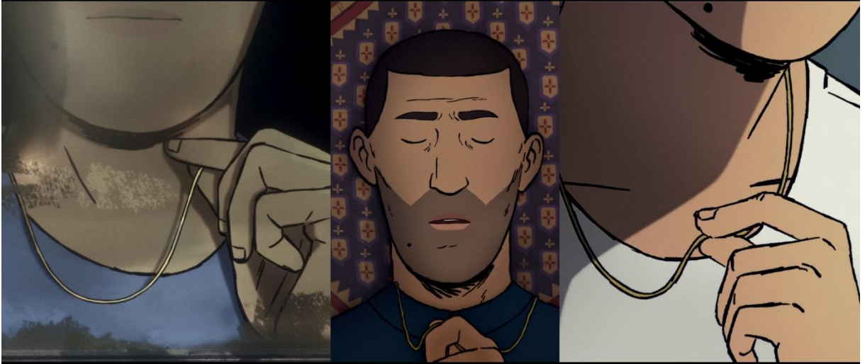
Görsel 8 Altın Kolyenin Yakın Plan Çekimleri

Hatırlama aracı olarak kullanılan bir diğer obje ise Amin’in Danimarka’ya kaçış yolculuğunda bir süre birlikte yolculuk yaptığı arkadaşının hediye ettiği altın kolyedir. Filmin farklı sahnelerinde benzer bir el hareketi ile kolyeyi tuttuğu detay çekimler dikkat çekicidir.