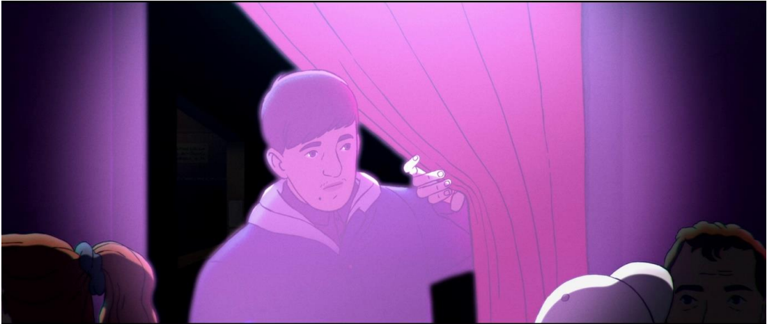
Görsel 4 Belirli Renk Tonlarının Öne Çıkarılması

Filmde renk ve ışıklandırma anlatımı güçlendiren önemli bir unsurdur. Hafıza mekânı olarak kullanılan ev sahnelerinde, karakterlerin ruhsal durumunu güçlendirecek şekilde ışık ve renk kullanımı göze çarpar. Filmde Amin'in geçmişindeki huzurlu anıları daha güneşli ve canlı renklerin olduğu sahnelerle aktarılırken travmatik anılar ise karanlık, renksiz bazen tamamen soyut çizimlerle ekrana yansıtılır. Filmde renk metaforik bir anlatım aracı olarak da kullanılır. Örneğin yıllarca eşcinselliğini gizleyen Amin'i, Gay Bar'a olan giriş sahnesinde karanlık bir koridordan ilerledikten sonra geçtiği perdenin ardında yoğun bir pembe renk karşılar.