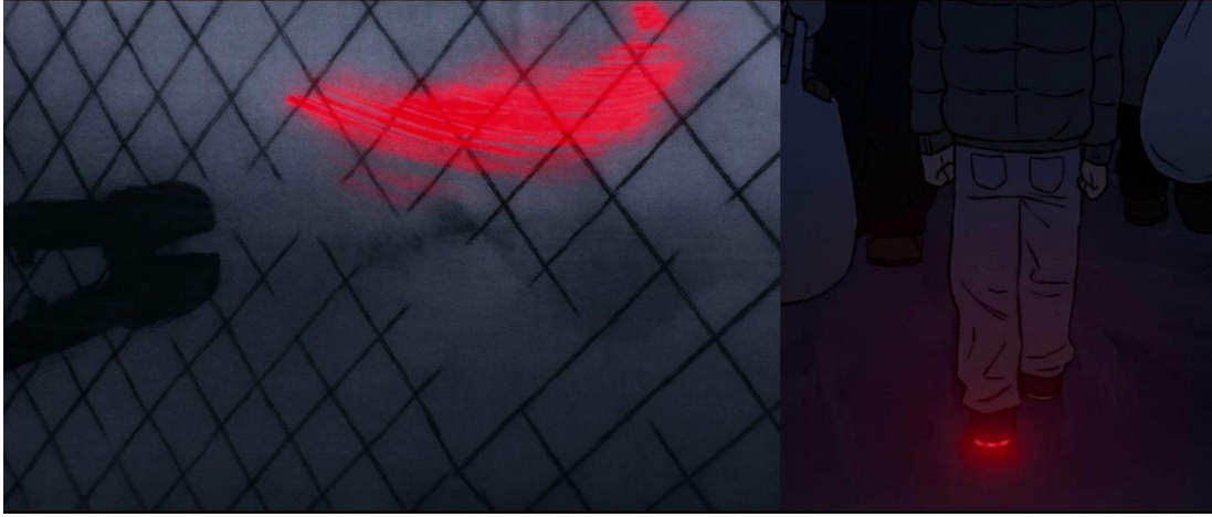
Görsel 5 Anıların Hatırlanmasında Renk Çağrışımı

Anıları ortaya çıkaran başka bir renk kullanımı da Amin'in Rusya'dan Avrupa'ya kaçak yollarla ilk geçiş denemesinin olduğu gece sahnesinde öne çıkar. Siyah beyaz ve soyut görüntüler içinde belli belirsiz geçen bir kırmızı ışıltı ilerleyen sahnelerde küçük bir mülteci çocuğun ayakkabısından geldiği anlaşılır.