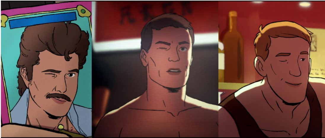
Görsel 6 Film Boyunca Göz Kırpan Karakterler

Amin'in cinsel kimliğini tanımaya başladığı ve hemcinslerine olan ilgisi ise ünlü oyuncularla ilgili çocukluk anıları üzerinden izleyiciye sunulur. Ablalarının oynadığı oyun kartında bulunan Hintli oyuncu Anil Kapoor ve televizyonda filmi izlediği Belçikalı oyuncu Jean Claude van Damme mizahi bir şekilde Amin'e göz kırpar. Yönetmen göz kırpma metaforunu film boyunca kullanır.