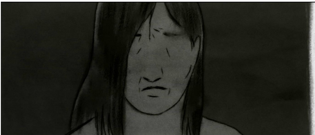
Görsel 2 Belirgin olmayan yüz hatları

Flee filminde travmatik sahnelerin siyah beyaz olmasının yanında karakterlerin yüzleri çoğu zaman göz- burun gibi uzuvlar olmadan ya da belli belirsiz tasvir edilerek soyutlanır.