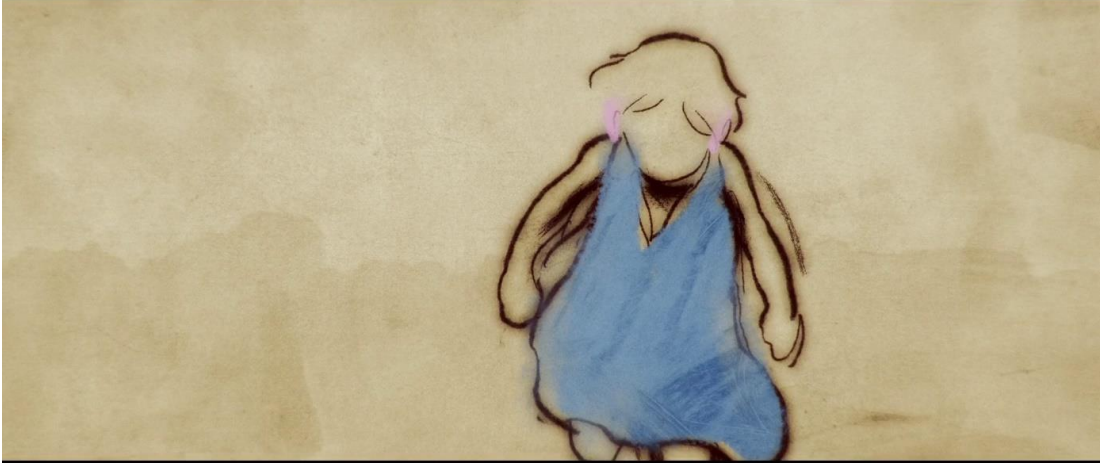
Görsel 3 Belirli Renklerin Öne Çıkarılması

Filmde öne çıkan bir diğer unsur ise renk kullanımınıdır. Renk kodları farklı kültürlerde farklı anlamlar taşıdığından Flee filminde renk kullanımında evrensel kodlar kullanılmıştır. Filmin karakterinin mutlu günlerine ait anıları canlı renkler kullanılarak bazen sadece öne çıkarılması istenilen objeler öne çıkarılarak aktarılır. Örneğin çocukluğunda kız kardeşinin elbisesini giyerek neşeli bir şekilde sokaklarda koştuğu sahnede, pembe walkman ve mavi elbisenin rengi öne çıkar.