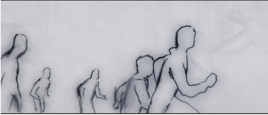
Görsel 1 Siyah- Beyaz Soyut Çizgiler