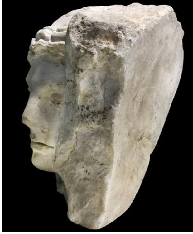
Resim 3: İdeal başın sağ profilden görünümü.