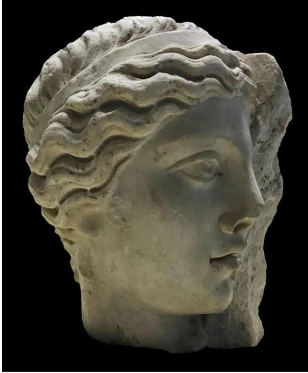
Resim 2: İdeal başın sol profilden görünümü.