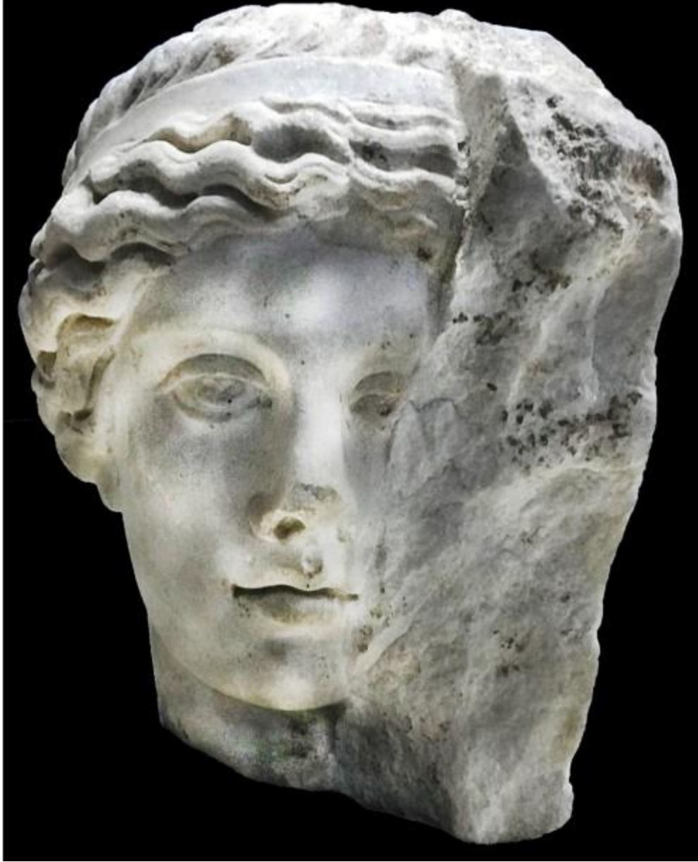
Resim 1: İdeal başın ön cepheden görünümü.