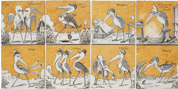
Görsel 1. Henry Stacy Marks, Minton Sanat Çömlekçiliği için tasarlanan sekiz adet seramik karo, 1875, sıralı dekor, her bir karo 15x15 cm, Özel Koleksiyon