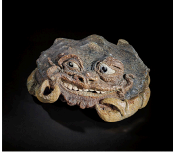
Görsel 18. R.W. Martin ve Kardeşleri, Muazzam ve Olağanüstü Grotesk Sırttan Yengeç , 1880, Tuz sırlı stoneware, 21x40,8x46 cm, Özel koleksiyon

Martin Kardeşler'in işletmesi ve eserleri, Stüdyo Çömlekçiliği ile olan etkileşiminin de ötesinde çağdaş dönemde birçok sanatçıya tavrı olarak etki ettiği söylenebilir. Yaşadıkları dönemde seramik üretimi, geleneksel bir zanaat dalı ve sofa eşyaları ya da dekoratif eşyalar olarak kısıtlanan işlevsel formlar bütünü olmanın ötesine geçemezken, Robert Wallace Martin'in yaratıcılığı ve kardeşlerinin yetenekleri sayesinde eserleri zamanının çok ötesinde bir tanımlamayla seramik heykeller yani çağdaş sanatın birer parçası olarak vücut bulmaktadır. Her ne kadar tasarımlarının işlevsel gerçekliği inkâr edilemese de ifadeleri ve görüntüleri itibarıyla Martin Kardeşlerin üretmiş olduğu seramik kapların birçoğu aslında seramik heykellerdir. Bununla birlikte Martin Kardeşler'in Görsel 18'de görülen sırttan yengeç figürü ile yine fantastik grotesk deniz canlılarından ve insan figürlerinden oluşan, var oluşlarından öte hiçbir işleve sahip olmayan seramik heykelleri bulunmaktadır. Seramik figürlerin dekoratif süs eşyalarından öteye geçemedikleri bir yüzyılda tekinsiz görünüşleri sebebiyle takipçileri ve meraklıları dışında kimsenin beğenisini ve ilgisini kazanamayacak bu figürlerin ticari değil tamamen sanatsal kaygılarla üretildiği açıktır.