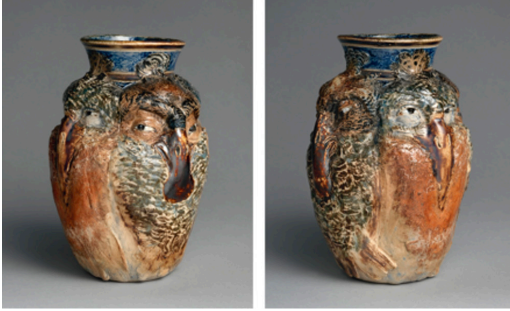
Görsel 13. R. W. Martin ve Kardeşleri, Dört Kuşlu Kavanoz , 1892, Tuz sırlı stoneware, 21,1x15,2x15,6 cm, Metropolitan Müzesi Koleksiyonu, New York

göğüslerine olabildiğince yakın konumlanmış olup, kavanozun dip kısmında alçak kabartma olarak tüy detaylarına yer verilmiştir. Gövdenin etrafını saran kuşlar geniş göğüsleri ile birbirlerine sokulmuş ya da yaslanmış gibi görünmekte ve etrafı kuşku ile izlemektedirler.