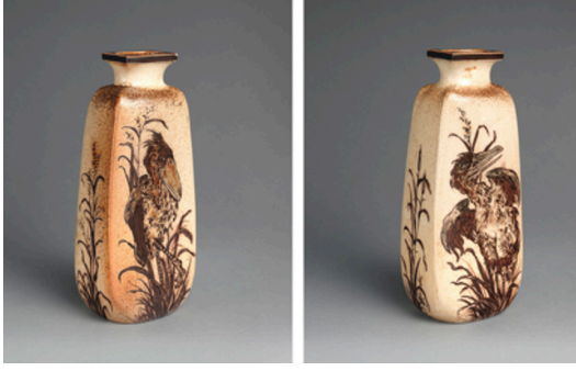
Görsel 6. R. W. Martin ve Kardeşleri, Kuş Bezemeli Şişe Biçimli Vazo , 1899, Stoneware, 22,9x9,8x8,3 cm, Metropolitan Müzesi Koleksiyonu, New York

Özellikle işlevsel açıdan değerlendirildiğinde kuş biçimli kapların ilk mucidinin Martin Kardeşler olduğu iddia edilemez zira bilindiği üzere tüm kültürlerde olduğu gibi Avrupa seramik tarihi de kuş biçimli ya da bezemeli, işlevsel veya dekoratif birçok seramik kap barındırır. Görsel 7'de 16. yüzyıldan kalma, okçuluk müsabakasında kazanana verilmek üzere baş kısmı kapak şeklinde tasarlanmış yırtıcı kuş biçimli bir flakon ödülü, Görsel 8'de ise 18. yüzyıla tarihlenen, göğüs kısmından kanatlar kapak ile gövdenin birleşim yerini örtecek şekilde ikiye bölünerek üst kısmın kapak olarak tasarlandığı iki adet çulluk kuşu biçiminde çorba kasesi yer almaktadır. Her iki eser de Alman kültürüne aittir.