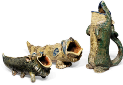
Görsel 11. Martin Kardeşler, İki Kaşık Isıtıcı ve Bir Sürahi , 1873, Tuz sırlı stoneware, kaşık ısıtıcılarının boyutları bilinmiyor, sürahi yükseklik 27,7 cm, Christie's Müzayede Evi, Londra

Görsel 12'de ise Wallace Martin tarafından modellenen uzun bir kuş kavanozu yer almaktadır. 1896 yılında üretilmiş olan bu kavanozun dikkat çekici yanı kuşun yüz ifadesi kadar beden dilinin de etkileyici şekilde insani özellikler taşımasıdır. Diğer Wally-kuşları gibi bu vazoya da biçimsel ve teknik açıdan bakıldığında tüylerin, kanat ve kuyruk teleklerinin, bacaklardaki deri dokusunun ve perdeli ayakların oldukça detaylı ve gerçekçi bir kuş figürünü yansıttığı görülmektedir. Bu gerçekçi detaylarla birleşen kahverengi, mavi ve sırt ile kanatlardaki yeşile çalan renk tonlarının oluşturduğu doğal bütünlüğü bozan şey ise Wallace Martin'in tasarımındaki yüz ifadesi ve vücut dili ile kuşa bahsettiği karakterdir.