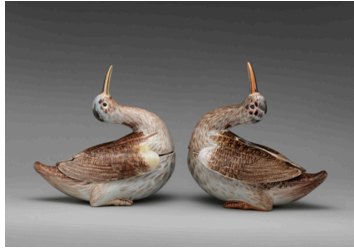
Görsel 8. Bir Çift Çulluk Biçiminde Çorba Kasesi , 1750, Kalay sırlı seramik, 25,4x25,4 cm, Metropolitan Müzesi Koleksiyonu, New York

Martin Kardeşler her ne kadar çoğunlukla heykel görünümü sarkastik kuş kapları ile bilinseler de aslında çeşitli ürün gruplarında seramik üretimleri söz konusudur. 1870-80 yılları arasında çok sayıda kendilerine has renk ve dekorlarda üretmiş oldukları fayanslar bulunmaktadır. Bu fayansların bir kısmının üzerinde diğer erken dönem eserlerinde olduğu gibi kazıma dekorlu bitkisel bezemeler ve çiçek figürleri yeşil, kahverengi ve mavi renk tonlarında tuz sırları ile belirginleşmiştir. Bir diğer ürün grubu üzerinde rölyefler barındıran sırsız plakalardan oluşmaktadır. Görsel 9'da bir örneği görülen bu sırsız plakaların üzerindeki rölyefler genellikle atölye ortamı, çalışan çömlekçiler ve tornada şekillendirildikten sonra raflara dizilen formlar görülmektedir. Bu ürünlerin Robert Wallace Martin'in muhtemelen kendini ve kardeşlerini modellediği çömlekçi figürleri ile bağlantılı olduğu açıktır. Nadir görülen bu çömlekçi figürleri arasında tornada çamur şekillendiren ve tezgâhta çamur yoğuran figürler bulunmaktadır. Aynı konu işlenmiş olsa da plakalardan farklı olarak figürler