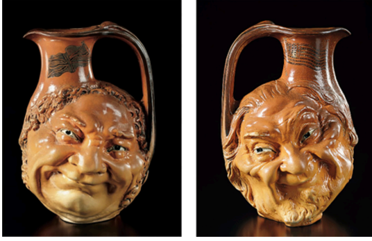
Görsel 16. R. W. Martin ve Kardeşleri, "Brother Jonathan" ve "John Bull" Sürahis, 1899, Tuz sırlı stoneware, Yükseklik 25,4 cm, Özel Koleksiyon