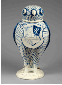
Görsel 7. Flakon Ödülü , 1540, Kalay sırlı seramik, Yükseklik 41,9 cm, Metropolitan Müzesi Koleksiyonu, New York

Özellikle işlevsel açıdan değerlendirildiğinde kuş biçimli kapların ilk mucidinin Martin Kardeşler olduğu iddia edilemez zira bilindiği üzere tüm kültürlerde olduğu gibi Avrupa seramik tarihi de kuş biçimli ya da bezemeli, işlevsel veya dekoratif birçok seramik kap barındırır. Görsel 7'de 16. yüzyıldan kalma, okçuluk müsabakasında kazanana verilmek üzere baş kısmı kapak şeklinde tasarlanmış yırtıcı kuş biçimli bir flakon ödülü, Görsel 8'de ise 18. yüzyıla tarihlenen, göğüs kısmından kanatlar kapak ile gövdenin birleşim yerini örtecek şekilde ikiye bölünerek üst kısmın kapak olarak tasarlandığı iki adet çulluk kuşu biçiminde çorba kasesi yer almaktadır. Her iki eser de Alman kültürüne aittir.