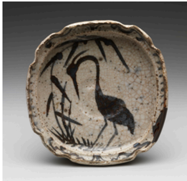
Görsel 5. Sazlıkta Gezen Balıkçıl Bezemeli Kase, Momoyama Dönemi (1573-1615), Sıraltı dekorlu Shino tipi Mino seramiği, 16,5 cm çap, Metropolitan Müzesi Koleksiyonu, New York