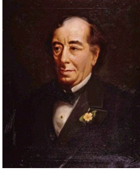
Görsel 4. Frederick Sargent, 1. Beaconsfield Kontu Benjamin Disraeli'nin Portresi, Tarih bilinmiyor, Tuval üzerine yağlıboya, 60x50,8 cm, Parlamento Sanat Koleksiyonu, Londra