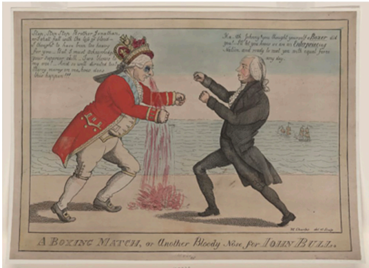
Görsel 17. William Charles, A Boxing Match , 1813, tekniği ve boyutları bilinmiyor, Amerikan Anayasa Müzesi, Washington

Cooper, Martin Kardeşler'in eserlerinin başkalarını kendi tarzlarını takip etmeye teşvik etmede ya da genel olarak yirminci yüzyıldaki stüdyo çömlükçilerinin çalışmaları üzerinde sınırlı bir etkiye sahip olduğunu belirtir (Cooper, 2010: 282). Yaşadıkları dönemde kendi içlerine kapanık bir hayat süren Martin Kardeşler'in diğer sanatçı ve tasarımcıları etkilemek gibi bir düşünceleri olmaması doğaldır ancak çalışma disiplinleri açısından Stüdyo Çömlükçileri'ne verdikleri ilham