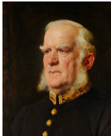
Görsel 15. Solomon Joseph Solomon, Sir Edward George Clarke'ın Portresi , Tarih bilinmiyor, Tuval üzerine yağlıboya, 110x83 cm, İngiliz Devlet Sanat Koleksiyonu, Londra