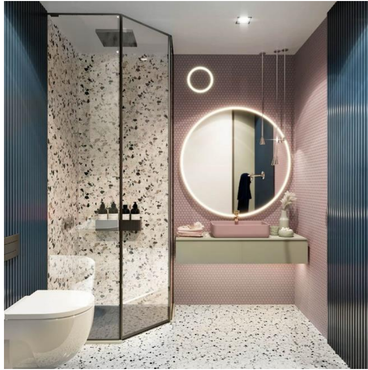
Şekil 3 Banyo Tasarımında Renk Kullanımı ( DK İç Mimarlık, 2020)

Mavi renk, 3 ana renkten biridir. İştah kesen bir renktir. Sakinleştirici etkisi de vardır. İngiltere'de gelinlik rengidir. Avrupa'da, erkeklerin sevdiği renktir. Yunanistan'da önemsenmeyen bir renktir. İran'da keder anlamına gelmektedir. Fransa'da adaleti temsil etmektedir. Mekân kullanımında diğer renkler ile uyumlu bir şekilde kullanılması gerekmektedir. Mekân içerisinde duvarda hissiz, döşemede çağrıcı, tavanda hayalperest etkiye neden olmaktadır. Islak alanda mobilyalarda kullanılması önerilen bir renktir. (Rasmussen, 2010) (Şekil 3) Uyuma alanlarında nevresim kullanımında önerilmeyen bir renktir. Sağlıklı uyku için doğru bir renk değildir. Resmi kıyafetlerde ve üniformalarda koyu tonları tercih edilmektedir. Kararlılık, ciddiyet ve güven etkisi vermektedir. Dekoratif ürünlerde kullanılması daha doğru bir tasarım tercihi olacaktır.