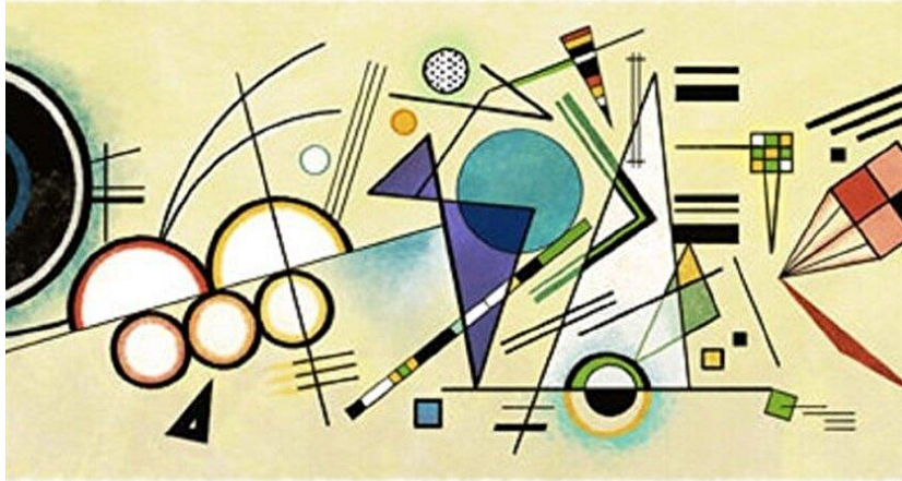
Şekil 2. Wassily Kandinsky, Blue Segment, 1921

Sarı renk, doğada bulunan 3 ana renkten bir diğeridir. Tamamlayıcı rengi mor renktir. Kandinsky'nin yorumuna göre sarı renk ekşi görünüme neden olmaktadır. (Şekil 2) Sarı ve sarıya yakın renkler sıcak renk olarak isimlendirilmektedir. (Bayramın, 2011) Kontrolsüz davranışa sahip insanların kullandığı bir renk olarak tarif edilmektedir.