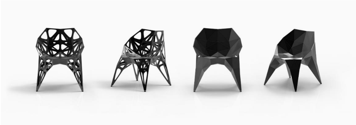
Şekil 6 Biçimin Oluşması (Zhang Zhoujie, 2009)

Biçimsel algı sonucu yapılan değerlendirmeler ile biçimsel etki meydana gelmektedir. Biçimin şekli ile kullanıcı arasında psikolojik bir etki süreci işlemektedir. (Şekil 5) Kullanılan şeklin doğrusal ya da eğimli olması, dik ya da dairesel olması, büyük ya da küçük olması, geniş ya da dar olması gibi birçok etken biçimin farklı algılanmasına ve dolayısıyla farklı etkiler oluşturmaya neden olmaktadır. (Aslan ve ark., 2015) Biçimin, mekân içinde olduğundan uzakta ya da yakında algılanabilmesi gibi, biçim üzerindeki şekillerin sivri ya da eğimli olması biçimin daha konforlu, daha elastik ya da daha ağır olduğuna dair bazı tefsirlerin oluşmasına neden olabilmektedir. Bu yorumlar bazen gerçeği yansıtmayacak şekilde değişkenlik gösterebilmektedir. Bu da biçimin tasarımda psikolojik etkilerinin ne kadar üst boyutta olduğunu kanıtlar niteliktedir.