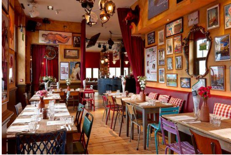
Şekil 1. Günümüz Dünyasında Modern Kafe Tasarımı ve Önemi, (Concept İç Mimarlık)

Sarı renk, doğada bulunan 3 ana renkten bir diğeridir. Tamamlayıcı rengi mor renktir. Kandinsky'nin yorumuna göre sarı renk ekşi görünüme neden olmaktadır. (Şekil 2) Sarı ve sarıya yakın renkler sıcak renk olarak isimlendirilmektedir. (Bayramın, 2011) Kontrolsüz davranışa sahip insanların kullandığı bir renk olarak tarif edilmektedir.