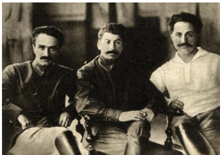
Anastas Mikoyan (solda), İosif Stalin (ortada), Qriqori (Serqo) Orconikidze (sağda)

Azərbaycan Xalq Cümhuriyyətinin müstəqilliyini görmək istəməyənlərin önündə İ.Stalin, A.Mikoyan, S.Kirov və S.Orconikidze gedirdi. 1919-cu il mayın əvvəlində A.Mikoyanın