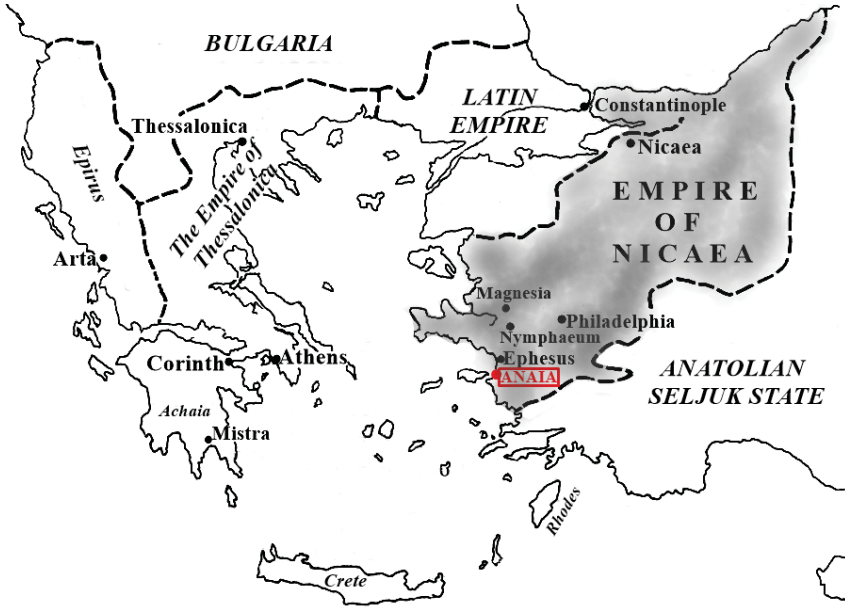
Kadıkalesi/Anaia'nın Konumu (Merve Toy tarafından hazırlanmıştır) 3 .