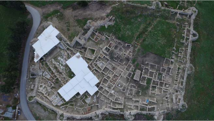
2017 yılı Kadikalesi/Anaia hava fotoğrafları