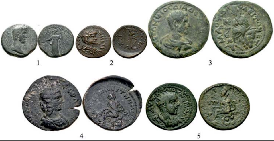
Levha 1. Kat. 1-5'deki sikkeler. 49