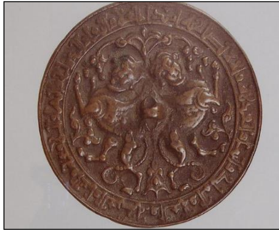
Foto 11. 12-13.yy. Artuklu Dönemi Bronz Ayna Örnekleri (Türk ve İslam Eserleri Müzesi)

Kitabe kuşaklarının içerikleri incelendiğinde genellikle iyi dilek, bereket, daimilik ve sahibine yücelik katan birtakım ibarelere yer verildiği anlaşılmaktadır. Türk İslam Eserleri Müzesinde yer alan Artuklu dönemine ait bronz aynanın etrafının çevreleyen kitabe kuşağında da benzer bir iyi dilek temennisiyle karşılaşmaktayız. Çalışmamız içerisinde yer alan K-5 ve K-6 no'lu örneklerde bulunan kitabelerin içerikleri incelendiğinde yine Artuklu maden sanatında yer verilen kitabe kuşaklarında ortak bir tutum olduğu ve bunun kronolojik tasnifte sağlama yapabilecek bir metot olduğu anlaşılmaktadır.