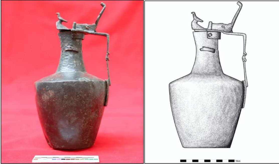
Foto 4. Bronz İbrik, Artuklu Dönemi (12-13 yy.), Döküm tekniği, Envanter no: 2021-978. Gövde Çapı: 14,5. cm, Yükseklik: 23,5 cm. Çiz. 4: Katalog 4 no'lu ibrik çizimi

Tanımı: Dairesel bir forma sahip olan kapak, döküm tekniğinde ve tunç malzemeden yapılmıştır. Kapağın dış yüzeyinin oldukça korozyona uğradığı anlaşılmaktadır. Bu haliyle kapağın dış yüzeyi üzerinde bir bezeme unsurunun varlığı seçilememektedir. Kapağın, örttüğü metal formun günümüze ulaşamamasından kaynaklı olarak, niteliği konusunda kesin bir fikir ileri sürmemiz mümkün olmamakla birlikte, kapakla uyumlu dairesel ağızlı bir kutu, maşrapa yahut mütevazı ölçülere sahip bir tasa ait olma ihtimalini güçlüdür.