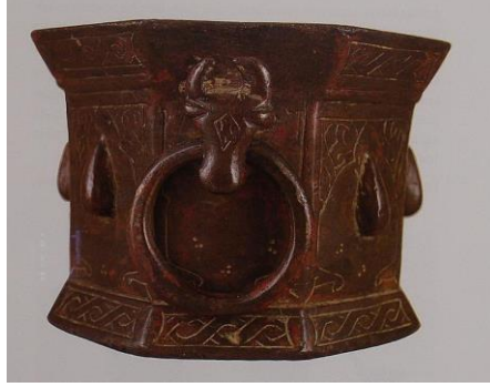
Foto 7. Artuklu Devrine ait bronz havan örneği (Belli ve Kayaoğlu'ndan)

atölyelerinde seri üretimi yapılan bronz havanların örneklerine yurtiçi ve yurtdışı müzelerinde rastlamak mümkündür (Belli ve Kayaoğlu, 1993:30-33;Başak,2018:5719).