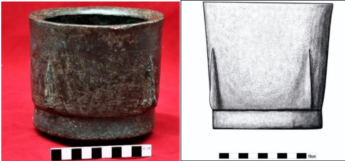
Foto 3. Bronz Havan, Artuklu Dönemi (12-13 yy.), Döküm tekniği, Envanter no: 2021-916. Ağzı Çapı: 12.3 cm, Yükseklik: 14,5 cm Çiz. 3: Katalog 3 no'lu Havan'ın çizimi