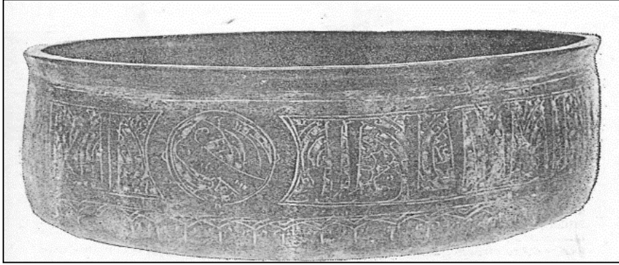
Foto 8. 12-13 yy. Artuklu Dönemi, Bronz Tas, İstanbul Topkapı Sarayı Müzesi ( Erginsoy'dan)

Artuklu maden sanatı içerisinde sevilerek kullanılan bitkisel bezeme kompozisyonları ve kitabe kuşakları, çalışmamıza dahil edilen örnekler arasında yer almaktadır. K-2 no'lu havanın gövdesi üzerinde görülen rumi ve palmet motiflerinin seçilebildiği bezeme programında zeminde boş yüzey bırakılmadan stilize kıvrık dallar ile süslediği görülmektedir. K-5 no'lu kapak ve K-6 no'lu tas örneklerinden anlaşıldığı üzere, yazı frizi içerisinde yer alan kitabe kuşağının zeminin stilize bitkisel süsleme ile doldurulması, Artuklu maden sanatında görülen yazı ve bitkisel bezeme kombinasyonunun ortak bir tutum olduğuna işaret etmektedir.