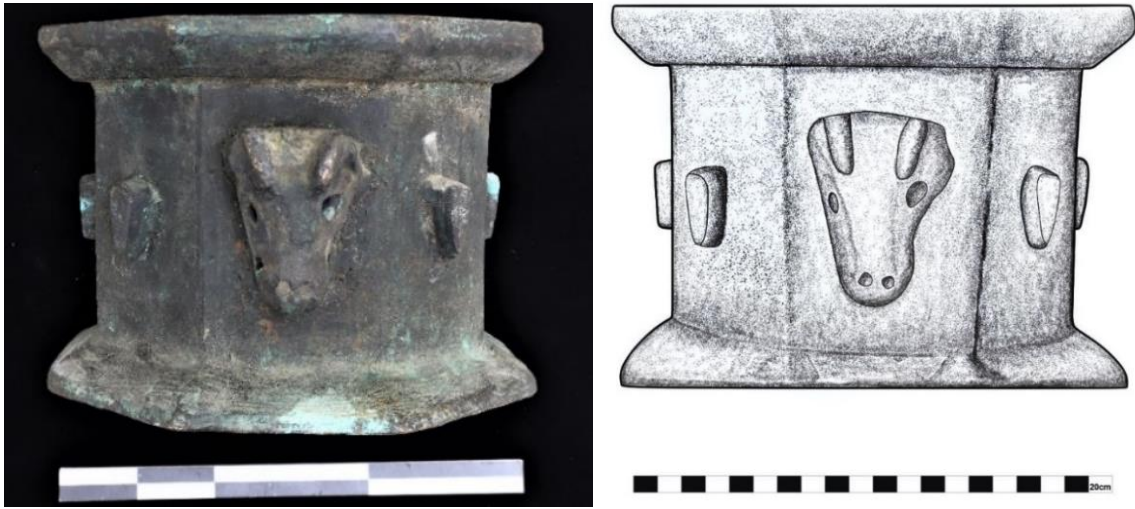
Foto. 1. Bronz Havan, Artuklu Dönemi (12-13 yy.), Döküm tekniği, Envanter No: 2021-917, Ağız Çapı: 19 cm, Yükseklik: 19,5 cm. Çiz. 1: Katalog 1 no'lu Havan Çizimi

Tanımı: İçten dairesel dıştan ongen bir gövde biçimlenişine sahip olan havan, döküm tekniğinde ve tunç malzemedен yapılmıştır. Yüksekliği 14.3 cm ve ağız çapı 15 cm olan havanın gövdesi, ağız ve kaide bölümüne doğru genişleyerek açılmaktadır (Foto 2). Havanın ongen gövdesinden dışa çekik ağız ve kaideye çokgen formda bir silmeyle geçilmektedir. Ağız ve kaide bölümüne geçişi sağlayan ve gövde etrafını muntazam olarak dolaşan silmenin iç yüzeyinde kazıma süsleme tekniğinde oluşturulmuş eğik çentiklere yer verildiği görülmektedir.