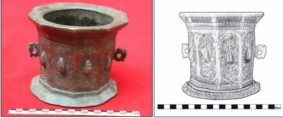
Foto 2. Bronz Havan, Artuklu Dönemi (12-13 yy.), Döküm tekniği, Envanter no: 2021-918. Ağzı Çapı: 15 cm, Yükseklik: 14,3 cm. Çiz. 2: Katalog 2 no'lu Havan'ın çizimi

Tanımı: İçten ve dıştan dairesel bir gövde biçimlenişine sahip olan havan, döküm tekniğinde ve tunç malzemeden yapılmış olup silindirik bir form özelliği ortaya koymaktadır. Havanın, yüksekliği 12.3 cm ve ağız çapı 14.5 cm'dir (Foto 3).