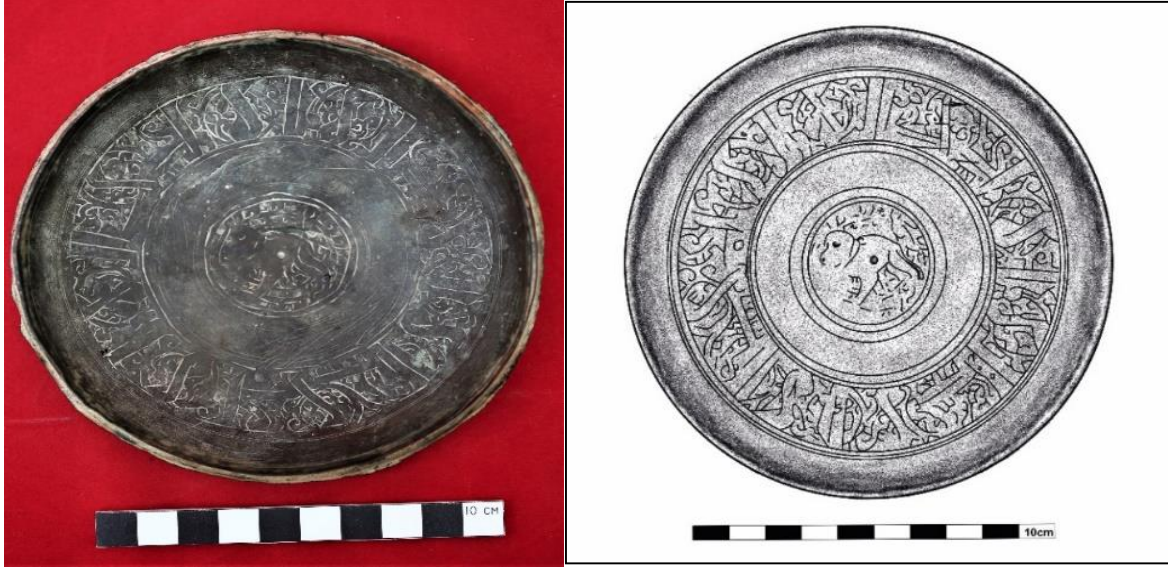
Foto 5. Bronz Kapak Artuklu Dönemi (12-13 yy.), Döküm tekniği, Envanter no: 2021-1, Çapı: 13 cm, Derinlik: 3 cm. Çiz. 5: Katalog 5 no'lu kapak çizimi

Kapağın iç yüzey bezemesinde tam ortada 3.6 cm. çapında ve yuvarlak formda bir madalyon içerisinde hayvan figürüne yer verilmiştir. Madalyonu oluşturan kartuşlar çift çizgi kullanılarak oluşturulmuş ve dört dairesel madalyonun hayvan figürünü çevrelediği görülmektedir. Bu madalyonlardan dıştan ilk ikisi birbirine üzerine kapanmakta ve herhangi bir bezeme unsuru barındırmamaktadır. Sonraki diğer iki kartuş yine çift çizgi kullanılarak oluşturulmuş fakat farklı olarak belli aralıklarda oluşturulmuş dairesel sarmallar yaparak ilerlemekte ve merkezde yer alan hayvan figürünü çevreleyerek kesilmeden devam etmektedir.