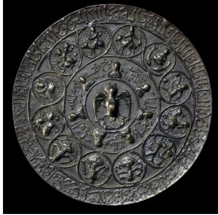
Foto 10. 12-13 yy. Artuklu Dönemi, Artukşah adına yapılmış bronz ayna, Kopenhag David Koleksiyonu [https://islamicart.museumwnf.org/database_item.php?id=object;EPM;dn;Mus21;29;en&cp]

Kitabe kuşaklarının içerikleri incelendiğinde genellikle iyi dilek, bereket, daimilik ve sahibine yücelik katan birtakım ibarelere yer verildiği anlaşılmaktadır. Türk İslam Eserleri Müzesinde yer alan Artuklu dönemine ait bronz aynanın etrafının çevreleyen kitabe kuşağında da benzer bir iyi dilek temennisiyle karşılaşmaktayız. Çalışmamız içerisinde yer alan K-5 ve K-6 no'lu örneklerde bulunan kitabelerin içerikleri incelendiğinde yine Artuklu maden sanatında yer verilen kitabe kuşaklarında ortak bir tutum olduğu ve bunun kronolojik tasnifte sağlama yapabilecek bir metot olduğu anlaşılmaktadır.