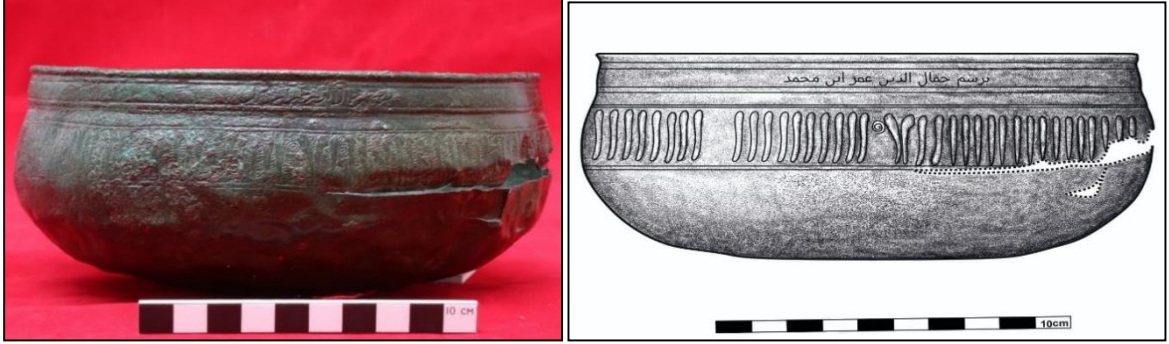
Foto 6. Bronz Tas, Artuklu Dönemi (12-13 yy.), Döküm ve Dövme tekniği, Envanter no: 2021-980, Gövde Çapı: 7 cm, Yükseklik: 17,3 cm. Çiz. 6: Katalog 6 no'lu kapak çizimi

Bu haliyle, eserin Artuklu melikleri için yapılmış özel ve adanmış bir madeni eser olduğu anlaşılmaktadır. Artuklu sahası kitabeleri incelendiğinde (Karaçam, 2012), yazıtlarda ortak birtakım ibarelere yer verildiği ve ortak bir ifade üslubu oluşturulduğu anlaşılmaktadır. Kitabelerde sıklıkla yer alan sıfat ve unvanların madeni eserlerdeki yazı frizlerine de bu üslup birliğine dikkat edilerek yer verildiği görülmektedir. Eserin, üstte içe dönük ağız bölümünde, çift çizgilerle çevrelenmiş ve 1 cm eninde bir kartuş, ağız bölümünü boydan boya dolaşmaktadır. Kartuşun içerisinde sadece bir yer de “biresmi Cemaleddin Ömer ibn Muhammed” olarak okunabilen yapan ustanın adına yer verildiği bir yazı ibaresi bulunmaktadır.