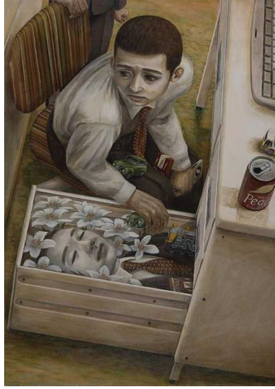
Görsel 15: Tetsuya Ishida, Çekmece, 1996. Tuval üzerine akrilik, 59.4 × 42.0 cm. Shizuoka Valiliği Sanat Müzesi, Japan.

Ishida bu eserde, insanları hem bedenen hem de psikolojik anlamda güçten düşüren, boğucu çalışma ortamını gözler önüne sermiştir (Chao, 2019: 317). Tetsuya Ishida eserlerinde, sadece üretim sistemi içerisinde makineler arasında sıkışan hayatları resmetmenin yanı sıra; Japon aile yapısının da bir eleştirisini yapmaktadır. Çocukların küçük yaştan itibaren özellikle eğitim konusunda yaşadıkları baskı Tetsuya Ishida'nın kendisinin de deneyimlediği acı anılarla dolu bir süreçtir. Okul duvarlarının sınırlarını aşan genç bir çocuğu betimlediği "Mahkûm" (1999) gibi resimler aslında sanatçının anılarını yansıttığı eserlerdir (Görsel 16). Ishida eserdeki çocuğa bakan izleyicinin ruhunu sıkacak derece klostrofobik bir anı görselleştirmiştir (http-3, 2012).