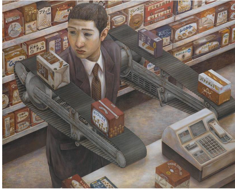
Görsel 10: Tetsuya Ishida, Süpermarket, 1999, ahşap üzeri akrilik, 103 x 146 cm, Shizuoka Valiliği Sanat Müzesi, Japonya.

resmedilmiştir. Figürler mutsuz ve bir o kadar yalnız aynı zamanda bir makine ile bütünleşmiş halde tasvir edilmiştir. Resimlerinde Japonya'da günlük hayattan insanları yaşadıkları zorlu koşullarla birlikte yansıtmıştır. Bu insanlar genelde mutsuz bir yüz ifadesine, olumsuz bir beden diline işaret etmektedir ve bedenleri ya bir makineye ya da gün içinde insanın karşısında çıkan herhangi bir nesneye bağlı şekildedir. (Kavas, 2019: 207). (Görsel 10). Tetsuya Ishida'nın gerçeküstücü bir anlayış ile yaptığı resimlerinde, tüketim toplumunun getirdiği olumsuzluklar, modern bireyin mutsuzluğunun doğrudan sebebi olarak karşımıza çıkmaktadır (Sawaragi, 2019: 59). Aynı zamanda Tetsuya Ishida eserlerinde, kapitalizmin tüketiciye belirlediği rol içinde modern bireyin endişelerini görselleştirmektedir. İzleyicisinin aklından çıkmayan, endüstriyel üretim ve bu üretimin araçları tarafından derisi yüzülen, yutulan ve sömürülen insanları tasvir etmektedir. Bu karanlık fantastik resimler Tetsuya Ishida'nın kişisel duygu dünyası ile de paralellik göstermektedir. 20. yüzyılın başlarında savaş ve hızlı sanayileşmenin yol açtığı yabancılaşmadan doğan tarihsel Sürrealizm ile aynı damarda ilerleyen Ishida'nın çalışmalarının yaygın olarak Japonya'nın 1990'lardaki ekonomik gerilemesinin getirdiği varoluşsal krizleri alegorize ettiği anlaşılmaktadır (Quinton, 2019).