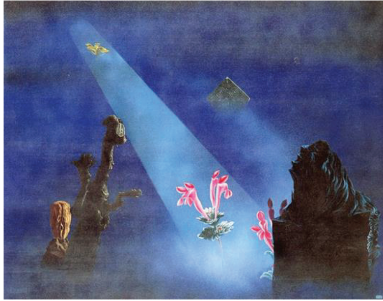
Görsel 7: Kitawaki Noboru, Uykusuz Bir Gece İçin, 1937, 122x130 cm. Kyoto Belediyesi Sanat Müzesi.

II. Dünya Savaşı'nın sona ermesinin ardından ifade özgürlükleri üzerindeki kısıtlamaların kaldırılmasıyla birlikte, Japonya'daki avangard sanatçılar birkaç yıl boyunca yeni bir başlangıç aramışlardır. Resim kariyerine 1920'lerin sonlarında Ernst ve Magritte'in etkisiyle başlayan Jiro Yoshihara'nın, savaştan sonra soyut resmi keşfederek kendi üslubunu yarattığı görülmektedir. Yoshihara'nın, boyanın fiziksel özelliklerini ortaya çıkaracak derecede kullandığı fırçasıyla ulaştığı nokta, basit ve çok yönlü dairenin soyut anlamını oluşturmuştur (Görsel 9). Bu ortamda, savaş öncesinden beri Sürrealizme maruz kalan sanatçılar, kendi soyut anlatım tarzlarını oluşturmayı hedeflemişlerdir. Clark'ın bahsettiği gibi (2013, 179) Japon sanatçılar Sürrealizm özelinde düşünüldüğünde bir benlik ve ikilem sorunu ile karşılaşmışlardır. II. Dünya Savaşı'nın ardından Japon sanatında Sürrealizmden soyut sanata doğru bir gelişim olduğu görülmektedir. Bu gelişimi modern anlayıştan bir kopma olarak düşünmemek gerekir. Bu kendi içerisinde devam eden bir sürekliliğin işareti olarak yorumlanmalıdır. Japonya'da Sürrealizme olan ilginin film özel efektleri ve manga 2 dünyasında sürmesi dikkat çekicidir. Rasyonelliği eleştiren ve gerçekliği yeniden kavramayı hedefleyen Sürrealizmin ruhu, 21. yüzyılda entelektüel ve edebi hareketlerin alanını genişletmeye devam etmektedir (Ulowetz, 2015: 3).