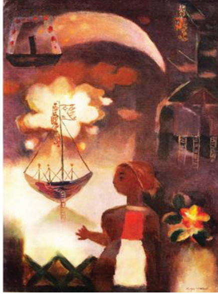
Görsel 5: Harue Koga, Havai Fişek, 1927.

1930'lu yılların ortasına doğru yaklaşan Çin-Japon Savaşı (1937-1945) ve II. Dünya Savaşı Japon toplumunda umutsuzluk ortamının oluşmasına neden olmuştur. Bununla birlikte Japon Sürrealist resmi, Zen Budizmi ve Doğu resim gelenekleri gibi Doğu düşüncesinin unsurlarıyla bağlantı kurma eğilimi göstermiştir. Bu etkiler Japon Sürrealist sanat ortamı açısından yeni yaklaşımların ortaya çıkmasına neden olmuştur. Koga Harue (1895-1933) ve Migishi Kotaro (1903-1934), ilham aldıkları Sürrealist fikir ve eserlerle Doğu unsurlarını birleştiren fantastik resimler yaratmışlardır (Görsel 5-6).