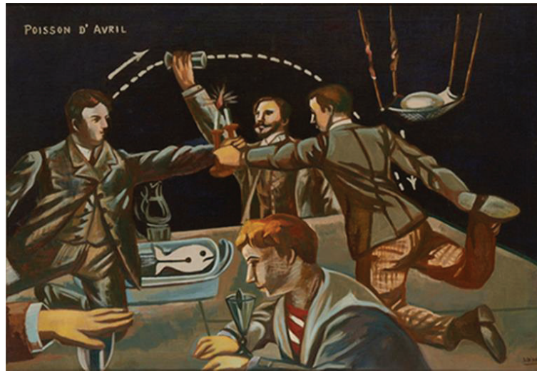
GörSEL 4: Ichiro Fukuzawa, Nisan Şakası, 1930, Ulusal Modern Sanat Müzesi, Tokyo.

1930'lu yıllarda Ichiro Fukuzawa'nın (1898-1992) avangard resimleri (GörSEL 4) ve stili 'Sürrealizm' olarak tanımlanmıştır ve diğer sanatçılar tarafından taklit edilmeye başlanmıştır. Ancak Japonya'daki Sürrealizm, modern rasyonalizmi aşarak onun ötesindeki gerçekliğe sahip olmaya yönelik ideolojik bir hareket olarak değil, ayrı bir hayal ve yanılsama dünyasını temsil eden farklı bir resim stili olarak anlaşılmıştır. Max Ernst'in (1891-1976) kolâj sanatından ilham alan Ichiro Fukuzawa, çalışmalarında iktidar sahiplerinin iddialarını sık sık çarpıtarak esrarengiz ve çoğu zaman anlamsız görüntülerle dolu Sürrealist bir eğilim ortaya koymuştur (Gleason, 2022). Ichiro Fukuzawa'nın erken dönem çalışmaları deşifre etmek bazen zor olsa da, çalışmalarında sanatçının bakış açısı açıkça görülmektedir. İlham almak için rüyalara yönelen Sürrealistlerin aksine, Ichiro Fukuzawa insanların zaaflarından çok etkilenmiştir ve çelişkilerle dolu bu zaaflar ile alay etmek için Sürrealizmin araçlarını kullanmıştır.