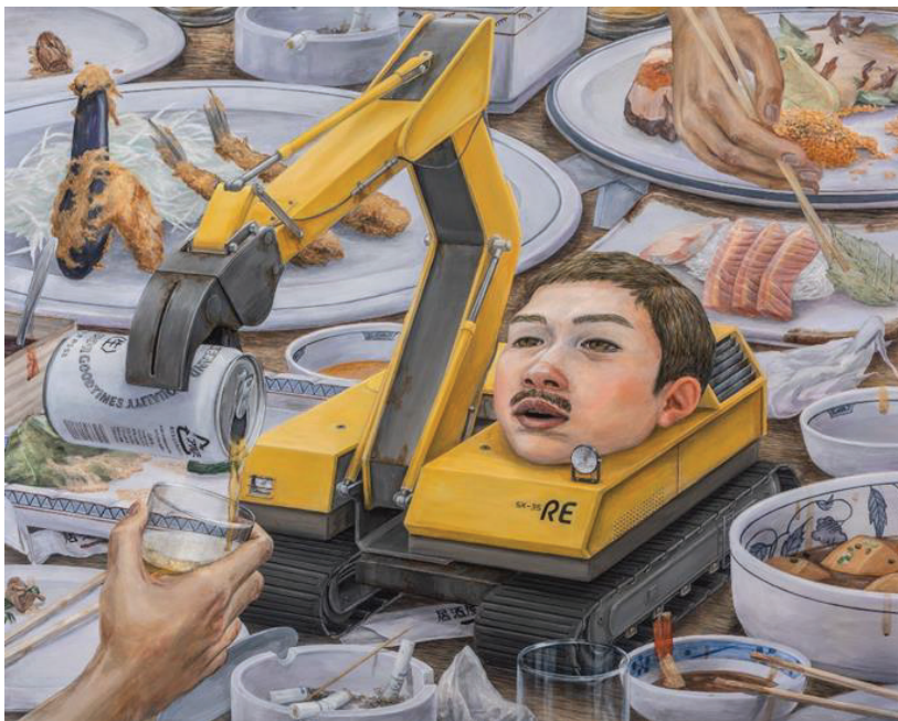
Görsel 18: Tetsuya Ishida, Bağlantı, 1998, Ahşap üzerine akrilik, 91 x 116.7 cm, özel koleksiyon.

Bu noktada Ishida'nın "otoportresi" onun imzasıdır ve çalışmaları için güçlü bir bağlam sağlamaktadır. Bir eserin anlamını belirleyen temsili 'Yüze' "karakter" denildiğini düşündüğümüzde; Ishida'nın "otoportresi"nin, kendisiyle diyalog kurmanın bir yolu olarak yarattığı bir "otoportre karakteri" olduğu anlaşılmaktadır (Saito, 2019: 71). 2000'den sonra, resimler genellikle ressamın benzeyen bir çocuk veya kadınsı bir varlık içermektedir (Uno, 2019: 98). Ishida'nın resimlerindeki figürler, kederli ve mağlup yüzleri düşünüldüğünde kelimenin tam anlamıyla kendi modern toplumlarına dâhil olan kaderlerini kabul ettiklerini göstermektedir (Görsel 17).