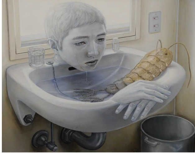
Görsel 17: Tetsuya Ishida, Vücut Sıvısı, 2004. Tuval üzerine akrilik ve yağlı boya, 45.5 x 53.0 cm. özel koleksiyon.

kusurlu bir kişilikle dolup taşan sembolik bir varlıktır. Tetsuya Ishida'nın eserlerinde görülen figürlerin tamamı kendine benzer şekilde resmedilmiştir. Ishida'nın "otoportresi" her ne kadar grafiksel olsa da manga benzeri bir "karakter" gibi görünmemektedir. Bununla birlikte, Ishida'nın çalışmalarının temel çekiciliği, tekrar tekrar yayılan tek bir yüzün yoğunluğudur.