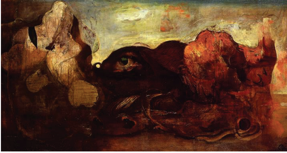
Görsel 8: Aimitsu, Bir Gözle Manzara, 1938, 193.5 x 102.0 cm, Ulusal Modern Sanat Müzesi, Tokyo