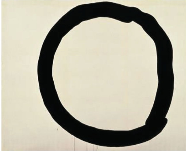
Görsel 9: Jiro Yoshihara, İş, 1965.