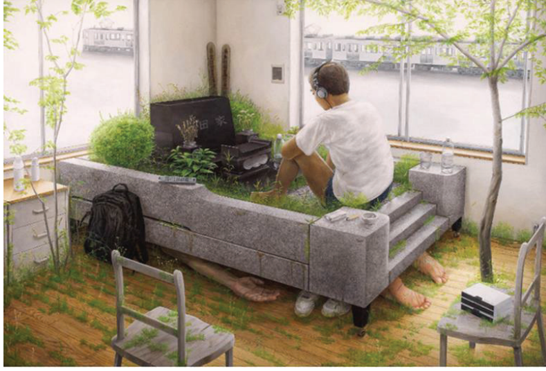
Görsel 20: Tetsuya Ishida, 'İsimsiz', Tuval üzerine yağlıboya, 130 x 194 cm, 2001.

2001 yılında yaptığı 'İsimsiz' adlı çalışmasında yatağında müzik dinleyerek oturan bir çocuk görülmektedir (Görsel 20). Sırtı izleyiciye dönük olan çocuğun bulunduğu yatak aslında üstündeki çimen ve başlığı ile bir mezardır. Sahne ilk başta sakin ve sıradan görünmektedir. Ancak daha yakından bakıldığında bu yanılsama kaybolmaktadır ve izleyici, kahramanın oturduğu yatağın aslında bir müzik seti yerine sanatçının soyadının yazılı olduğu bir mezar taşı olduğunu keşfetmektedir. Ishida, sahneyi belirsizlikle doldurmuştur ve aynı zamanda bu görsel bulmacayı çözmek için izleyiciye ipuçları sunmaktadır. Sanatçı, iç mekânın ön planında yer alan boş sandalye ile izleyicisini bu gerçeküstü dünyaya davet etmektedir. Ishida varoluş ve ölüm arasında, varoluşsal farkındalığını çağırarak ve aynı zamanda, sanatçıya ve bize memento mori 4 olarak hizmet eden kendi ölümlülüğümüzü hatırlatmaktadır. Sırt çantası ve bantlar, dünyevi mülklerin simgesidir ve bu görüntü, 16-17. Yüzyıl Kuzey Avrupa Sanatında yaygın olarak karşılaşılan Vanitas'ların sembolik bir yansıması olarak işlev görmektedir. Dünyevi hayatın anlamsızlığı ve tüm dünyevi mal ve uğraşların geçici doğası izleyiciye hatırlatılmaktadır (http-4, 2012).