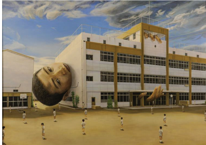
Görsel 16: Tetsuya Ishida, Mahkûm, 1999. Ahşap üzerine akrilik, 103.0 × 145.6 cm. özel koleksiyon.

Ishida bu eserde, insanları hem bedenen hem de psikolojik anlamda güçten düşüren, boğucu çalışma ortamını gözler önüne sermiştir (Chao, 2019: 317). Tetsuya Ishida eserlerinde, sadece üretim sistemi içerisinde makineler arasında sıkışan hayatları resmetmenin yanı sıra; Japon aile yapısının da bir eleştirisini yapmaktadır. Çocukların küçük yaştan itibaren özellikle eğitim konusunda yaşadıkları baskı Tetsuya Ishida'nın kendisinin de deneyimlediği acı anılarla dolu bir süreçtir. Okul duvarlarının sınırlarını aşan genç bir çocuğu betimlediği "Mahkûm" (1999) gibi resimler aslında sanatçının anılarını yansıttığı eserlerdir (Görsel 16). Ishida eserdeki çocuğa bakan izleyicinin ruhunu sıkacak derece klostrofobik bir anı görselleştirmiştir (http-3, 2012).