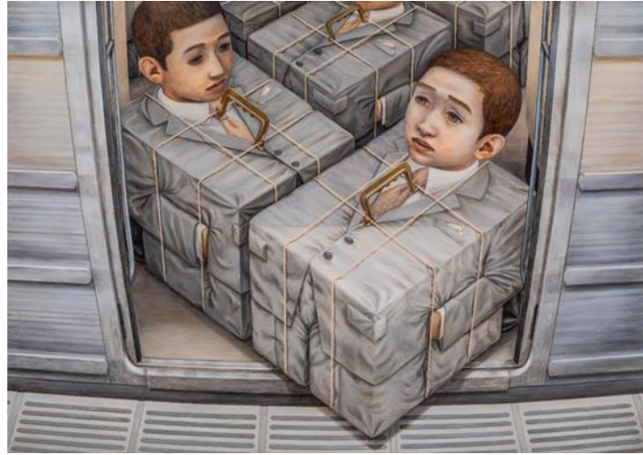
Görsel 13: Tetsuya Ishida, Kargo, 1997. Ahşap üzerine akrilik, 103.0 × 145.6 cm. özel koleksiyon.

Tetsuya Ishida, Japonya'da milenyum öncesi hem ekonomik durgunluğun zirvesinin hem de toplumsal bunalımın yaşandığı bir ortamda büyümüştür ve çalışmaları genellikle bu dönemi karakterize eden umutsuzluk ve yabancılaşma duygularıyla ilişkilidir. Ayrıca otomat insan imgesi sanatçının gelişen teknolojilerle ilgili paralel endişelerini de yansıttığı bir temadır. Bu noktada, Ishida'nın on yıllık sanat kariyerinin 1995'te öne çıkması son derece anlamlı hale gelmektedir (Saito, 2019: 70). Sanatçının 1997 tarihli 'Kargo' adlı eserinde olduğu gibi (Görsel 13), işçilerin ve paketlenmiş malların tamamen tedarik zincirinde birleştiği hizmet ekonomisinin görsel bir sunumunu yaptığı görülmektedir. Yaşadığı dönemin toplumsal psikolojisinden oldukça etkilenen Tetsuya Ishida karamsar denilebilecek ölçüde