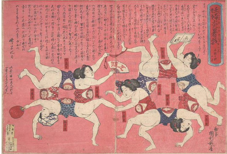
Görsel 1: Utagawa Kunitoshi, "Yaz sıcağında oynayan hamile kadınlar- Beş başlı On Beden", 1881

Fransa'da ortaya çıkan Sürrealizm 1930'larda Japonya'ya ulaşmıştır ve Japoncaya "ultrarealizm" (chogenjitsu shugi) olarak çevrilmiştir. O yıllarda Sürrealizm avangard bir stil olarak Japonya'da büyük sansasyon yaratmıştır. Aslında Japon Sürrealizmi, benzersiz bir sanatsal deneyimle sonuçlanan farklı etkilerin uzun bir tarihini yansıtmaktadır. Sürrealist sanatçılar bedeni çarpıtmayı yeni bir sanatsal deneyim olarak keşfetmişlerdir ancak bu durum Japon sanatı açısından Sürrealizmden çok daha önce var olan bir eğilimdir. 19. Yüzyıl Japon ahşap baskılarında bedenin biyolojik süreçleri ile ilgili yaratıcı bir görsel kültürün olduğu görülmektedir (Görsel 1).