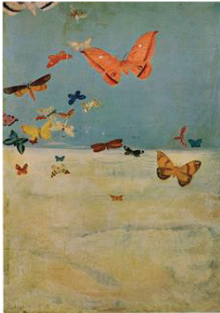
Görsel 6: Migishi Kotaro Bulutların Üzerinde Uçan Kelebekler, 1934, Ulusal Modern Sanat Müzesi, Tokyo.

Noboru Kitawaki (1901-1951) ve Aimitsu (1907-1946), Doğu resminin metafizik arayışlarına felsefi bir yaklaşım getirmişlerdir (Görsel 7-8). 1930'ların başında Japonya'da coşkuyla karşılanan Sürrealizm, pratikte kendi sanat teorilerini, kendi politik ve sosyal imgelerini yeni anlayış içinde kullanan sanatçılar tarafından yeni imgelerle ifade edilmiştir (Wu, 2014: 195).