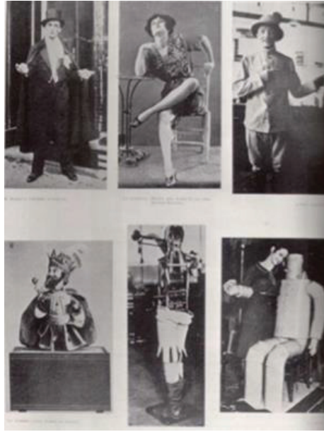
Görsel 14: Benjamin Pêret, Otomatlar ve Modeller, Minotaure Dergisi 1933.

eserler ortaya koymuştur. Tetsuya Ishida'nın otomat figürlerinde insanın makinelere boyun eğişi ve içinde bulunduğu Distopik durumu yansıtmaya şekli sanatçının Sürrealist yönünü Distopya ile ilişkilendirmektedir ve onun sanatsal üslubunu tanımlamak için Distopik Sürrealizm şeklinde yorumlanabilir. Sürrealist sanatçı Benjamin Pêret'nin (1899-1959) 1933 yılında Minotaure'da yayınlanan makineleşmiş insanları temsil eden fotoğraflarına baktığımızda (Görsel 14) insanların makine ile olan ilişkisinde kendisine ait olan bazı değerleri yitirip metalaştığı ve ardından tekinsiz birer nesneye dönüştüğü görülmektedir (Kavas, 2019: 210).