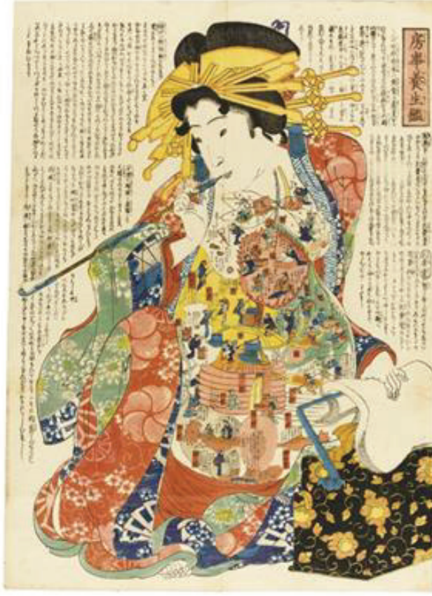
Görsel 2: Sağlıklı bir cinsel yaşam için diyet tavsiyesi, Bilinmeyen sanatçı – gravür – 1855.

bakıldığında bedenın çarpıtılması Sürrealist sanatçıların yaptığı gibi sınırları zorlama eğiliminde değildir (Ulowetz, 2015: 2).