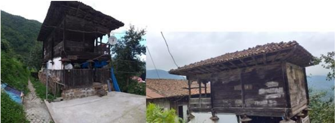
Fotoğraf 5. Temel Kullanım Amacını Yitirmiş Olmakla Beraber Meskenin Yakınında Bulunan Serenderden Bir Görünüm