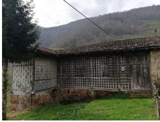
Fotoğraf 7. Ahşap ve Taşın Beraber Kullanıldığı Geleneksel Meskene Bir Örnek

Orhan, 2019: 57-58). Mesken yapımında kullanılan ikinci ürün ise taştır. Ahşap ile birleşerek mesken yapımında kullanılan taşlar yakın çevredeki dere ve ırmak kenarlarından ya da taş ocağında çalışan işçiler tarafından getirilmiştir. Bunun yanı sıra taş yapı malzemesi olarak meskenlerin temelinde, toprağa gömülmüş olan kısmında ve evin yamaca bakan duvarında yoğun olarak kullanılmıştır (Fotoğraf 7). Meskenlerin yapımında kullanılan taş, bazen moloz halinde bazen de kesme taş şeklinde kullanılmaktadır. Taşın kullanımındaki temel amaç ahşap malzemenin toprakla teması önlemek, yaşam alanının yerden yüksekliği arttırmak ve rutubete karşı koruyucu bir önlem geliştirmektir (Orhan, 2019: 59). Tamamıyla olmasa da, meskenlerin belli bölümlerinde (özellikle sonradan eklenen kısımlarında) briket/pirket kullanımı da görülmektedir. Nitekim briket, insanın kolaylığı ve meskenin kısa sürede tamamlanabilmesini sağlaması sebebiyle tercih edilmektedir (Hayli, 2001: 29). Doğu Karadeniz Bölümünde olduğu gibi araştırma sahasında da yaygın olarak briket kullanılmakta ancak söz konusu yapı malzemesinin bölgenin doğal koşullarına uygun olmaması (Eruzun, 1972: 54) ve rutubeti kusması (Özgüner, 1970, 23; Orhan, 2019: 6 ) kullanımının yaygınlaşmasını engellemiştir.