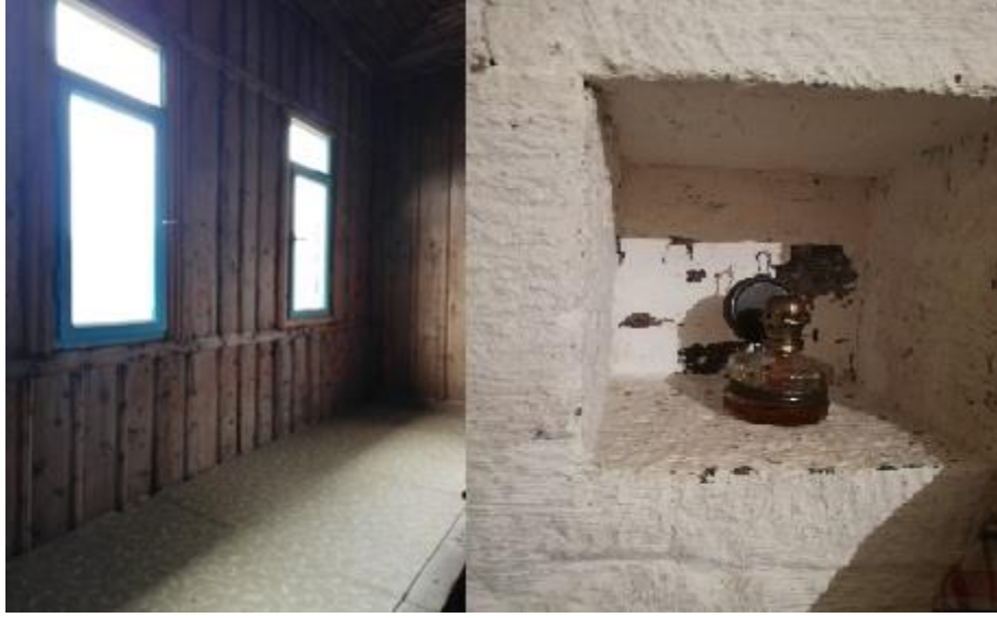
Fotoğraf 5. Kör Pencere ve Bazı Meskenlerde Kullanım Amacının Dışına Çıkarak Yüklük Olarak Kullanılan Sedir

Bu odalar meskenin vadi manzarasına bakan yönünde bulunmaktadır. Salon veya mutfak gibi ortak kullanım alanının çevresindeki odalar ise ailenin genç ve bekar bireyleri ile ebeveynlere ait odalar olmakla beraber bu odalar hem dizayn hem de süsleme açısından az önce bahsi geçen misafir odalarına göre daha sade görünmektedir.