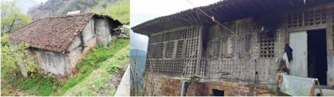
Fotoğraf 3. Yağış Şatlarına Bağlı Olarak Uzun Tutulmuş Saçaklar ve Semer Çatı Örneği

bulundurularak birden fazla yöne eğimi olacak şekilde yapılmıştır. Karacakaya Mahallesi'nde, maliyeti ve yapımı daha kolay olduğu için genel olarak meskenlerin çoğunda semer çatı tercih edilirken, meskenlerin eklentilerinin bir kısmında semer çatı bir kısmında ise dört omuz çatı sisteminin kullanıldığı görülmüştür. Çatıların önemli özelliklerinden biriside, yağış miktarının fazlalığından meskenin yan duvarlarının korunabilmesi için saçakların uzun tutulmuş olmasıdır. Saçakların uzunluğundan kışlık odunların dizilip yağmurdan korumak ve yerden tasarruf etmek amacıyla faydalanılmaktadır (Fotoğraf 8). Kullanılan malzemeye göre duvarların kalınlığı değişiklik göstermektedir. Taş malzeme kullanılarak yapılmış duvarların kalınlıkları ahşap ve ahşap-taş dolgu duvarlara göre daha fazladır. Çalışma sahasında dış duvarlar genellikle ahşap-taş dolgu ya da sadece ahşap kullanılarak yapılmış olmakla beraber, eğimli yamaçlara denk gelen cephelerde duvar yapımında sadece taş malzemenin kullanıldığı ve kalınlığının 1 metreden fazla olduğu saha incelemesi esnasında görülmüştür. Ayrıca diğer cepheleri ahşap olan evlerde ateş yakılan ocaklıklar ve soba bacaları yangın riskini en aza indirmek amacıyla taş malzeme kullanılarak yapılmış cepheye denk gelmektedir (Orhan, 2019: 74).