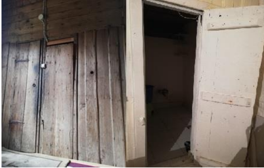
Fotoğraf 6. Kişiyeye Özel Odasında Bulunan Banyolardan Bir Görünüm

Bölge genelinde olduğu gibi araştırma sahası da orman varlığı bakımından zengindir. Bu sebeple meskenlerin yapımında kullanılan temel yapı malzemesi ahşaptır. Ayrıca ahşabın kolaylıkla işlenmesi ve istenen şekle sokulabilmesi, sıcaklık ve rutubeti geçirmeyen bir yapı malzemesi olması (Tanoğlu, 1969: 222) ile çok katlı binaların yapımına olanak sağlaması (Doğanay ve Orhan, 2014: 279) gibi avantajları kullanımını yaygınlaştırmıştır. Ahşap malzemenin elde edilmesinde farklı ağaçlar kullanılmaktadır. Bu ağaçların seçiminde neme dayanıklı olması, işlenebilirliğinin kolay olması, yakın çevreden kolay ve ucuz bir şekilde temin edilebilir olması gibi hususlar etkilidir. Nem ve sıcaklık değerlerinin yüksek olduğu araştırma sahasında geniş yapraklı ağaç türleri tercih edilmektedir ve en çok tercih edilen ise kestanedir. Çünkü bu ağacın kerestesi, kolay kolay alev almadığı gibi tahta kurdu ve kurusu işlemeyecek kadar da serttir (Özgüner, 1970: 22;