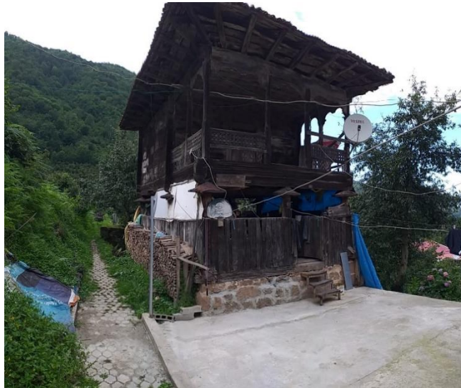
Fotoğraf 1. Çeşitli İhtiyaçlar Doğrultusunda Kullanılan Serenderden Bir Görünüm

Meskenler araştırma sahasında dağınık bir yerleşme dokusu göstermekle beraber Karadeniz Bölgesi'nde kırsal meskenler açısından en dikkat çekici olgu olan, ekime elverişli arazi neredeyse, konutun da orada olduğu gerçeği (Arıncı, 2019: 231) araştırma sahasında da kendini göstermektedir. Meskenlerin konumlandırıldıkları arazi parçası genellikle tarımsal faaliyetlerini gerçekleştirdikleri arazilerin üst kısmında ya da yakınında bulunmaktadır. Bunun en temel sebebi başta fındık ve mısır tarımının yapıldığı araziler olmak üzere geçimlerini sağladıkları bu arazileri yabancı hayvanlardan korumaktır. Bunlara ek olarak meskenlerin bitişiğinde yer alan küçük tarlalarda ailenin ihtiyacına yönelik olarak birden çok ürünün bir arada yetiştirildiği polikültür tarım yapılmaktadır. Polikültür olarak tarımı yapılan ürünler arasında mısır, fasulye ve karalahana önemli bir yere sahiptir. Çay tarımının mesken mimarisi üzerindeki etkisi yok denecek kadar az olmakla beraber fındık ve mısır tarımının mimari üzerindeki etkisi kendini açıkça belli etmektedir. Fındık ve mısırın toplanması, kurutulması ve depolanması yöre halkının sorumluluğundadır. Bu işlemleri gerçekleştirebilmesi amacıyla da çeşitli ev ve eklentileri ortaya çıkmıştır. Bunların en güzel örneği ise çalışmamızın ilerleyen kısımlarında detaylıca yer verdiğimiz serenderler oluşturmaktadır. (Fotoğraf 1).