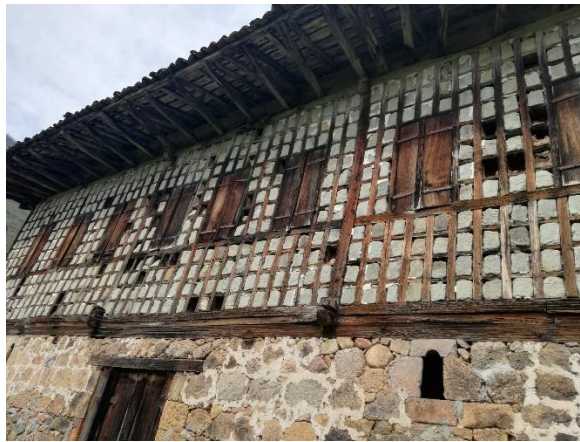
Fotoğraf 4. Çift Kanatlı Ahşap Pencere Kullanılmış Bir Mesken Örneği

Sahada pencereler genellikle ahşaptan yapılmış, kare veya dikdörtgen formatındadır. Boyutlarında ise herhangi bir standart yoktur. Küçük olanlar (ahır veya tuvalet vs. pencereleri) genellikle sabit olmakla beraber büyük olanlar ise aşağıya doğru veya yanlara doğru açılmaktadır. Genel olarak dikdörtgen görünümlü pencereler tercih edilmiştir. Bunun en temel sebebi ise güneşlenme süresinin düşük olması nedeniyle meskenlerin içinin daha fazla aydınlanması hedeflenmiş olmasıdır (Koday, 2003: 95; Fotoğraf 9). Meskenlerin kapıları ahşap malzemedan yapılmış olmakla beraber çift kanatlıdır ve evin içerisinden kanca şeklinde kilit sistemine sahiptirler.