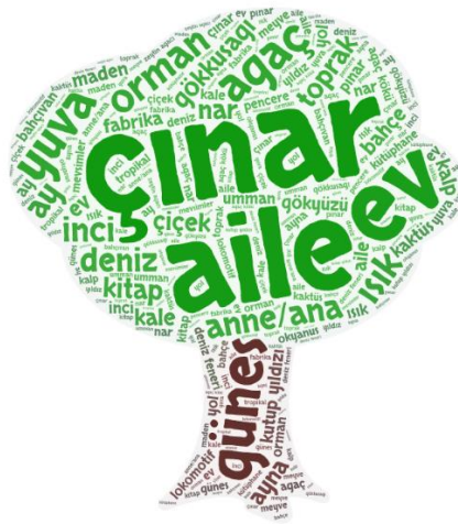
Şekil 2: “Ankara İlahiyat” Nitelemesine İlişkin Birden Çok Tekrarlanan Metaforlar Kelime Ağacı

Tablo 2’de görüldüğü gibi, en sık tekrarlanan 11 metafor çınar (f18), aile (f13), güneş (f13), yuva (f11), ev (f10), gökkuşluğu (f7), ağaç/orman (f7), ana/anne (f5), deniz (f5), kitap (f5) ve toprak (f5), metaforlarıdır.