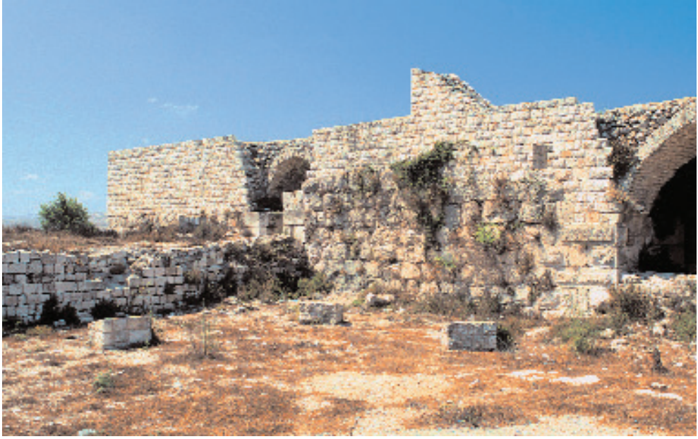
Ek 6: Haçlı donjonunun kuzeydoğu cephesi 115