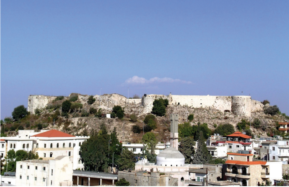
Ek 2: Kalenin güneybatıdan görünümü, ön planda Tibnîn Köyü 112