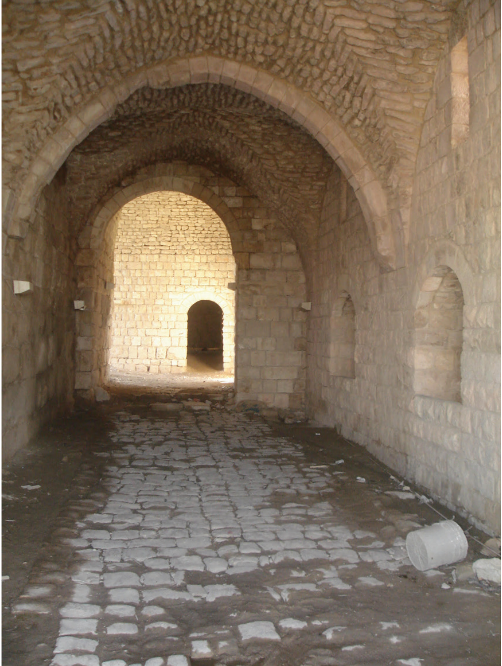
Ek 5: Giriş Holü