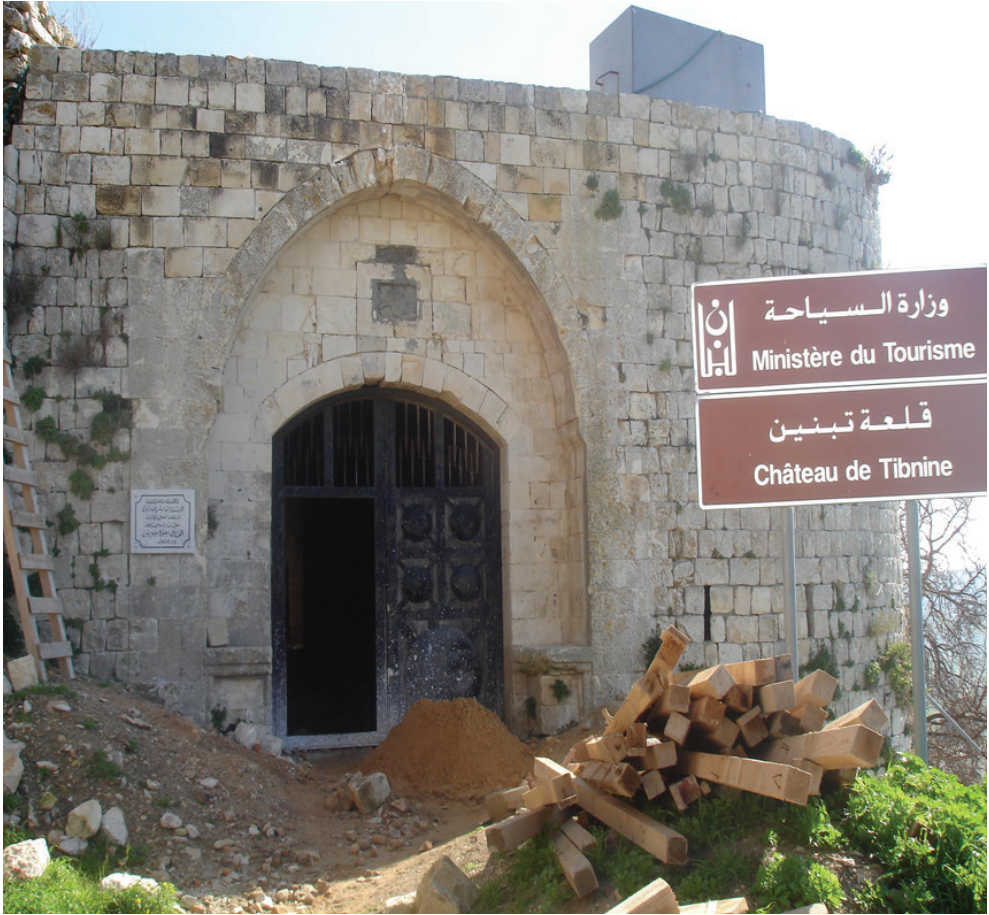
Ek 4: Toron Kalesi'nin Kapısı 114