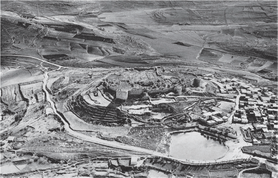
Ek 3: Tibnîn'in gökyüzünden görünümü 113