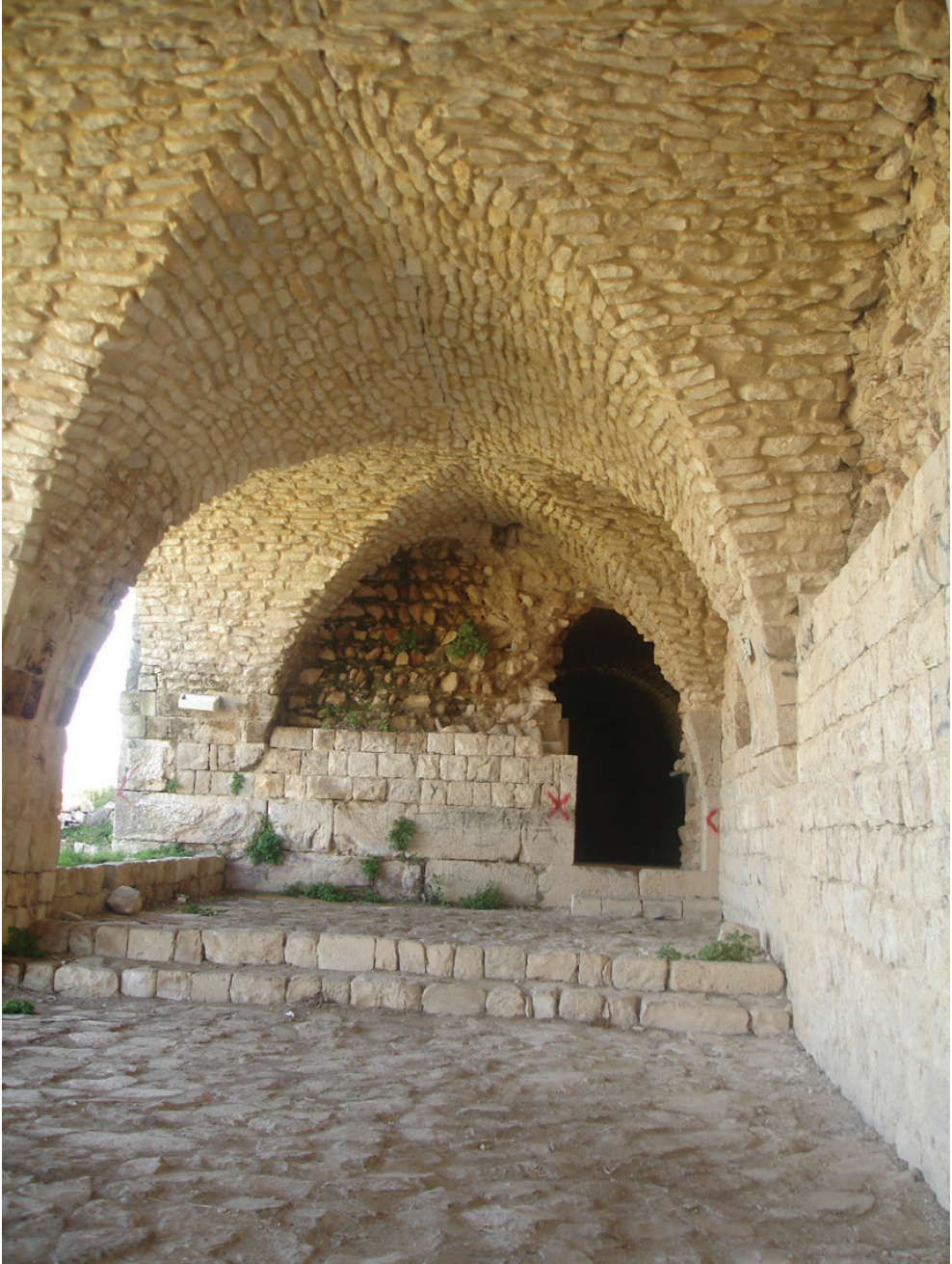
Ek 8: Haçlı donjonu (baş kulesi) olan A kulesinin kuzey köşesindeki görünüm, orijinal eşikli eski yan girişinin kalıntılarını gösteriyor.