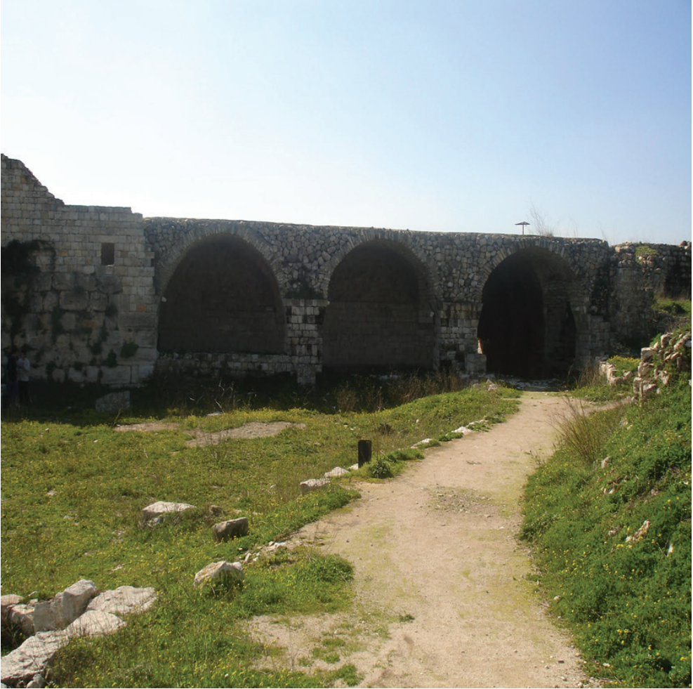
Ek 7: Fotoğrafın solunda, Haçlı donjonunun kuzeydoğu cephesinden bir görünüm