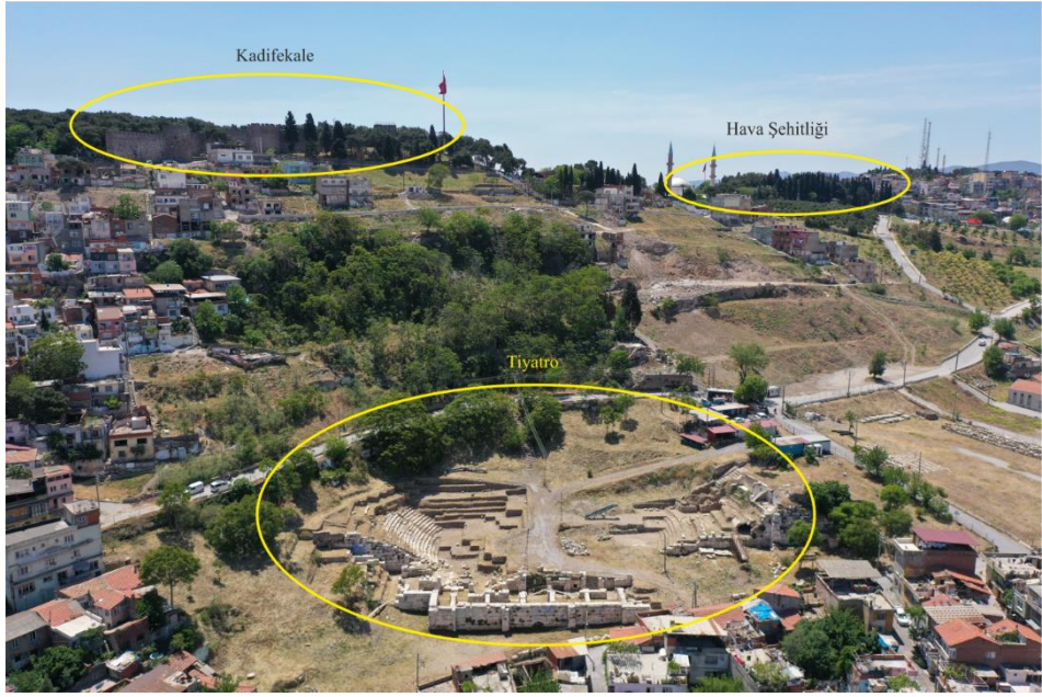
Figür 1. Kadifekale Hava Şehitliği genel görünüm

Figür 4. İmparatorluk Dönemine ait çeşitli formlar ve pişirme kapları Figür 5. Geç Hellenistik-Erken İmparatorluk Dönemine ait kandil, figürin, cam kaplar ve mimari parçalardan örnekler