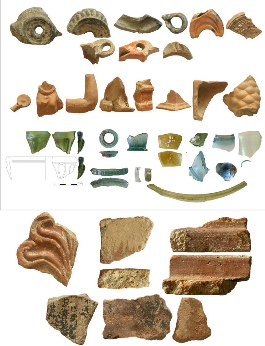
Fig.5. Geç Hellenistik-Erken İmparatorluk Dönemine ait kandil, figürin, cam kaplar ve mimari parçalardan örnekler