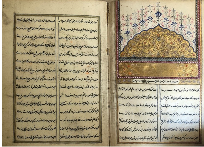
Şekil 9. 1507 envanter numaralı yazma eserin takdim sayfası, İzmir Milli Kütüphane (G. Güney Zincir, 2022).