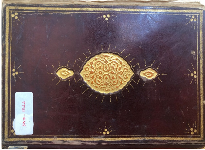
Şekil 6. 1522 envanter numaralı yazma eserin kapağı, İzmir Milli Kütüphane (G. Güney Zincir, 2022).