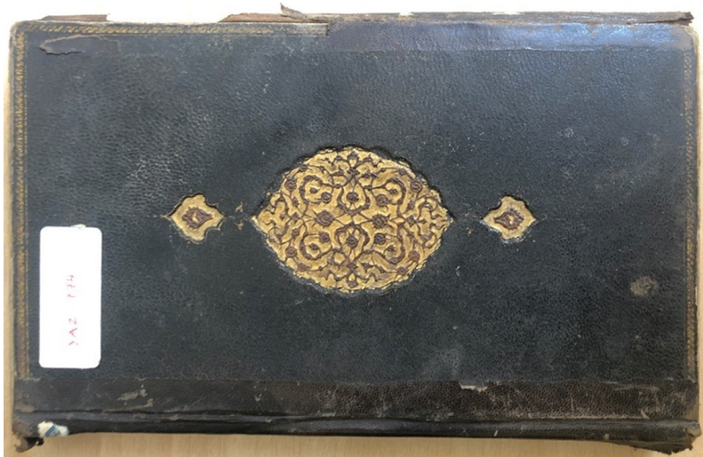
Şekil 10. 774 envanter numaralı yazma eserin kabi, İzmir Milli Kütüphane (G. Güney Zincir, 2022).