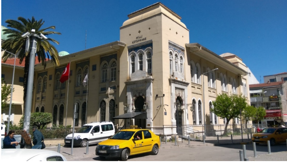
Şekil 1. İzmir Milli Kütüphane, genel görünüş (İzmir Renkleri, t.y.).

dergi vs. olmak üzere çok zengin bir eser koleksiyonuna sahiptir. Başlangıcında bağış yolu ile oluşturulan kütüphanenin eser varlığı, satın alma yoluyla gelen az sayıda eser ile esasen devlet nüshası denen kitap, gazete ve dergilerden oluşmaktadır. İzmir Milli Kütüphane, 1934 yılında çıkarılan ve 2527 sayılı Basma, Yazı ve Resimleri Derleme Kanunu'nun 8. Maddesi uyarınca Türkiye'de derleme nüshasından yararlanan 5 büyük kütüphaneden birisidir. Bu yasa uyarınca 1934'ten beri Türkiye'de çıkmış bütün kitap, gazete, dergi ve diğer yayınlar kütüphaneye gönderilmektedir (Serçe, 1996, s. 98), (bkz. Şekil 1).