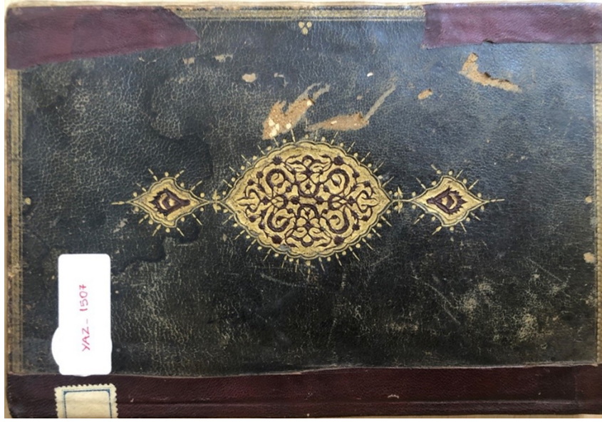
Şekil 8. 1507 envanter numaralı yazma eserin kabi, İzmir Milli Kütüphane (G. Güney Zincir, 2022).