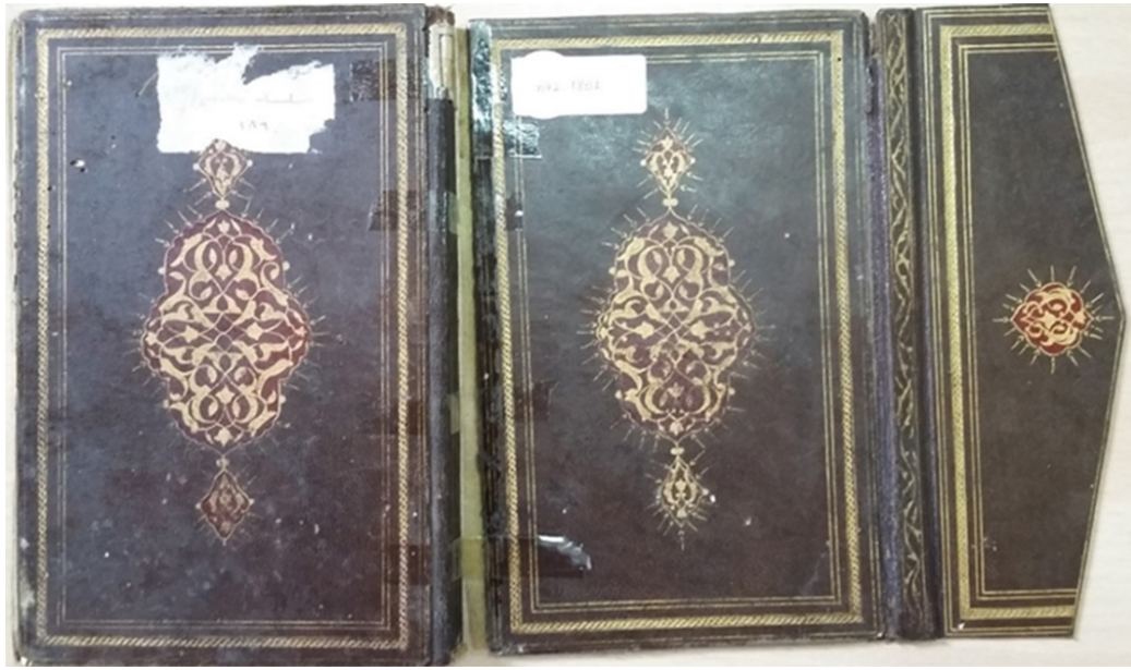
Şekil 4. 1851 envanter numaralı yazma eserin kabi, İzmir Milli Kütüphanesi (G. Güney Zincir, 2022).