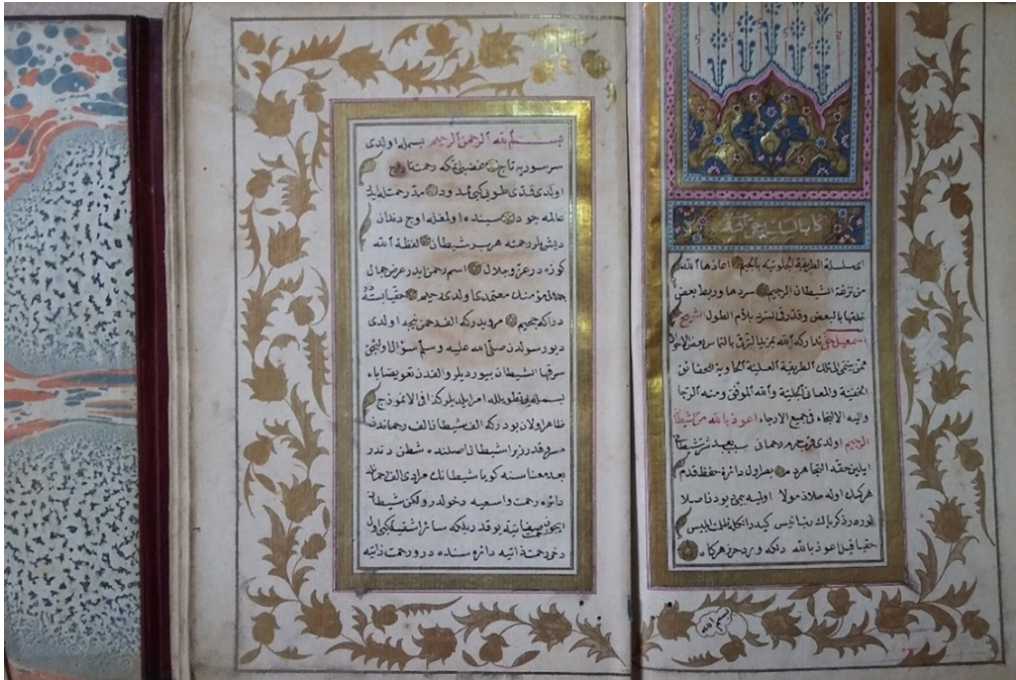
Şekil 5. 1851 envanter numaralı yazma eserin takdim sayfası, İzmir Milli Kütüphanesi (G. Güney Zincir, 2022).