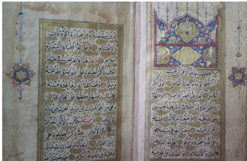
Şekil 2. 1957 envanter numaralı yazma eserin takdim sayfası, İzmir Milli Kütüphane (G. Güney Zincir, 2022).