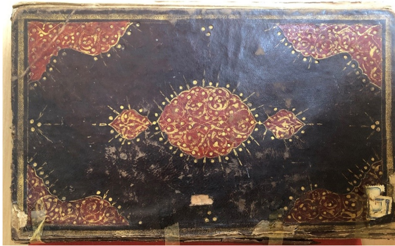
Şekil 11. 1618 envanter numaralı yazma eserin kabi, İzmir Milli Kütüphane.