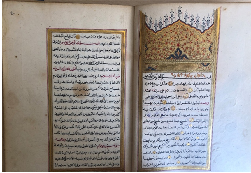
Şekil 7. 1522 envanter numaralı yazma eserin takdim sayfası, İzmir Milli Kütüphane (G. Güney Zincir, 2022).