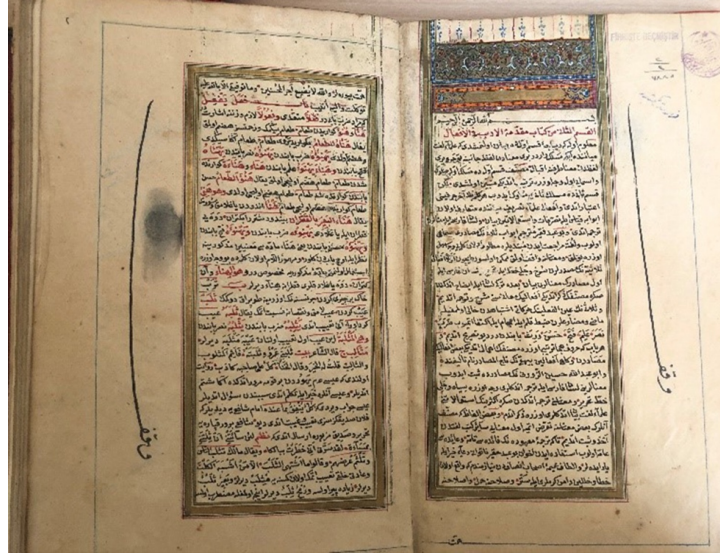
Şekil 12. 1618 envanter numaralı yazma eserin takdim sayfası, İzmir Milli Kütüphane (G. Güney Zincir, 2022).

Eser kütüphanede 1851 envanter numarası ile kayıtlıdır. H.1281/M.1803 tarihli eser 195x125mm-120x60 mm ölçülerinde mülevven cilttir. Kahverengi olan deri cildin şemse ve köşebentleri farklı renkte deri ile kaplanmış, altın ile motif ve kompozisyonlar oluşturulmuştur. Eserin alt ve üst kabı aynı motif ve kompozisyonla tezyin edilmiştir. Cilt sanatı açısından özellikli olan bir diğer ise 1911 envanter numaralı, Kemalpaşazade İbn-i Kemal (M.1946-1534)'in Nigaristan adlı eseridir. Nigaristan Şeyh Sadi'nin Gülistanı'na karşılık olarak kaleme alınmış makâmedir. Eser H.939/M.1532 tarihlidir. 260x150 mm-180x85 mm ölçülerindedir. Kahverengi alttan ayırma şemse cildi vardır. Şemse içi saz yolu üslubunda yaprak ve hatâyî grubu motifler ile serbest olarak tasarlanmıştır. Bir diğer örnek ise 399 envanter numaralı Molla Hüseyin Muhammed b. Feramuz b. Ali'nin Hanefî fıkıh kitaplarını esas alarak hazırladığı hukuk metni olan Gurer'ül Ahkâm adlı eseridir. İstinsah tarihi H.1009/M.1600'dür. Eser 240x150mm-165x85mm ölçülerinde kahverengi, deri, alttan ayırma şemse ciltten oluşmaktadır. Eser 17. yy'a ait olmasına rağmen cilt tezyinatında işçiliğe önem verilmemiştir. Geç dönem ciltlerinde şemselerde yer alan motif ve kompozisyonlardaki bozulmalar burada da görülmektedir. Özellikle kompozisyonlarda yaprak ve hatâyî grubu motiflerde bozulmalar görülmektedir.