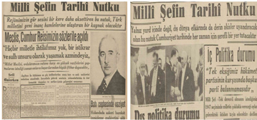
Resim 11. 1944 ve 1945'te İsmet İnönü'nün Meclis açılış konuşması haberleri (Cumhuriyet: 1).

Cumhuriyet 'in haber dili de 1945 sonrasında değişmiştir; İnönü, "milli şefimiz, cumhurbaşkanımız" şeklinde değil, adı ve soyadıyla ya da "Sayın İnönü" hitabıyla yer almaya başlamıştır. 1944'te sıklıkla yer verilen "Millî Şefin Direktifi" başlıklı haberlere 1945'te rastlanmamaktadır. İnönü'nün Meclis açılış konuşmaları 1944 ve 1945'te "tarihi nutuk", 1946 ve 1947'de ise "Meclis İnönü'nün nutkile açıldı" başlığıyla haberleştirilmiştir. 1945 öncesi verilen talimat üzerine olsa gerek İnönü'nün aynı fotoğrafının kullanıldığı, sonraki yıllarda ise farklı fotoğraflarına da yer verildiği görülmektedir.