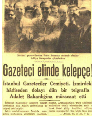
Resim 13. Basın davalarından bir haber (Cumhuriyet, 1947: 1-3).

1947 Aralık ayında basında Sıkıyönetim'in uzatılıp uzatılmayacağı konusu gündemdedir. Nadi, başyazısında şunları yazmıştır: “Sıkıyönetim kalktığı takdirde sorgusuz, sualsiz gazete kapatılmayacağına göre hükümete karşı şimdiye kadar yapılan hücumların şiddetleneyeğine ve sayın baştakilerin bir hayli sıkıntı çekeceklerine şüphe yoktur. Ne yapalım hürriyet rejimine hasret çektiğimize göre bu kadarcık fedakarlığa katlanmak lazımdır.” (Cumhuriyet, 1947: 1).