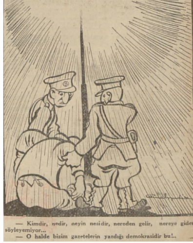
Resim 6. Cumhuriyet gazetesinde demokrasi tartışmaları ile ilgili bir karikatür (1945: 1).

1945 ile birlikte hükümet, demokrasi rejimi hedefi ve demokratik gelişme vaadi ile hareket etmeye başlamıştır. İktidarın demokratikleşme çabasının ilk görünümülerinden biri, basına karşı müsamahalı bir yaklaşım içine girmiş olmasıdır. Ancak 1931'den itibaren uzun bir sessizlik dönemine giren basında bu tavır değişikliğine karşı güvensizlik ve genel bir tedirginlik hali söz konusudur. Bu durumun 1947'ye kadar devam ettiği Nadir Nadi'nin bir yazısında şu ifadelerle yer almıştır: “Bugün ulu orta tenkitler savuran bir adama halâ bir nevi kahraman gibi bakılıyor. Çünkü yarın bu adamın bir bahane ile zindana tıklılmayacağından orada inim inim inilemeyeceğinden kimse emin değildir” ( Cumhuriyet , 1947: 3).