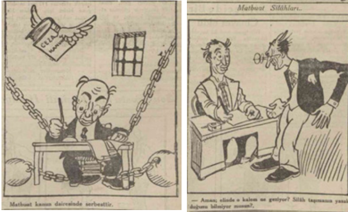
Resim 1. Son Posta gazetesinde basın özgürlüğüne ilişkin karikatürler (1930: 1).

Bu dönemde henüz Matbuat Kanunu yürürlüğe girmediğinden bazı gazeteler Ceza Kanunu hükümlerince soruşturma geçirmiş ve kapatılmıştır. Basın özgürlüğü tartışmaları bu cezalar nedeniyle gündeme gelmiş, eleştiri içeren yazı ve karikatürler basında yer almıştır.