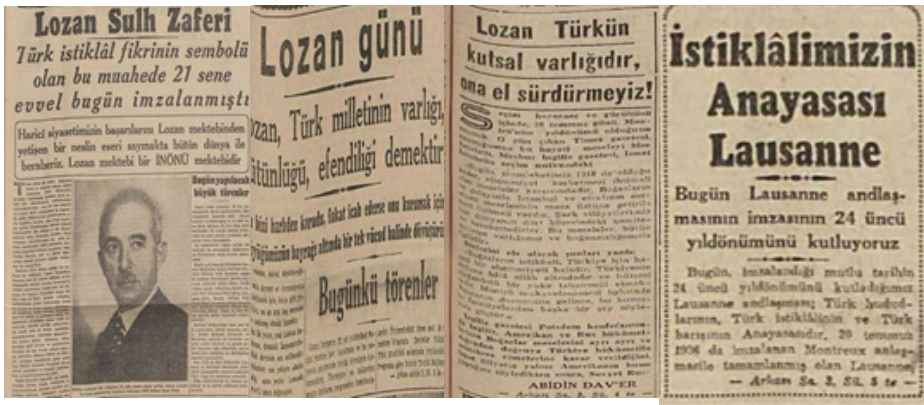
Resim 9. 24 Temmuz 1944, 1945, 1946 ve 1947'de Lozan Antlaşması haberleri (Cumhuriyet: 1).

Lozan Antlaşması'nın yıldönümü haberleri de Cumhuriyet gazetesindeki değişimi gösterir niteliktedir. Haberlerde İsmet İnönü vurgusunun giderek azaldığı görülmektedir. 1944'te İnönü'nün fotoğrafıyla manşetten yayımlanan Lozan Antlaşması'nın yıldönümü haberi, 1945'te Türk milleti vurgusuy- la, 1946'da başyazının içinde, 1947'de küçük bir haber olarak yer almıştır.