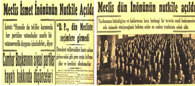
Resim 12. 1946 ve 1947'de İsmet İnönü'nün Meclis açılış konuşması haberleri (Cumhuriyet: 1).

1944 ve 1945'te Cumhuriyet gazetesinde, hükümetin resmi yayın organı konumundaki Ulus gazetesinde yayımlanan bazı yazı ve haberler aynen yer almaktadır. Bu uygulama da, 1946'da sona ermiştir. 1946 itibarıyla başyazılarda tek parti dönemi ve bu dönemdeki yanlış uygulama ve kararlar dile getirilmeye, hükümetin faaliyetleri eleştirilmeye başlanmıştır.