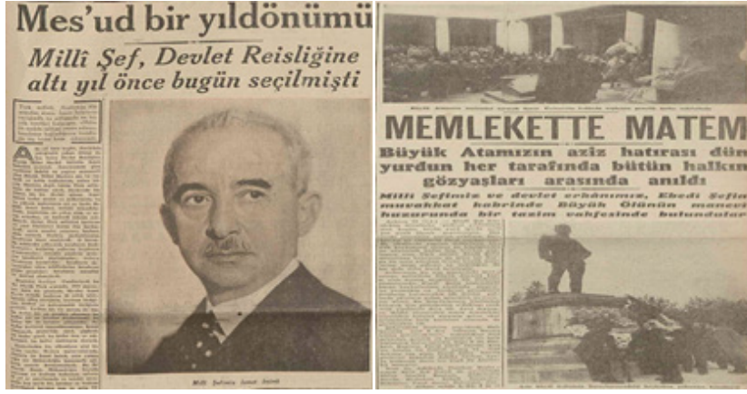
Resim 10. 11 Kasım 1944 ve 1945'te yayımlanan haberler (Cumhuriyet: 1).

1945 sonrası Cumhuriyet gazetesinde tespit edilen ilgi çekici bir değişim de 11 Kasım haberleridir. 1943 ve 1944'te 11 Kasım, İnönü'nün Cumhurbaşkanlığı'nın yıldönümü olarak bir kutlama haberiyle yer almış, 1945 sonrasında ise "matem" ifadesi kullanılarak Atatürk'ün ölüm yıldönümü anılmıştır.