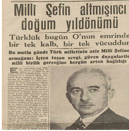
Resim 8. 1944'te yayımlanan doğum günü haberi (Cumhuriyet: 1).

başlanmıştır. Örneğin İsmet İnönü'nün 1944'te manşetten yayımlanan doğum günü haberine sonraki yıllarda rastlanmamıştır.