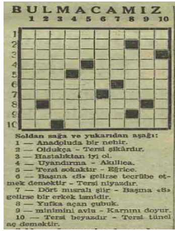
Resim 5. Matbuat Umum Müdürlüğü tarafından gamalı haça benzetilen bulmaca (Akşam, 1941: 6).5

17.12.1941 tarihli Akşam gazetesinin dördüncü sayfasında intişar eden bulmacanın dolu kareleri gamalı haçı göstermektedir. Bunun tesadüfen bu tarzda vücuda gelmesi mümkün olsa bile birçok okuyucular tarafından muhtelif tarzda mütalaa ve telakki edilmesi tabiidir. Okuyucular tarafından yanlış telakkilere meydan verecek şekil ve yazıdan çekinilmesini tavsiye ederim (Otmanbölük, 1986: 222).