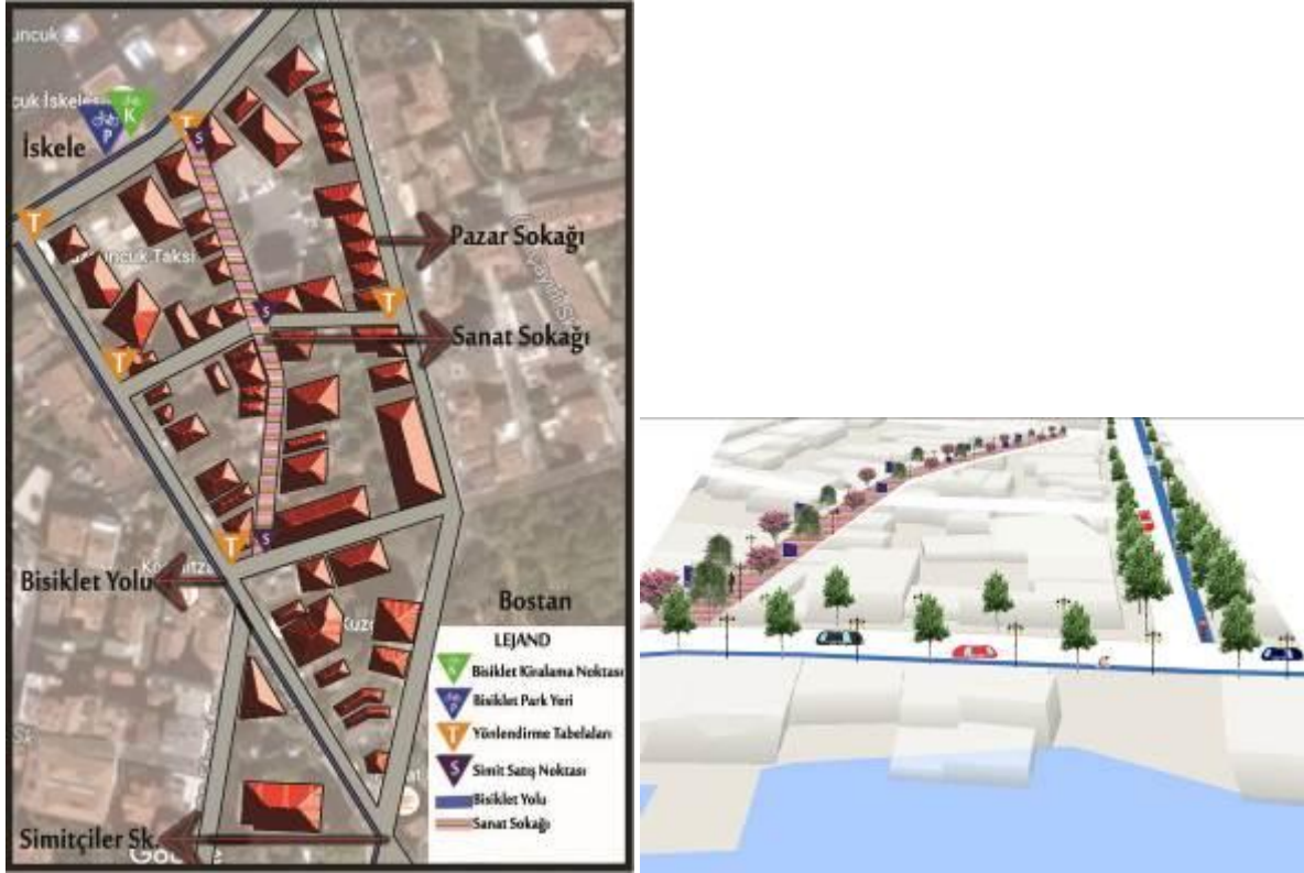
Şekil 3. Çalışma alanı peyzaj tasarımı

Alan kullanım be tasarım önerileri "tarihe yolculuk" konseptinden yola çıkmıştır. Önerilerle alanı yeniden değerlendirerek tekrar yaşatmayı, kullanımların artmasıyla alanın önemine yeniden kavuşması beklenmektedir.