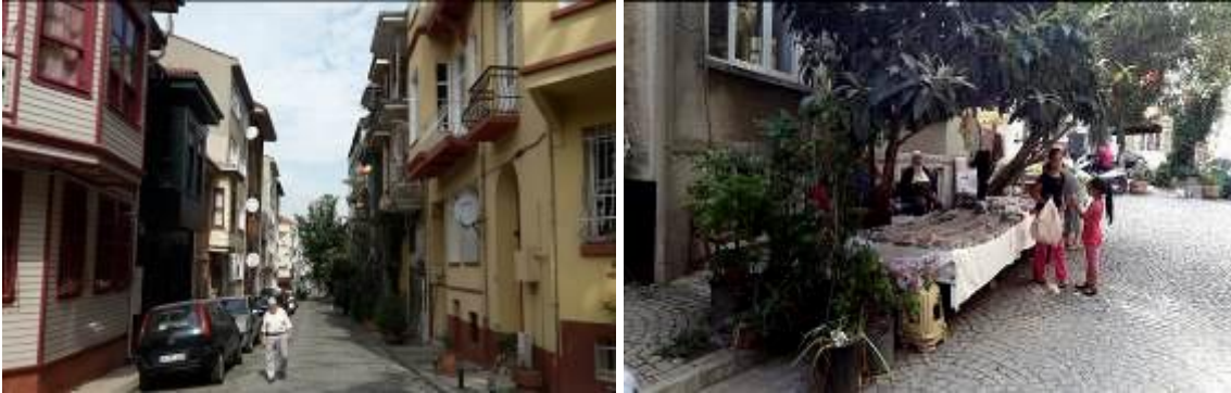
Şekil 1. Alandan görünüm

Yollar çok dar ve organik bir yapıya sahip olduğu için kaldırım ve yol ağaçlandırması yoktur. Tarihi dokudaki açık ve yeşil alanlar yeterli değildir. Alanda yolların kesiştiği noktalardaki küçük meydanlar, kamu alanları ve konut bahçeleri açık yeşil alanları oluşturur. Kentte otopark sorunu yaşanmakta, yol kenarına park eden araçlar görüntü kirliliği ve trafikte aksamalara neden olmaktadır.