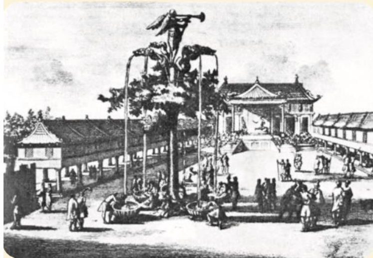
Şekil 11: Harhorin şehri Gümüş Ağaç 33 (10.sınıf ders kitabı 2019: 49)

Cengiz Han sonrasında Moğol imparatorluğu bölümünde Ögedey Han'ın reform politikası ve fetihlerinden bahsedilmiştir. Ögedey Han'ın ülke genelinde Büyük Yasa uyguladığı belirtilerek Harhorin'in inşasının yoğunlaşarak imparatorluğun başkenti olduğu bilgileri aktarılmıştır. Göyük Han döneminin anlatıldığı kısımda dikkat çeken nokta ise 1246'da düzenlenen kurultayda Ögedey Han'ın en büyük oğlu Göyük han ilan edildiğinde 4 000'den fazla yabancı büyükelçinin burada bulunmasının Moğol İmparatorluğu'nun prestijinin ve gücünün bir kanıtı olarak belirtildiği kısımdır. Bu bölümde 1246 yılında Göyük Han'ın Papa 4. Innocent'e gönderdiği mektuptan örneğe de yer verilmiştir. Mengü Han döneminden ise Mengü Han'ın bir sosyal, politik, ekonomik ve kültürel reform politikası başlattığı ve Harhorin şehrini dünya başkenti yapmak için yeni bir bina inşa ettiği ifade edilmiştir. Kubilay Han döneminin anlatıldığı kısımda ise 1260 yılında han ilan edildiği yer almıştır. Arık Böke ile Kubilay arasında 1260-61 yıllarında mücadele yaşandığı ve 1264 yılında mücadeleyi Kubilay'ın kazandığı bilgileri de bulunmaktadır.