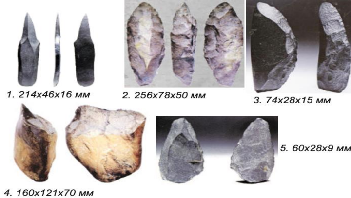
Şekil 8: Moğolistan'da Paleolitik Dönemde Bulunan Taş Aletler 29 (10.sınıf ders kitabı 2018: 9)

10. sınıf tarih ders kitabı ele alındığında yine 4 bölümden oluştuğu görülmektedir. Kitabın başlangıç bölümlerinde Moğolların atalarının tarihi (800 bin yıl öncesinden MÖ 4. yüzyıla kadar) , Moğolistan eski ulusları (4-12. yüzyıllar) , Moğol İmparatorluğu (12-15. yüzyıllar) ve Moğol İmparatorluğu sonrasında Moğolistan (14-17. yüzyıllar) konuları üzerinde durulmuştur.