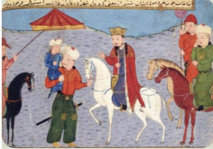
Şekil 12: Cami'üt Tevarih eserinden bir resim 34 (10.sınıf ders kitabı 2019: 54)

çoğunluğu Türkçe konuşuyordu bilgileri yer almıştır. 1350'de Moğol soyundan ancak Türkçe konuşan ve Türk kültürlü Barlas eyaletinin başı olan Timur, Semerkant'ın şehir merkez bölümünü birleştirerek tarihte Timur İmparatorluğu olarak bilinen Çağatay Ulusunun anakarasına ek olarak İran, Afganistan, Küçük Asya ve Irak'ı birleştiren imparatorluk haline geldiği bilgisi yer almıştır. İlhanlılar kısmında günümüz İran, Irak, Azerbaycan, Ermenistan, Gürcistan, Türkiye, Batı Afganistan ve Kuzey Suriye'yi içerdiği işlenmiştir. Ayrıca nüfusun çoğunluğunun Müslüman olduğu ve Persler, Araplar, Türkler, Haçlılar, Ermeniler ve Gürcüler gibi etnik grupların var olduğu belirtilmiştir. Gazan Han dönemindeki reformlardan bahsedilmiştir.