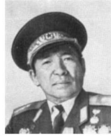
Монгол улсын баатар Лодонгийн Дандар (1914-1986)