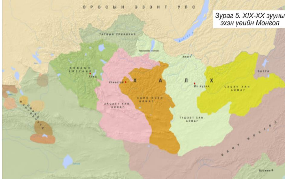
Şekil 14: 19-20. yüzyıl Başlarında Moğolistan Haritası (11.sınıf ders kitabı 2019: 18)

İkinci ünite de Moğol Rönesans'ı üzerine konular işlenmiştir ve altı kısımdan oluşmaktadır. Birinci kısımda 1911 devriminden bahsedilmiştir. Sekizinci Bogd Cavzandamba liderliğinde Moğol soylularının Mançulara karşı mücadelesinden bahsedilmiştir. İkinci kısımda Moğolistan'ın ekonomik kalkınması ve sanayi konularına değinilirken Ruslardan alınan yardımlar belirtilmiştir. Üçüncü kısımda Moğolistan'ın bağımsızlığının diğer ülkeler tarafından kabul edilmesine yönelik bilgiler verilmiştir. 3 Kasım 1912 tarihinde Ruslarla yapılan anlaşmaya değinilerek Dış Moğolistan'ın özerk olmasına yönelik maddeler aktarılmıştır. Rusya'da gerçekleşen Ekim Devrimi ile birlikte Çin tarafının üçlü antlaşmayı bozduğu işlenmiştir. 37