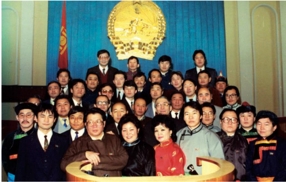
Şekil 7: Devlet Meclis üyeleri (9.sınıf ders kitabı 2019: 143)

Kitabın son bölümünde Demokratik Moğolistan ve Günümüz Dünya Tarihi başlığı altında Sosyalist sistemin çöküşü, demokratik devrimin başlangıcı, demokratik seçim ve yeni anayasa, Moğolistan'ın ekonomi ve toplum hayatının değişimi ile dış politikası hakkındaki konular işlenmiştir. Sosyalizm'in çöküşü konusunda Doğu Avrupa'daki sosyalist yapının çökmesi aktarılırken Berlin Duvarı'nın yıkılışıyla iki Almanya'nın birleşmesi konusuna değinilmiştir. 1988-1989 yıllarında Moğol gençler arasında Yeni Dönem , Kainat gibi demokrasiyi destekleyen gizli kulüpler kurulduğu yazılmıştır. 27