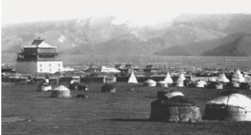
Şekil 3: 1911 yılı Başkent Ulaanbaatar (9.sınıf ders kitabı 2019: 25)

Bölümün devamında Bogd Han'ın Moğolistan dış ilişkilerindeki politikası anlatılmıştır. Bu politikaya göre 1912 yılının 11. ayında Rusya ile anlaşma yapılmıştır. Aynı yılda Fransa, Belçika, İngiltere, Japonya, Almanya, Amerika, Danimarka, Hollanda ve Rusya'ya yazı gönderildi. Moğolistan'ın bağımsızlığı bildirilmiş ve ikili ilişkilerin sağlaştırılması konusunda fikir beyan edilmiştir. 1912-1913 yılları arasında Tibet ile anlaşma yapılmıştır. Dışişleri Bakanı Handdorc liderliğindeki temsilciler Rusya'ya seyahat düzenleyerek askeri ve malî yardım istenmiştir. 1913 yılı başlarında İçişleri Bakanı Dalay Lama Tserençimed liderliğinde temsilciler Japonya'ya giderek bağımsızlığı kabul ettirmek ve İç Moğolistan ile Barga 22 'nin korunması istenmiştir. 1913-1914 yılları arasında Başbakan Namnansüren liderliğinde temsilciler Rusya'ya seyahat ederek Rusya ve Çin'in 1913 yılı deklarasyonunu reddedip İç Moğolistan ile birleşme desteğini almak istemişlerdi. 1915 yılında Çin-Rusya-Moğolistan arasında Khiagt Antlaşması yapılmıştır. 23