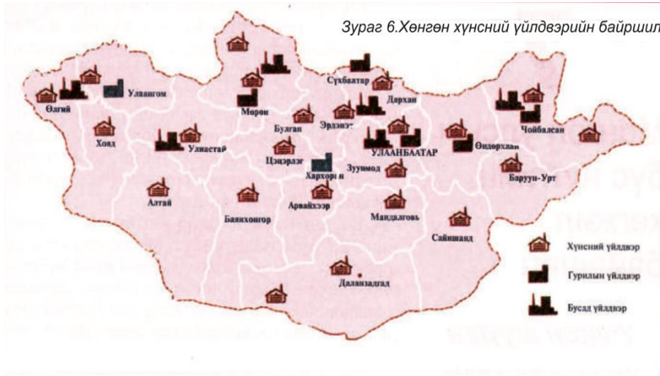
Şekil 15: Moğolistan'da Sosyalist dönemde kurulan fabrikalar (11. sınıf ders kitabı 2019: 51)

Yedinci bölümde Moğolistan Halk Cumhuriyeti'nde Sosyalizm'in etkisi aktarılmıştır. 1940'ta Moğolistan Devrimci Halk Partisi'nin 10. Büyük Toplantısı'nda Marksizm-Leninizm çizgisinin temel alındığı belirtilmiştir. Ayrıca 1940 yılında temel anayasanın kabul edildiği açıklanmıştır. 7 Kasım 1949 tarihinde Sovyet Rusya'nın desteğiyle demiryollarının açılışının yapıldığı aktarılmıştır. Stalin ve Moğolistan Devlet Başkanı Çoybalsan'ın ölümü sonrasında siyasette değişikliğe gidildiği aktarılmıştır. Kitabın devam eden kısımlarında Moğolistan'da sosyalist yapının oluşturulduğu, fabrikaların kurulduğu yer almıştır.