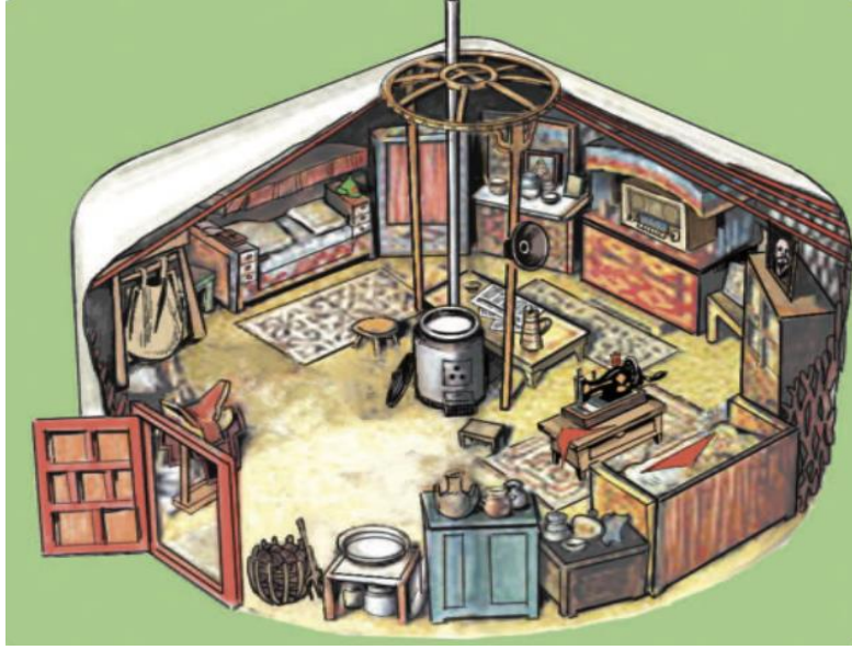
Şekil 5: 1950 yıllarında bir Moğol geri (Keçe ev) (9.sınıf ders kitabı 2019: 82)

Moğolistan Halk Cumhuriyeti'nin eğitim ve kültür politikasının anlatıldığı bölümlerde ise 1941 yılında Kiril alfabesine geçilmesi hakkındaki kuralın belirlendiği ifade edilmiştir. 1 Ocak 1946 tarihinden itibaren resmi yazışmaların Kiril harflerine göre yapılması kararı alındığından bahsedilmiştir. Kitabın devamında 1969 yılında nüfusun %82.4'ünün Kiril harfleriyle yazdığı belirtilmiştir. 1942 yılında Moğolistan Devlet Üniversitesi kurularak birçok yüksekokul ile birlikte çeşitli alanlarda eğitimi geliştirmeye çalıştığı aktarılmıştır. Ek olarak 3 Mart 1981 tarihinde uzaya gönderilen Moğolistan Halk Cumhuriyeti kozmonotu C. Güragaçaa hakkında bilgi verilmiştir. Moğolistan'da çıkarılan gazetelerin isimleri verildikten sonra 1950 yılında toplam 24 gazetenin yılda 25876,2 bin adet basıldığı aktarılmıştır. Aynı yıl Ts. Damdinsüren, Moğolistan Halk Cumhuriyeti ulusal marşını yazdığı ve bu marşın 1961 ile 1992 yıllarında yenilenerek günümüze geldiğinden bahsedilmiştir.