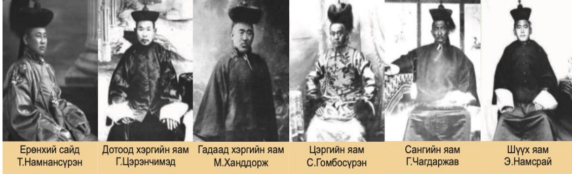
Şekil 2: Moğolistan Devlet Bakanları 21 (9.sınıf ders kitabı 2019: 18)

Bağımsız Moğolistan başlığı altında ulusal devrimi güçlendirme, Moğol boylarını birleştirme ve dünyadaki diğer imparatorlukların bağımsızlığı kabul etmesi için mücadele konuları anlatılmıştır. Moğolistan, Mançuların hâkimiyetinden çıkarak bağımsızlığını ilan etmesinden sonra Bogd Han Cavzandamba'nın hükümeti oluşturduğu bilgisi aktarılmıştır.