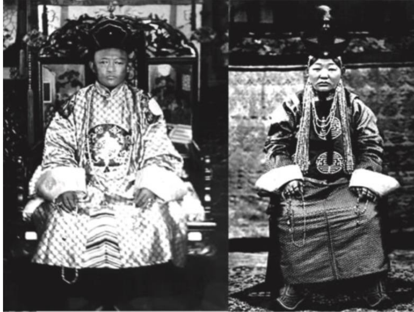
Şekil 1: Sekizinci Bogd Cavzandamba ve Devletin İmparatoriçe Dondogdulam 16 (9.sınıf ders kitabı 2019: 15)

9. sınıf tarih ders kitabına bakıldığında 4 bölümden oluşmaktadır. Genel olarak modern Moğolistan hakkında geniş bilgilere yer verilmiştir. Ayrıca Birinci Dünya Savaşı , İkinci Dünya Savaşı ve Soğuk Savaş konuları kitapta yer almıştır. Kitabın ilk bölümünde Modern Moğolistan tarihi nasıl çalışmalıdır? , Modern tarih ile ne çalışmalıdır? soruları üzerinde durulmuştur. İkinci bölümdeki Moğol Devleti'nin Rönesans'ı ve Dünya Tarihi (1911-1924) başlığı altında Mançu Devleti'nin Moğollar üzerindeki politikasının değişmesine yer verilmiştir. Özellikle Mançuların 19. yüzyılın sonlarında uyguladığı Yeni Hükümet Politikası üzerinde durulmuştur. Bu politikayla birlikte birçok Çinli vatandaşın Moğolistan'a yerleşme, tarım yapma ve Moğol kadınlarla evlenme hakkı olduğu belirtilmiştir. 15