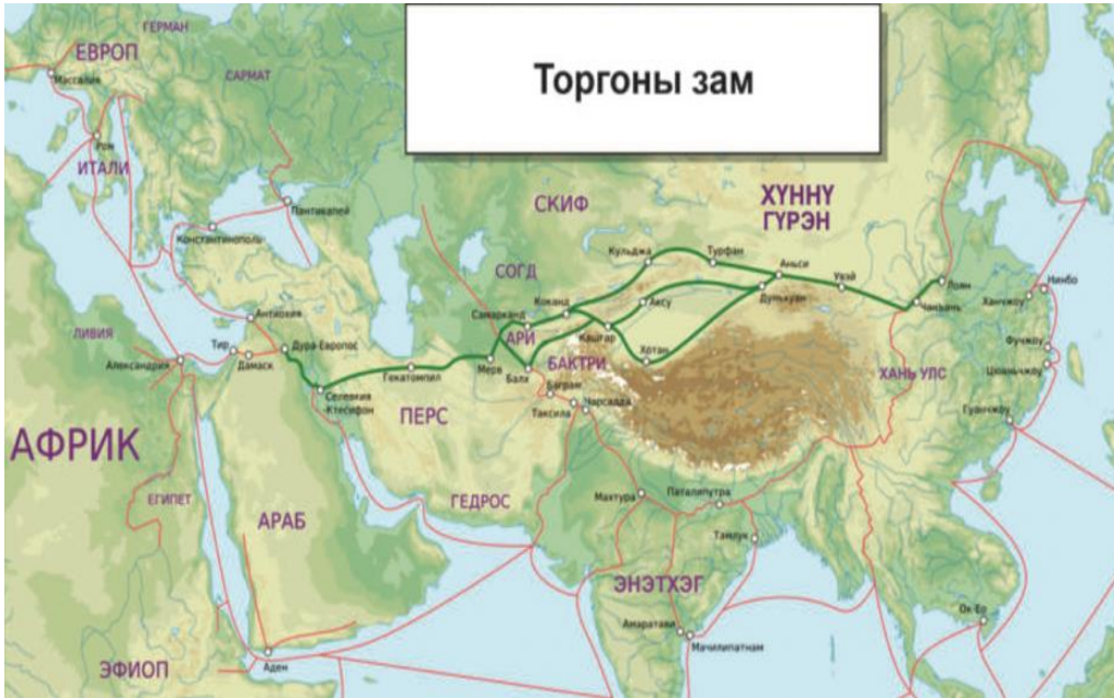
Şekil 10: İpek Yolu (10.sınıf ders kitabı 2019: 22)

İpek yolunun oluşumu kısmında Hunlar ve Han Ulusu arasında imzalanan Barış Anlaşması'nın MÖ 198'den MÖ 133'e kadar yaklaşık 60 yıldan fazla sürdüğü belirtilmiştir. Anlaşmaya göre Han Ulusunun Hunlara birçok hizmette bulunduğu ancak daha sonra Hunların gücünden korktuğu yazılmıştır. Han Ulusu MÖ 133'te anlaşmayı bozarak Hunlarla savaşmaya başladığı ve MÖ 129'dan MÖ 90 yılına kadar yaklaşık 40 yıl süren savaşlardan bahsedilmiştir. Han Ulusunda Wu-di'nin Hunlarla Batı arasındaki iletişimine engel olmasına Çinlilerin Hunların sağ kolunu kesme politikası adını verdikleri belirtilmiştir. Ayrıca Han Ulusu, Batı ticaret yolunun önemini anladıktan sonra bu yolu Hunlardan diplomatik yollarla ya da askeri güç yoluyla ele geçirmek için büyük çaba sarf ettiği işlenmiştir. Daha sonradan bu yola İpek Yolu adı verildiğinden bahsedilmiştir.