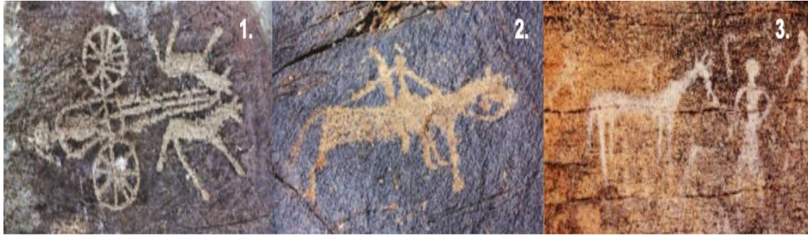
Şekil 9: Moğolistan'da Bronz ve Erken Demir Dönemde Bulunan Kaya Resimleri (10.sınıf ders kitabı 2019: 14)

Bronz ve Erken Demir Çağı'nda Moğolistan konularının işlendiği kısımda göçebe hayvancılığın başlangıcı hakkında bilgiler verilmiştir. Ayrıca kaya resimleri, erkek insan mezarının bulunduğu da görsellerle desteklenmiştir. Eski göçebe toplumu ve kültürün gelişmesi kısmında Moğolistan'da göçebe hayvancılığın geliştiği, insanların kendi aralarında fikir ayrılıkları olduğu yazılmıştır. Bu dönemdeki kaya resimlerine bakıldığında atlı ve yaya insanların ok ve yaylı şekillerinin görüldüğünden bahsedilmiştir. Ayrıca dörtgen mezarlar ve bunların 4x10 m taşlarla çevrildiği, belirtilmiştir. Moğolistan'da yaklaşık 1200 tane geyik heykelinin olduğu ve en yüksekinin 4 m olduğu bilgisi verilmektedir.