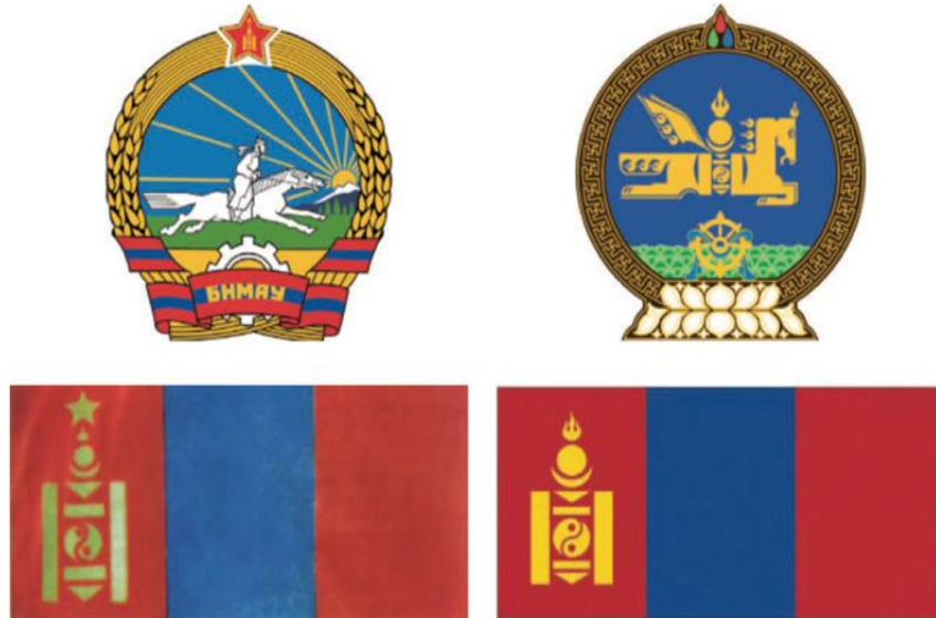
Şekil 4: 1960 ve 1992 yıllarındaki Moğolistan devlet sembolü ve bayrakları (9.sınıf ders kitabı 2019: 61)

Kitabın üçüncü bölümünde Sosyalizm döneminin Moğolistan'ı ve dünya tarihi ele alınmıştır. 1924-1990 yılları arasındaki gelişmeler ışığında Moğolistan üzerindeki Rusya ve Çin etkisi hakkında bilgiler yazılmıştır. Ek olarak Moğolistan'ın Cumhuriyet yönetimine geçişi, 25-26 Aralık 1924 tarihinde Ulusal Anayasa'nın kabulü hakkında bilgiler sunulmuştur. Anayasanın kabulü sonrasında Moğolistan isminin Moğolistan Halk Cumhuriyeti olarak değiştiği işlenmiştir. 1940 yılında ikinci anayasanın kabul edildiği ve 30 Haziran 1940 tarihinde Çoybalsan'ın Ulusal Anayasası olarak adlandırıldığı yazılmıştır. 1960 yılında kabul edilen anayasaya Moğolistan Halk Partisi, Marksist-Leninist görüş çerçevesinde hareket eder maddesi eklenmiştir.