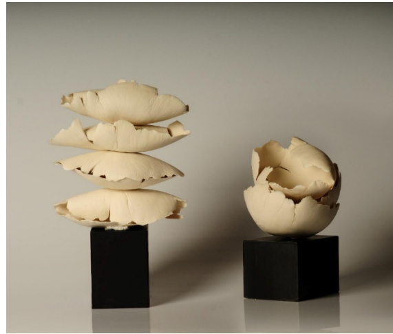
Şekil 2. C. Güngör, Babam ve Oğlum , 2008.

CG: Babam ve oğlum adlı çalışmam 2 (bkz. Şekil 2).