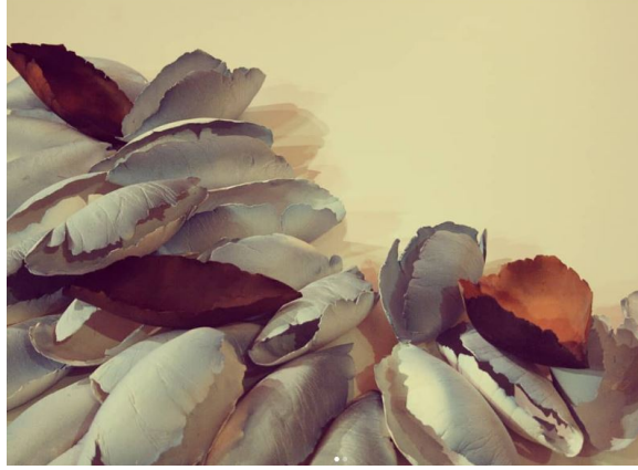
Şekil 1. C. Güngör, Kabuk Serisi , EGE Uluslararası İzmir Seramik Sempozyumu, 2001.

CG: Yurt dışında deneyim sahibi olmanın, uluslararası alana açılmanın ve dünya sanatçılarıyla birlikte çalışmanın, sanatçıyı teknik ve kişisel açıdan besleyen bir olgu olduğu kanaatindeyim. Aynı alanda çalışmalar üretiyorsunuz ve farklı bakış açılarıyla karşılaşıyorsunuz. Farklı teknikler, farklı kültürler sanatınızı geliştiriyor. En önemlisi de kendi kendinize kaldığımız, bir parça da olsa kendi hayatınızdaki sorunlardan uzaklaştığınız, duygularınızın yoğunlaştığı, konsantrasyonunuzu sağladığınız bir zaman diliminiz oluyor. Düşünceleriniz soyut kavramlardan somut gerçeğe dönüşüyor. Kısacası, bir sanatçı olarak kendinizi yenilediğiniz verimli anlar bunlar. Örneğin, Makedonya'da yapılan Resen Seramik Koloni'sine katıldığım yıl (2000 yılı), o bölgenin coğrafyasından etkilendiğim yeni bir seri üretmeye başladım. Yine 2001 yılında İzmir Uluslararası Seramik Sempozyumu'na katıldığım yıl deniz kenarında izlediğim deniz manzarasını 'Ege' adıyla seramik malzemeyle betimledim. 'Kabuk' serim böyle doğdu (bkz. Şekil 1).