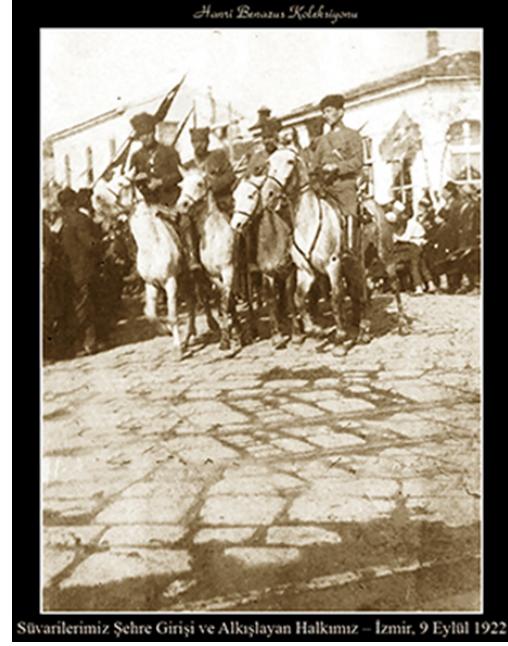
Şekil 3. Türk Ordusunun İzmir'e Girişi, (H. Benazus kişisel arşivi, 1922).