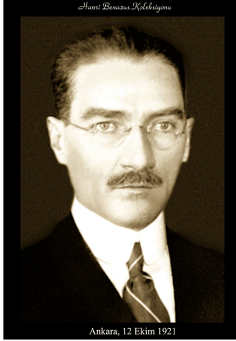
Şekil 5. Atatürk, Ankara (H. Benazus kişisel arşivi, 1921) 2 .

beni dolandırmak istediği. O günlerde işimin gereği New York'ta bulunan temsilcimi aradım ve kendisine aynen bu adamın beni dolandırmak istediğini, Atatürk Fotoğraflarının olsa olsa Türkiye'den götürüldüğü düşüncesinde olduğumu ancak yine içime bir kurt düştüğünü, gidip kendisi ile görüşerek durumu anlamasını istedim. Birkaç saat sonra temsilcim fotoğrafçı ile görüştüğünü, fotoğrafların gerçek olduğunu, negatiflerinin de elinde bulunduğu, bu fotoğrafların 1921 yılı Ekim ayında Amerika'dan Türkiye'ye gelip Atatürk'le röportaj yapan gazeteci babasından kaldığını belirtti. Heyecanlandım. Fotoğrafçıyı aradım. İstedığı bedeli sordum. Halim vaktim yerinde bir dönemden geçiyordum. Para beni o gün için etkilemedi. Parayı alıp ertesi sabah Zürih üzerinden New York Havaalanı'na indim. Bir taksiye atlayarak, 42. Caddedeki dükkanına gittim, parasını verip tekrar taksiye atlayarak havaalanına dönüp Türkiye'ye dönüş yaptım. Herhalde gününbirlik Amerika'ya gidip dönen bir ben varımdır diye düşünüyorum.