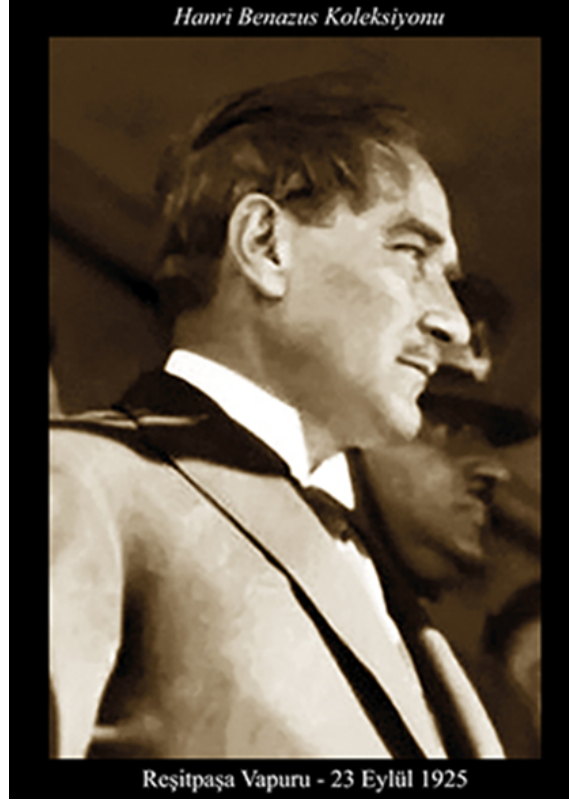
Şekil 1. Reşitpaşa Vapuru, H. Benazus, H. Benazus Koleksiyonu,1925.