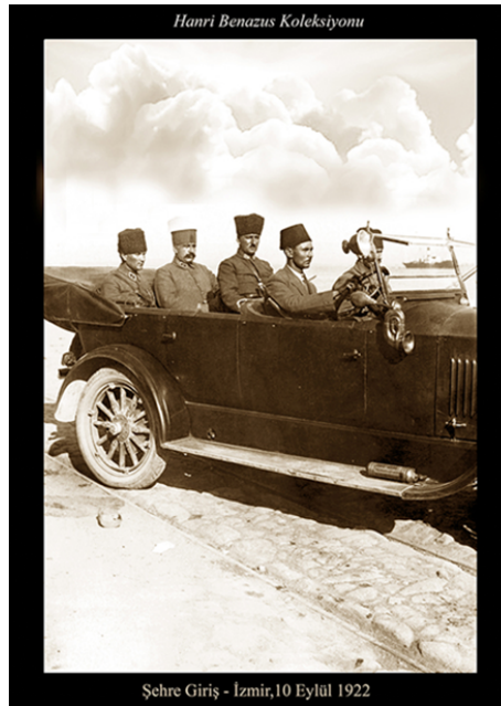
Şekil 4. Atatürk ve Silah Arkadaşları İzmir'e Girişi, (H. Benazus kişisel arşivi, 1922) 1 .

ST: Fotoğraf Koleksiyonunun oluşması sürecinde unutmadığınız bir anınızı paylaşmak ister misiniz?