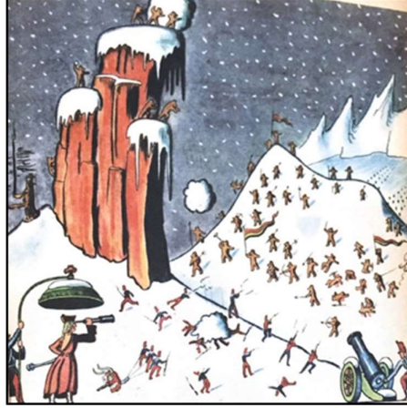
Görsel 2 3

Grandükün bu saldırısı yaban hayatta büyük bir katliam yaratmış olsa da aylar, soğuktan ve yaşadıkları yıpratıcı açlıktan dolayı hedefledikleri gibi insanların yaşam alanlarının bulunduğu vadiye inerek Grandük'ün ordusuyla savaşa girerler. Buzzati'nin bu sahneyi aynı zamanda resimle canlandırmış olması anlatının geçtiği mekânı tasvir ediyor olması açısından önemlidir: