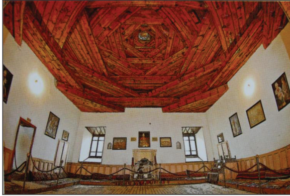
Fotoğraf 6: Hacı Bektaş Veli Meydan Evi kılıngıç örtü (Ülger, 2013: 74).