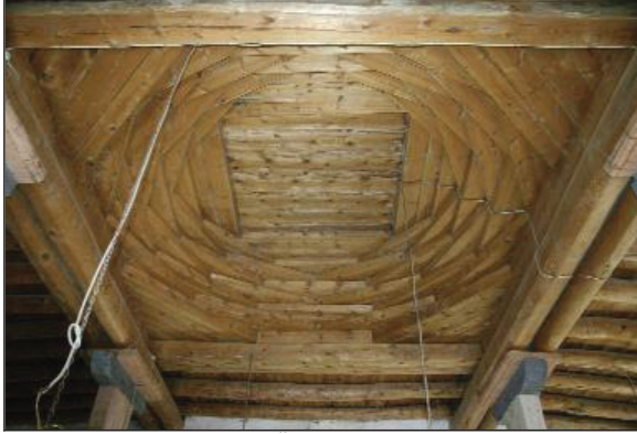
Fotoğraf 3: Gümüşhane Özbeyli Köyü Camii kırklangıç örtü (Özkan, 2010: 80).