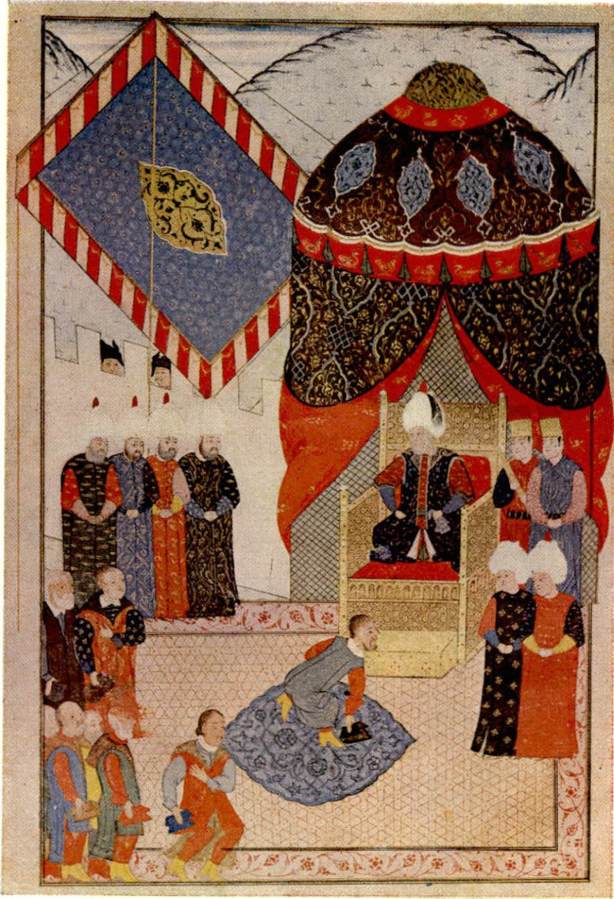
Kanunî Sultan Süleyman'ın Sigetvar seferine giderken Erdel beyi'ni kabulü, Bak. Feridûn Ahmed, Nüzhetu'l-Ahbar der Sefer-i Sigetvar , v. 16 b, TSMK, Hazine 1339.