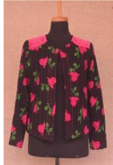
Foto. 48. Tasarım ceket 108