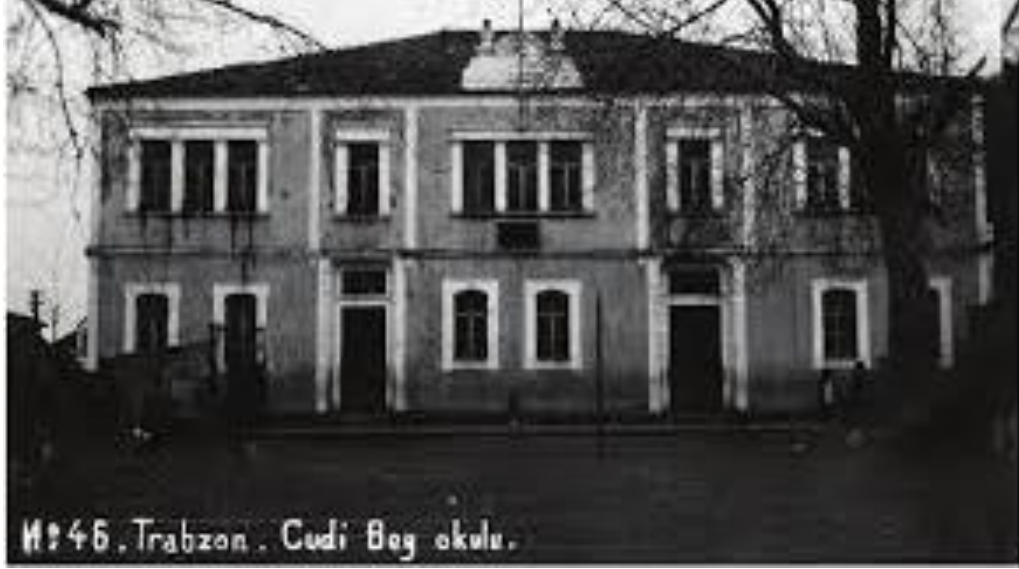
Foto. 13. Şadıman ve Müjgan Sürel'in ilköğrenim yaptığı tarihi Cudibey İlkokulu 65

baskısı, ütü yapmış ve sonuçta uzun yıllar Trabzon kadınına giydirmiş terzilerden birisi olmuştur. 64 Terzilik mesleğini bıraktıktan sonra da birlikte yaşamaya devam eden üç kız kardeş 2017 yılında önce Müjgan Sürel'i, 2022 yılında da Şadıman Sürel'i kaybetmiştir.