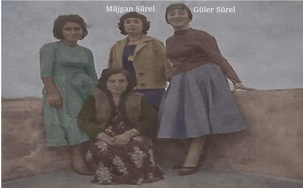
Foto. 40. Terzi kızlar ve arkadaşları 100