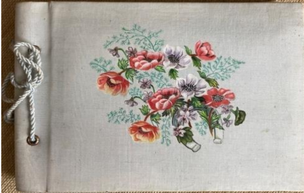
Foto. 44. Terzi Kızların fotoğraf albümü 104