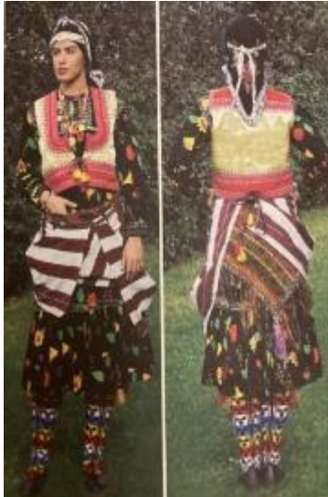
Foto. 46. Trabzon yöresi geleneksel kadın giysisi 106