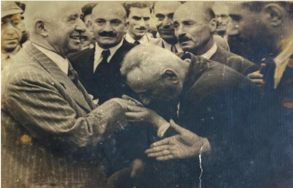
Foto. 6. Türkiye Cumhuriyeti'nin ikinci Cumhurbaşkanı İsmet İnönü Trabzon'da 31

İsmet İnönü'nün elini öpen kişi terzi kızların babası İbrahim Efendidir. Bu ziyarette İbrahim Efendi İsmet İnönü'ye “paşam halk bu iki partili seviyeye gelmedi, neden acele ediyorsunuz” demiş. İsmet Paşa cevap olarak “ben ölmeden göreyim” diye cevap vermiştir. 32