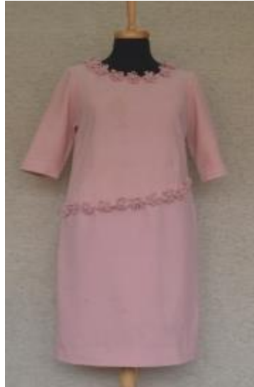
Foto. 47. Kadın terzinin diktiği modern giysi 107