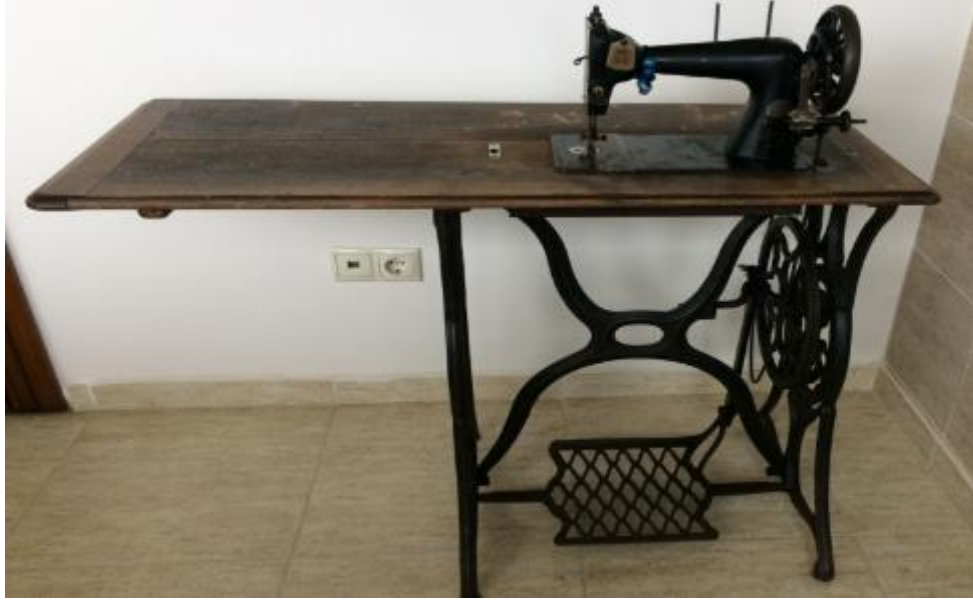
Foto. 30. Terzi Kızların babaannesi Asiye Hanımın dikiş diktiği kara makine 90

Makine, Halil Ağanın eşi Asiye Hanım tarafından Merzifon'dan muhacirlikten döndükten sonra Trabzon'da alınmış, ev halkının giysi ihtiyacı dikilmiştir. En az 100 yıllık olan ayaklı dikiş makinesi terzi kızlar dikiş dikmeye başladıkları yıllarda da kullanılmış, terzi kızlar uzun yıllar bu makinede dikiş dikmiş, daha sonra sandıklı, elektrikli SINGER marka dikiş makinesi alınmış, siparişler artık o makinede dikilmeye başlanmıştır.