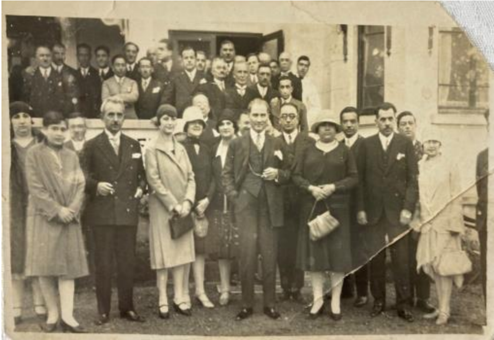
Foto. 5. Türkiye Cumhuriyeti'nin kurucusu ulu önder Mustafa Kemal Atatürk'ün 1937 Yılında Trabzon'a üçüncü ziyareti. Arkada sol baştaki kişi İbrahim Efendi 30