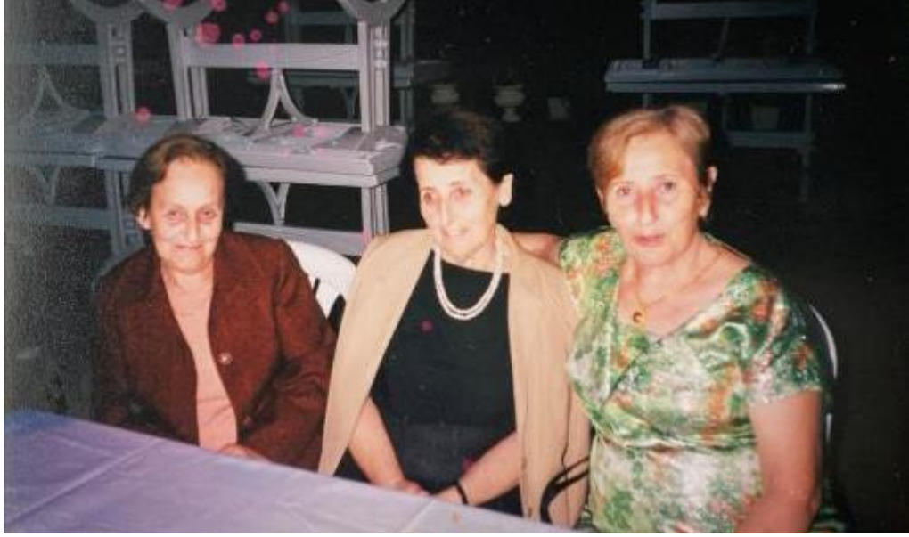
Foto. 43. 1970'li yılların sonu, Terzi Kızlar 103