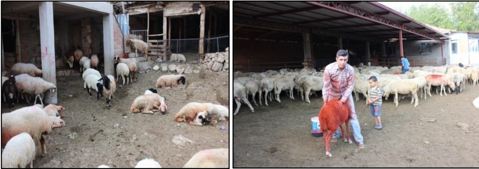
Fotoğraf 1. Hasanpaşa köyündeki farklı hayvan barınaklarından görünüm

K.K.1 ve ailesi köyde yaşayan birçok aile gibi kış aylarını kendi evlerinde geçirmektedir. Yarım asrı aşkın bir süredir koyun yetiştiriciliği yapan K.K.1 Hasanpaşa köyü haricinde herhangi bir kışlak kullanmamış ve göç etmemiştir. Kışlak olarak kullanılan mesken tipi ise köy evi ve eklentilerinden oluşmaktadır. Burada aynı avlu içerisinde ev, ahır samanlık ve depo gibi eklentiler bulunmaktadır (F:1).