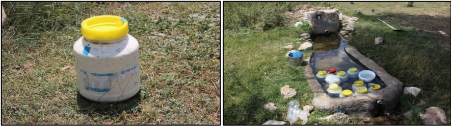
Fotoğraf 4. Yaylada peynir üretimi ve üretilen peynirlerin muhafazası

Yayla ekonomik olarak da büyük bir önem arz etmektedir. Bu dönemde süt sağımı yapılmaktadır. Sağılan süt, miktarına göre aynı gün veya birkaç gün biriktirilerek işlenmektedir. Bu kapsamda tereyağı, yoğurt ve peynir üretilmektedir. Tereyağı ve yoğurt ailenin ihtiyacı kadar üretilirken, peynir daha fazla üretilmektedir. Üretilen peynirler suyundan arındırılarak tuzlanmakta ve içine maya kekiği/kaya kekiği ( Saturejacuneifolia ) serpiştirilerek plastik bidonlara basılmaktadır (F:4). Bu bidonlar yaylada konaklanan süre boyunca sütlükler ile çeşmelerin hatıllarında muhafaza edilmekte olup, yayladan köye dönüşte satılmaktadır. Yine son yıllarda Kurban Bayramlarının yaz aylarına denk gelmesi ile birlikte yaylada kurbanlık koyun ve kuzu satışları da gerçekleştirilmektedir.