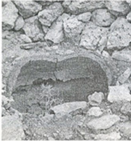
Fotoğraf 6. Midyat Yezidi Oyuklu(Taka) köyünde ocağı sönen bir ailenin tandırı. (Graf: K. Sami; 2008)