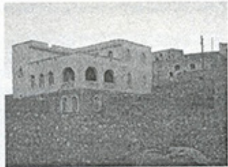
Fotoğraf 9. Yurtdışında kalan bir Yezidi ailesinin yaptığı yeni konut. (Graf: K. Sami; 2008)

Yezidi sözlü kültür geleneği sadece büyük bir çeşitlilik göstermekle kalmayıp, aynı zamanda duygusal bir tınısı hayli fazla olan folklorik alanın bir parçasını da oluşturmaktadır. Yezidiler; Mezopotamya bölgesel kültürel sürecinin bir parçası olmakla beraber; kendilerine özgü birtakım kaygıları özlerinde hep taşımışlardır (Allison, 2007, s.9-10). Gelenekselliklerini yüzyıllar boyu gerçeğine yakın bir şekilde koruyabilmiş bu halk; 1980'lerden sonra toplumsal yaşamı idame eden geleneksel kabullerin erozyona uğradığı dönemler olarak bilinmektedir (Çetin, 2005, s.74). Yezidiler; yerleşmek amacıyla bir yeri seçerken birçok etmeni bir arada düşünmek zorunda kalmışlardır. Ekonomi, doğal çevre, sosyal yapı, aşiret, din ve dil gibi etmenler temel belirleyiciler olarak alınmıştır. Ovalarda yer alan yerleşmeler; orta yükseklikte dört duvar ile çevrilmiş evlerin düzensiz olarak bir arada kümelenmesiyle dikkat çekmektedir. Ancak çevre baskısından ürken Yezidiler; çok eski zamanlardan beri homojen olarak bir arada olmalarını sağlayan köy yerleşimlerini tercih etmişlerdir.