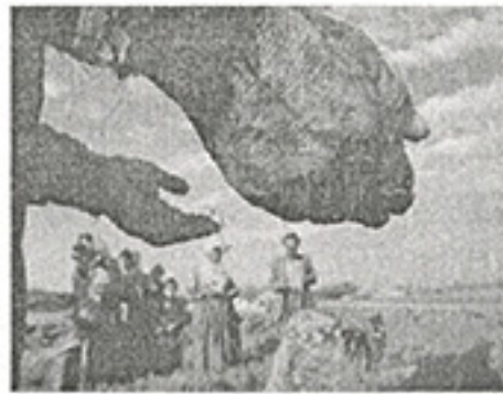
Fotoğraf-2. Beşiri-Hamduna(Kurukavak) köyünde akşam duasını yapan bir grup Yezidi. Viranşehir-Burç köyünde bir mezarın başında dua eden Yezidiler.

Mezopotamya uygarlığının yarattığı çoğulcu kültür deseni içerisinde; Yezidiler farklı bir inancın ve kültürün aidiyetini taşımaktadırlar (1-2). Bu halkın farklı olan dini inancı; tarihin her döneminde araştırmacıların odak noktası olmasına karşın, kırsal yerleşim örüntülerinin sahip olduğu geleneksel yapıyı oluşturan düşüncenin kabul değerleri yeterince ilgi çekememiştir. İçeride kapalı toplumsal ritüellerin yarattığı gizem; bu halkın çoğulcu toplumsal yapı içinde kimlik bulan maddi kültür örüntülerinin algılanılmasını arka plana atmıştır. Yezidi halkına atfedilen "ateşperest" / "şeytanperest" gibi kaba inanç vurgusunun aksine; bu halk kötülük kudretine sahip olan şeytandan korkar ve korkularını saygı duyarak ifade ederler. Yezidi teolojisinin kuramsal bağlamı içinde ateş salt bir "nur" yani ışık saçan bir kaynak olması sebebiyle, ona kutsallık atfedilmektedir.