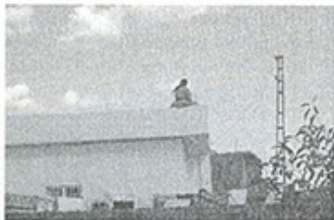
Fotoğraf 12. Yeni evlerinin damında vadinin derinliklerine bakan bir Yezidi kadını (Almanya'dan yaz mevsimi için gelen aile). (Fotoğraf: K. Sami; 2008)

olan lentoyla geçilmiştir. Bu da kırsal köy yerleşmelerinin çok eski tarihlere dayandığını göstermektedir. Yapı tekniğine ve geleneklerine duyulan bağlılıktan dolayı Yezidiler son yıllarda yapılan konutların yapım tekniğinde bir değişikliğe gitmemişlerdir.