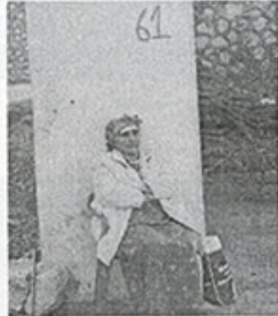
Fotoğraf 11. Almanya'da yaşayan ve yazları Kefnas'a gelen kanser hastası Yezidi bir kadın.

Evlerin tavanları basık tonozlarla geçilmiştir. Mardin'in ilk dönem evlerinde olduğu gibi Yezidi evlerindeki kapı ve pencerelerin açıklıkları kemerle değil, tek taş