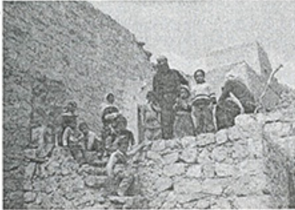
Fotoğraf 3. Boşalan Yezidi Midyat- Yenice (Harabya) köyüne yerleşen iki eşli bir göçer ailesi.

İçe dönük kabuller örgüsü etrafında toplumsal erkini oluşturan Yezidiler; dış çevreyle olan bağlarında kapalı bir karaktere sahiptirler. Kendilerinden olmayanlara/yabancılara karşı hep uzak durmayı benimseyen bir düşünce yapısı içinde kırsal yaşam özelliklerini günümüze kadar taşıyabilmişlerdir. Kendi düşünce potansiyellerini dışı kapatan bu kadim halk; kendileri hakkında dile getirilen yanlış bilgileri de beraberinde getirmiştir(Tori, 2000, s.61-62). Farklı olmanın beraberinde getirdiği etnisite kavramı; "ait oldukları ve içinde özgün kültürel davranışlar sergiledikleri bir toplumda kendilerini diğer kolektif yapılardan farklılaştıran ortak özelliklere sahip olduğunu düşünen ya da başkaları tarafından bu gözle bakılan kişiler"(Marshall, 1999, s.215) tanımlayan bir terimdir. Yezidiler; tarihin her döneminde kırsal yerleşim alanlarıyla birlikte özgün kültürel niteliklerini koruyan bir halk olarak, tüm baskı ve şiddete rağmen; Müslüman topluluğun bir parçası olmayı hep ret etmişlerdir. Bu kadim halk kendi teolojik değerlerini ve kültürel belleklerini korumak için büyük mücadeleler vermiştir. Tarihin farklı dönemlerinde, bu halk dini inançlarından dolayı; yıkımlara, savaşımlara ve ayrımcılığa hep maruz kalmıştır. Uygarlıkların tarihsel oluşumu içinde hep var olabilmiş Yezidiler; kendi benliklerinde taşıdığı gizem ve Yezidiliğin anlamı üzerine yapılan tartışmalar ve çalışmalar hâlâ devam etmektedir (Angosi, 2005).