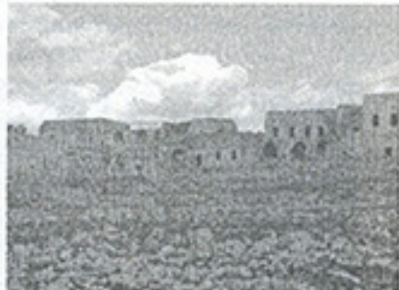
Fotoğraf 13. Bacın köyünden genel bir görünüm. (Fotoğraf: K. Sami; 2008)