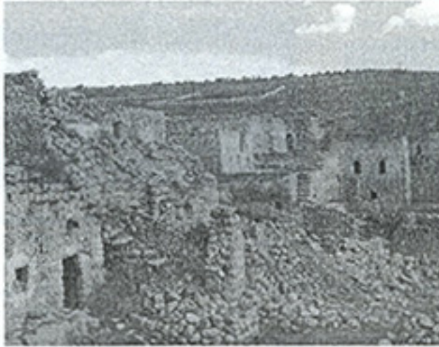
Fotoğraf 7. Midyat Yezidi Güvenli köyünde harap olan kırsal konut dokusu. (Graf: K. Sami; 2008)

düştürmüşür(İşler, 1990, s.36). Yezidi göçü 1980'lerden başlayıp 1990'ların ortalarına kadar süren dönem önemli bir olguyu ifade etmektedir. İçinde bulunduğumuz zaman dilimi içinde bu köylerin tümü boşaltılmış olup, var olan konut dokularıyla kaderlerine terk edilmiş bir durumdadır. Midyat Yezidi köylerinde yaşanan göçün büyük bir bölümü Almanya, Belçika, Hollanda ve Fransa'ya olmaktadır. İç göç ise daha çok İstanbul ve İzmir'e yapılmaktadır.