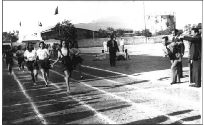
Resim 6. İzmir Alsancak Stadında Yapılan Atletizm Bayramına Ait Görüntüler-4

Bornova Halkevi, spor şubesinin faaliyetlerini sürdürebilmesi için CHP Genel Sekreterliği'nden çeşitli malzemeler talep etmiştir. 29 Nisan 1946 tarihini taşıyan dilekçede şu malzemeler talep edilmiştir: 51