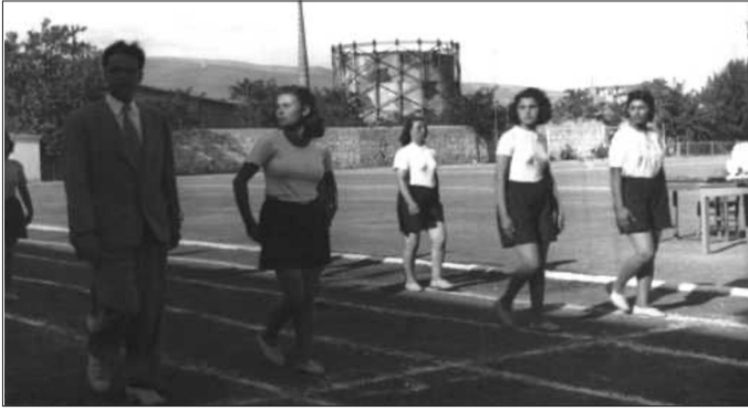
Resim 5. İzmir Alsancak Stadında Yapılan Atletizm Bayramına Ait Görüntüler-3

Bu malzemelerin tesliminin ardından yaklaşık 1 ay sonra 50 çift lastik ayakkabı da İzmir Halkevi'ne ulaştırılmıştır. 46 CHP Genel Sekreterliği, İzmir Halkevi'ne gönderdiği malzemeler için toplamda 1695,49 TL'lik bir meblağ ödemiştir. 47 1945 yılının Ekim ayında İzmir Halkevi'ne 150 adet yüzme donu gönderilmiştir. 48 Bu gelen malzemenin 70 tanesi İzmir Halkevi'nde kalmış, geri kalan 40 tanesi Karşıyaka, 10'ar tanesi de Çeşme, Urla, Dikili ve Seferihisar Halkevlerine dağıtılmıştır. 49