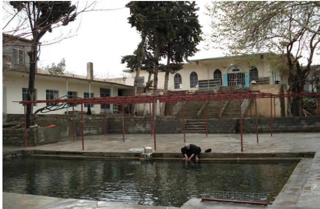
řekil 3: Caminin avlusu

Hurmal Ulu Cami, gnmzde yıkık durumdadır. Yapının, yıkılmadan nce ıkarılan mimari rlve izimi mevcuttur. Bu izimde, kuzey gney ynnde dikdrtgen planlı cami, 25 x 30 m dıř llerindedir (řekil.3) Harim meknı, kible duvarına dik er sıra sahnıla derinlemesine dikdrtgen plan sergilemektedir. Sahnıları, er sıradan toplam dokuz tařıyıcı belirlemektedir. Mevcut planda, harim meknına giriř, kuzey cephe ekseninde ve kuzeybatı křeye yakın duvara aılan kapılardan saęlanmaktaydı. Kible duvarı ortasında, cepheden dıřa tařıntı yapmayan yarım daire planlı mihrap niři mevcuttur (Plan.1).