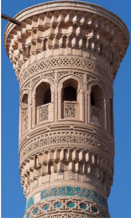
Şekil 14. Vabkent Minaresi (1198)