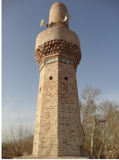
Şekil 10. Hurmal Ulu Cami Minaresi gövdesi

kare kesitli mazgal pencere açıklıkları ile aydınlatılmıştır. Bu açıklıklar, aynı zamanda minare içersine hava akışını da sağlamaktadır (Şekil 9-10).