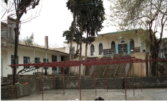
řekil 2. Hurmal Ulu Camisi

Hurmal Ulu Cami, gnmzde yıkık durumdadır. Yapının, yıkılmadan nce ıkarılan mimari rlve izimi mevcuttur. Bu izimde, kuzey gney ynnde dikdrtgen planlı cami, 25 x 30 m dıř llerindedir (řekil.3) Harim meknı, kible duvarına dik er sıra sahnıla derinlemesine dikdrtgen plan sergilemektedir. Sahnıları, er sıradan toplam dokuz tařıyıcı belirlemektedir. Mevcut planda, harim meknına giriř, kuzey cephe ekseninde ve kuzeybatı křeye yakın duvara aılan kapılardan saęlanmaktaydı. Kible duvarı ortasında, cepheden dıřa tařıntı yapmayan yarım daire planlı mihrap niři mevcuttur (Plan.1).