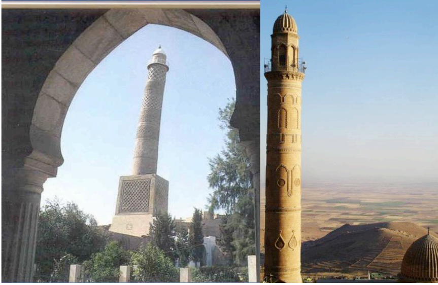
Şekil 21: Musul Al-Habda Camii (Irak) (12. yy) ve Mardin Camii kebir (Ulucami) minaresi (1176) (S. Kılıç, 2011)