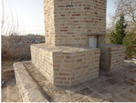
Şekil 6. Minarenin kaide cephesinden görünümü