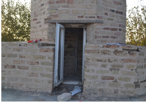
Şekil 7. Minareye çıkış kapısı