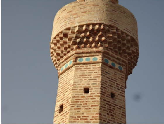
Şekil 11. Hurmal Ulu Cami Minaresi Şerefe bölümü

1,10 m çapta olan Şerefenin alt kısmı belirgin üçgen ögeler şeklinde yapılmış dört sıra mukarnaslarla hareketlendirilmiştir (şekil.11).