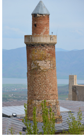
Şekil 15. Harput Ulu Cami Minaresi (1156-1157)