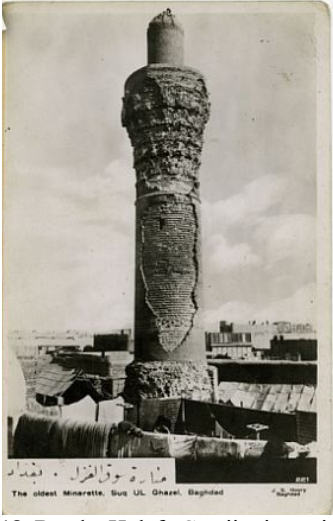
Şekil 18. Bağdat Hulafa Camii minaresi (1356)

(1271)