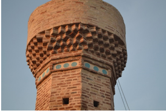
Şeki 12. Mukarnas ve Çinli Süsleme