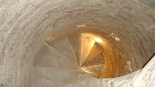
Şekil 8. Minare şerefesine çıkışı sağlayan merdiven basamakları

Spiral formda düzenlenen merdiven basamakları, 0.26 x 0.50 m ebatlarında olup, simetrik işçilik göstermektedir.