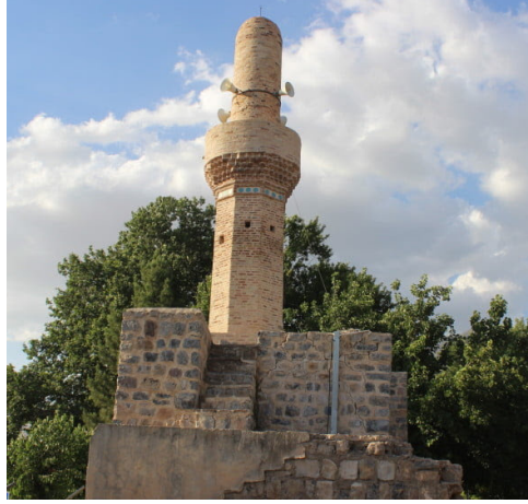
řekil 4. Hurmal Ulu Cami Minaresi genel görünüm

16. yüzyıl Osmanlı döneminde, onarıma tabi tutulduđu bilinen yapının 18 , daha önceki süreçlerde mevcut olduđu ve bölgedeki yapılarla tipolojik ve üslupsal özelliđine dayanılarak ilk inřasının Atabegler zamanında ve son mimari řeklini ise Osmanlı döneminde kazanmıř olabileceđi sonucuna ulařılmaktadır.