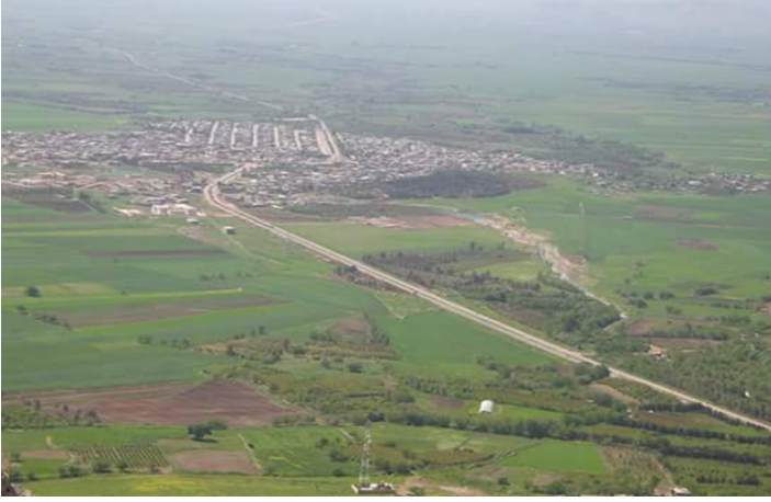
Şekil.1. Hurmal İlçesi'nin Genel Görünümü

sürekli olarak İngilizlerin eline geçmiştir. Hurmal, 1932 yılından günümüze kadar yeni kurulan Irak Hükümeti'nin yönetimi tarafından idare edilmektedir 13 .