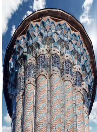
Şekil 17. Erzurum Çifte Minareli Medrese minaresi (13.yy. sonu)