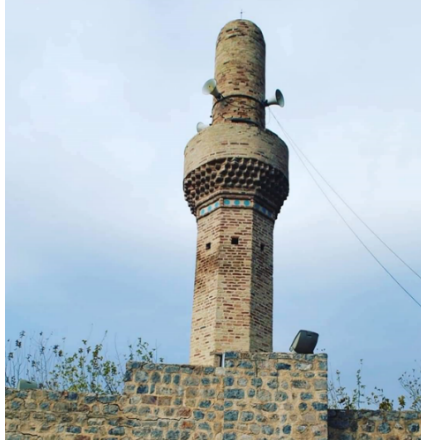
Şekil 5. Hürmal Ulu Cami Minaresi

Gövdesinde iç kısmına ışık ve havayı iletmek ve ağırlıkları azaltmak için bazı küçük açıklıklar mevcuttur. Şerefenin üst kısmında ise yuvarlak bir kubbe ile örtülmüş 3.00 m uzunluğunda silindirik bir petek mevcuttur.