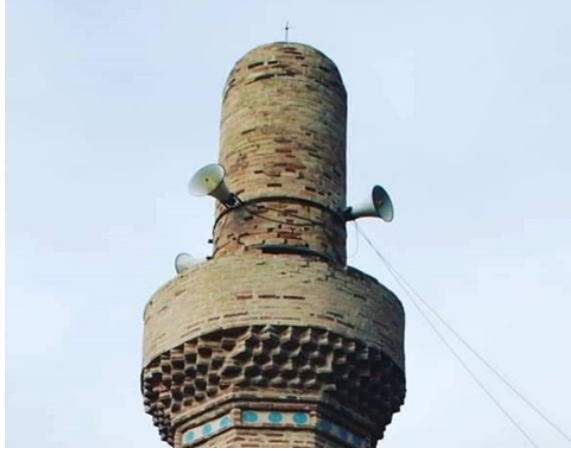
Şekil 13. Hurmalı Ulu Cami Minaresi petek kısmı

Şerefenin üst kısmında ise yuvarlak bir kubbe ile örtülmüş 3.00 m uzunluğunda silindirik petek mevcuttur (Şekil13).