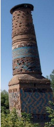
Şekil 16. Siirt Ulu Cami Minaresi (1129)