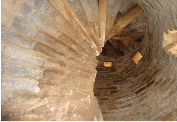
Şekil 9. Pencere açıklıkları

Spiral formda düzenlenen merdiven basamakları, 0.26 x 0.50 m ebatlarında olup, simetrik işçilik göstermektedir.