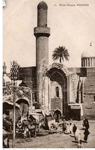
Şekil 19. Bağdat Mirjan Camii minaresi

(1271) Erişim: https://www.alamy.com/stock