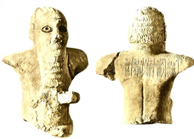
Figür 2: Eşpum tarafından Narunte'ye adanan heykel 81 .