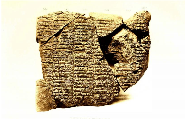
Figür 3: Naram-Sin ve Hita arasında yapıldığı düşünülen antlaşmanın yer aldığı tablet 93 .

Naram-Sin döneminde yaşanan en önemli olaylardan biri, Susa Kral Listesi'ne göre Awan'ın on birinci kralı olan Hita ve Naram-Sin arasında yapıldığı düşünülen bir antlaşmadır. Susa'da bulunan Elamca yazılmış bir tablette bu antlaşmanın içeriği hakkında bilgiler yer almaktadır 92 (Figür 3). Ancak tabletin büyük oranda hasarlı olmasından dolayı antlaşmanın içeriği tam olarak anlaşılammış, Naram-Sin'in kiminle antlaşma yaptığı bile kesin olarak tespit edilememiştir.