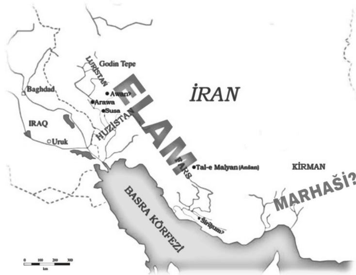
Figür 1: MÖ 2700-2100 arasında bölgenin tarihi coğrafyası 4 .

Eski Yakındoğu tarihinde hem siyasi hem de kültürel olarak önemli bir yere sahip olan Elam, bugünkü İran'ın güneybatı bölgesinde ortaya çıkmıştır. Elam'ın sınırları kuzeyde günümüz Luristan'dan başlayarak, doğuda Kirman'a kadar, güneyde ise Fars ve Buşehr eyaletlerini içine alacak şekilde bölgeyi kapsamıştır 1 (Figür. 1). Sözü edilen bölgede, Huzistan eyaletinde yer alan Susa ve Fars eyaletinde bulunan Anšan (Tal-e Malyan) Elam'ın çekirdek bölgesini oluşturur. Anšan'ın bulunduğu bölge dağlık bir coğrafyaya sahip iken, buna karşın Susa Susiana olarak adlandırılan ovalık bir alanda yer almaktadır. Susiana bölgesinde bulunan Karun, Karkheh ve Dez gibi başlıca nehirler, tarım açısından elverişli bir ortamın oluşmasını sağlamıştır 2 . Nehirler sulamada kullanılmakla birlikte, ulaşımın sağlanmasında da rol oynamıştır. Bu nehirler arasında özellikle Karun'un, MÖ 3. binyıldan itibaren Basra Körfezi'ne ulaşımın sağlanmasında kullanıldığı bilinmektedir 3 .