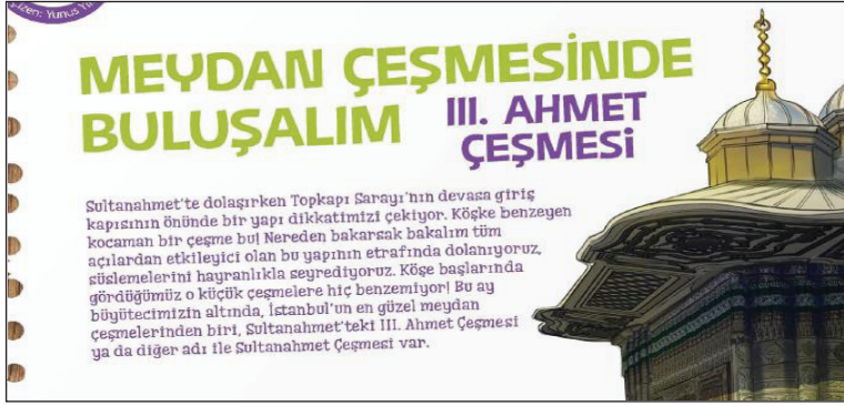
Görsel 4. III. Ahmet Çeşmesi

TRT Çocuk dergisinde SB.5.2.4. kodlu kazanımın edinilmesine katkı sağlayacağı düşünülen konulara ilişkin örnek alıntılar şunlardır: