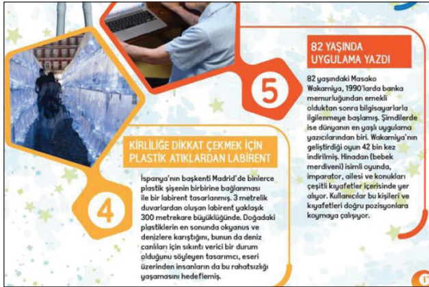
Görsel 8. Yenilikçi fikirler.

Bu Okul Enerjisini Güneşten Üretiyor: Geçtiğimiz yıl Antalya'nın Kepez ilçesindeki Baraj Mesleki ve Teknik Anadolu Lisesi'nde açılan “Yenilenebilir Enerji Teknolojileri” bölümü sayesinde öğrencilere güneş ve rüzgâr enerjisi teknolojileri eğitimi verilmesi amacıyla bir laboratuvar oluşturuldu. Laboratuvarda üretilen güneş panelleri sayesinde okulun enerji ihtiyacının bir kısmı karşılanabiliyor (TRT Çocuk, 2017 Kasım, s. 16-17).