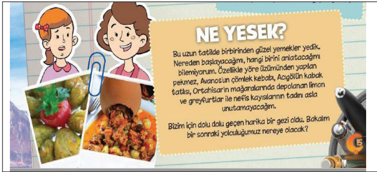
Görsel 3. Nevşehir'in kültürel yiyecekleri.

TRT Çocuk dergisinde SB.5.2.3. kodlu kazanımın edinilmesine katkı sağlayacağı düşünülen konulara ilişkin örnek aşağıda sunulmuştur: