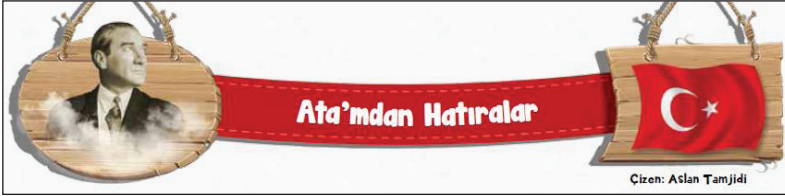
Görsel 9. Ata'mdan hatıralar.

TRT Çocuk dergisinde SB.5.6.4. kodlu kazanımın edinilmesine katkı sağlayacağı düşünülen konuyla ilgili doğrudan alıntı şu şekildedir: