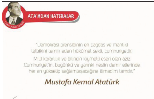
Görsel 10. Ata'mdan hatıralar