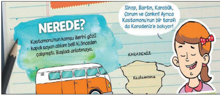
Görsel 6. Kastamonu

“Gezgin Aile (Kastamonu): Kastamonu, doğal ve kültürel birçok zenginliğe ev sahipliği yapmaktadır. Küre Dağları, bir milyon yıllık Ilgarini Mağarası, meşhur Valla Kanyonu, Ilgaz Dağı, sahili...” (TRT Çocuk, 2017 Şubat, s. 14)