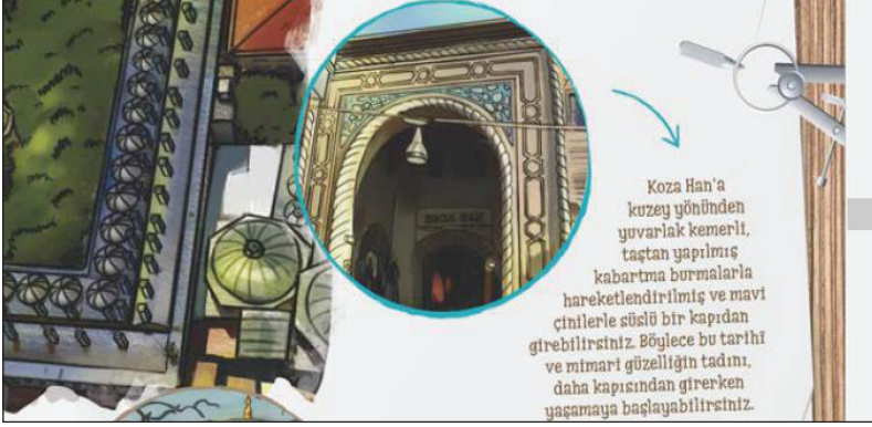
Görsel 2. Koza Han