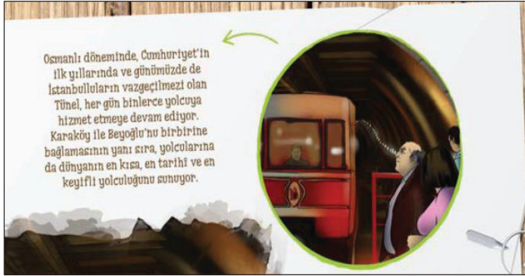
Görsel 5. Tünel

ziz Han'ın da onayını alınca inşaatı başlamış. 5 Aralık 1874'de yapımı tamamlanan Tünel'de ilk önce hayvan taşımaya deneme seferleri yapılmış. 17 Ocak 1875'te ise yerli ve yabancı bir grup davetlinin de katıldığı görkemli bir törenle Tünel hizmete açılmış. (TRT Çocuk, 2017 Ağustos, s. 40-41)