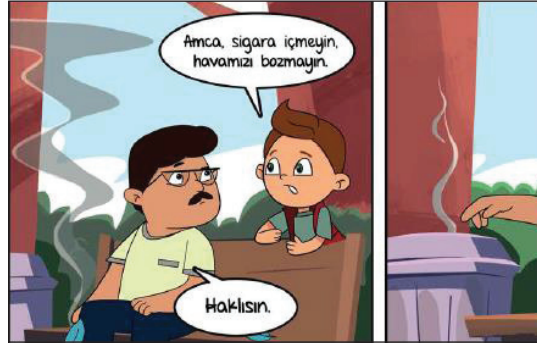
Görsel 1. Dumansız hava sahası.

SB.5.1.4. kodlu kazanımın edinilmesine katkı sağlayacağı düşünülen bir konuyla ilgili doğrudan alıntı şu şekildedir: