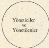
Ayniyat ilişkisi Yöneticiler = Yönetilenler

Bu üç münâsebet, siyasî toplumun üç halini dile getirir. Birincisi, iktidar-itaat münâsebetinin mevcut olmadığı bir topluluğun hali; siyasî iktidarın gelişiminin başlangıcında, mevcut değilmiş gibi görüldüğü toplumun durumudur. İkincisi, iştirâkin topyekün olduğu topluluğu kapsar, fakat orada, topluluğun boyutları, yöneticilerle yönetilenler arasındaki mükemmel bir karşılaşmayı temin eder. Üçüncüsü, kendinde siyasî yapıların açığa çıktığı, fakat yönetenlerin artık yönetilenleri temsil etmediği bir toplumun halini dile getirir. Temsilin eşitsizliği kesin bir şekilde açıktır, fakat bu hal elbette toplumdan topluma değişir.