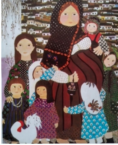
Şekil 5: Oya Katoğlu, “Döne Yahut Oğlan Çocuğu Bekleyişi”, 1971.