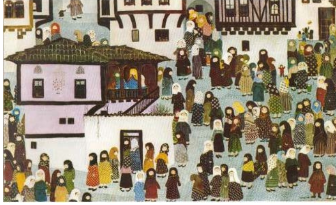
Şekil 4: Oya Katoğlu, “Gelin Evini Ziyaret”, 1969, T.ü.y.b, 135 x 220 cm.