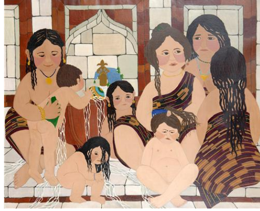
Şekil 10: Oya Katoğlu, “Eski Hamam, Eski Tas”, 1986, T.ü.y.b, 80 x 100 cm.