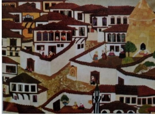
Şekil 14: Oya Katoğlu, “Mahalle”, Tarihsiz, T.ü.y.b.

Çalışmalarını geleneksel Türk evleriyle, köprülerle, kayalıklarla ve çeşit çeşit ağaçlarla ayrıntıcı bir yaklaşımla zenginleştirir.