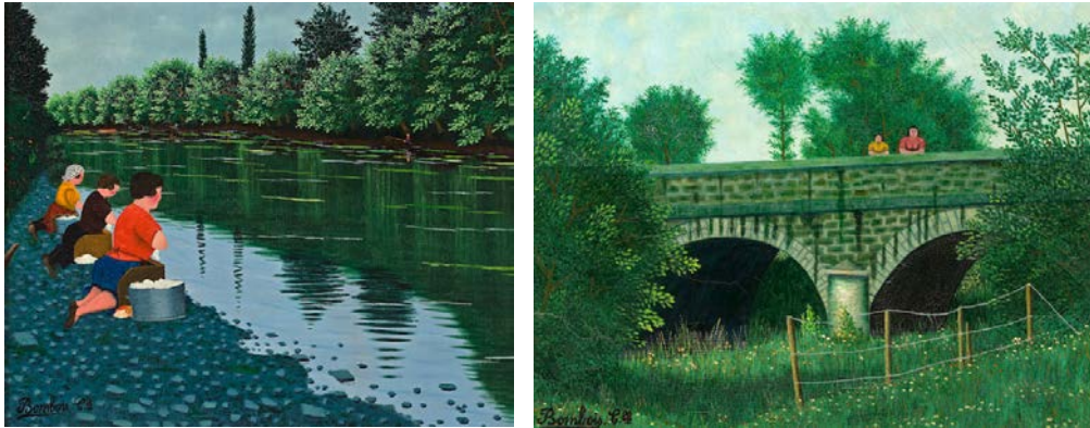
Şekil 18-19: Camille Bombois, "Çamaşırıcı Kadınlar", T.ü.y.b, 38,7 x 46,3 cm; Camille Bombois, "İsimsiz", 1935, T.ü.y.b, 46,3 x 61 cm.