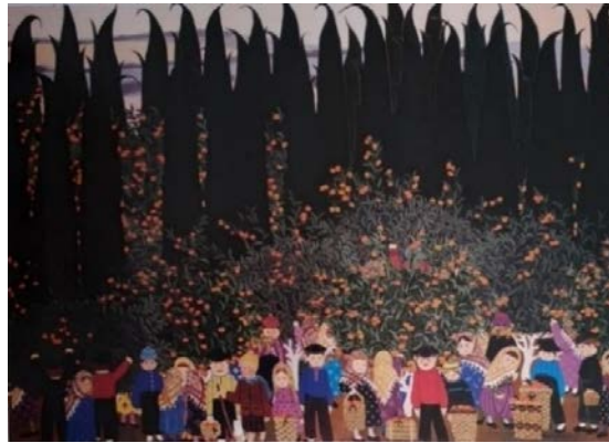
Şekil 15: Oya Katoğlu, “Hanımın Çiftliği”, 1992, T.ü.y.b, 70 x 100 cm, Mesrure ve Ahmet Yücekök Koleksiyonu.

Oya Katoğlu, Anadolu yaşamını ve mimari konuları aktardığı resimlerin detaylarında daha önceki satırlarda da belirtildiği gibi pencereden bakan figürleri sıklıkla resmetmiştir. Şekil 7'deki 1973 tarihli “Pencere Sefası I” resmi ile başladığı pencere temalı eserlerini 1991 yılına kadar sürdürür. Pencereleri konu alan “Dışarda Soğuk Var” (1991) ve “Sabah Akşam” (1991) isimli eserlerinde ressam bir kez daha kadın temasına yönelmiştir. Diğer pencere temalı eserleri arasında ön plana çıkan “Dışarda Soğuk Var” çalışmasında bir evin iç mekânı ele alınmıştır (Şekil 22). Katoğlu, iç mekânda pencerelerde, el sanatı ürünü olan beyaz tığ işi dantel tüllere, raflarda seramik kâselere, sedirlerdeki desenli kumaşlar ile kanaviçe örtülere kadar resmetmiştir.