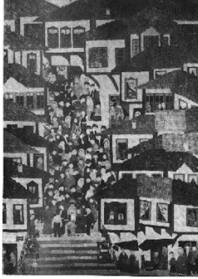
Şekil 2: Oya Katoğlu'nun "Ankara'da Çarşı Sokağı" Adlı Resmi, T.ü.y.b.