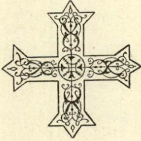
Kipti Haç'ından iki örnek