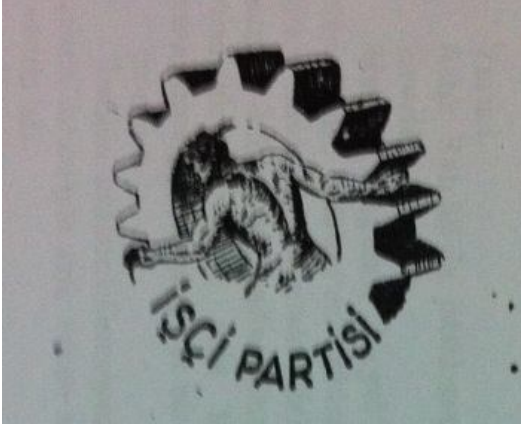
Fotoğraf 1: (Demokrat) İşçi Partisi Amblemi

vazgeçilen Tarla adlı bir gazetesi vardır (Birinci Sarı Çizgili Kitap, 1953; 13). Parti, 1953 yılındaki İkinci Genel Kongresinde adını İşçi Partisi olarak değiştirmiştir.