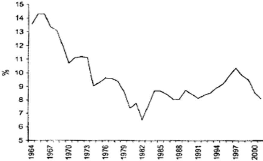
Şekil 1: ABD Vergi Öncesi Kâr Oranları (1964-2003)