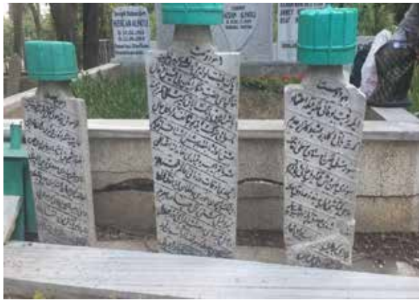
No: 16, 17, 18