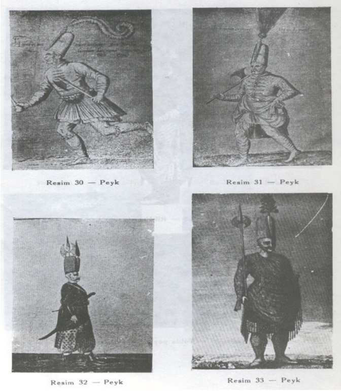
Resim 1: Peyklerin İmaji 69