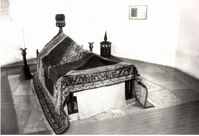
Fotoğraf 2: Gül Baba Türbesi'nin iç mekânını gösteren 1970'lere ait kartpostal Bu resimde görülen şamdanlar, sehpa, buhurdan ve sandukadaki tâc günümüzde Gül Baba Müzesi'nde teşhir edilmektedir (Bkz. Fotoğraf 1).