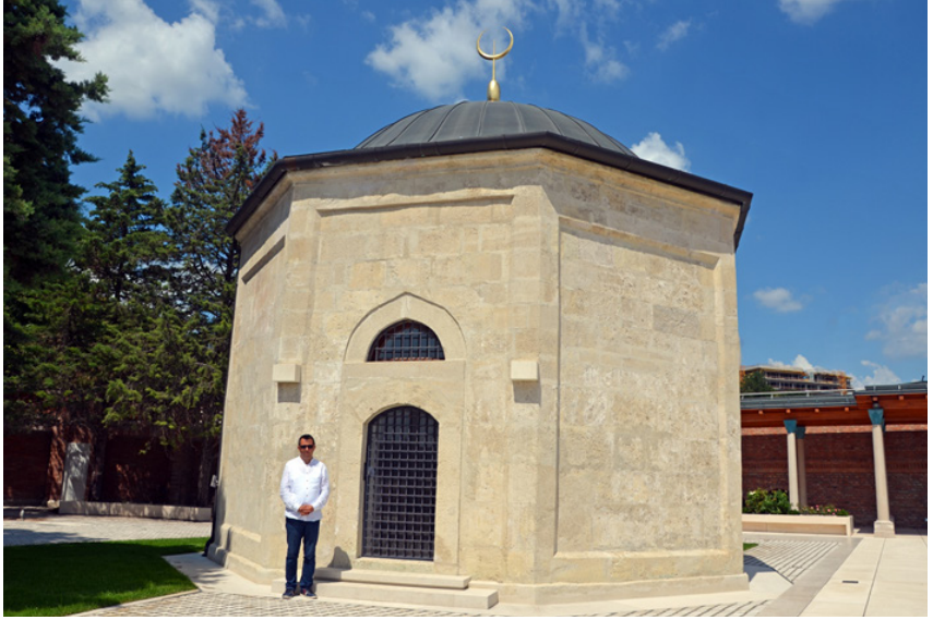
Fotoğraf 7: Gül Baba Türbesi'nin genel görünüşü (2018)