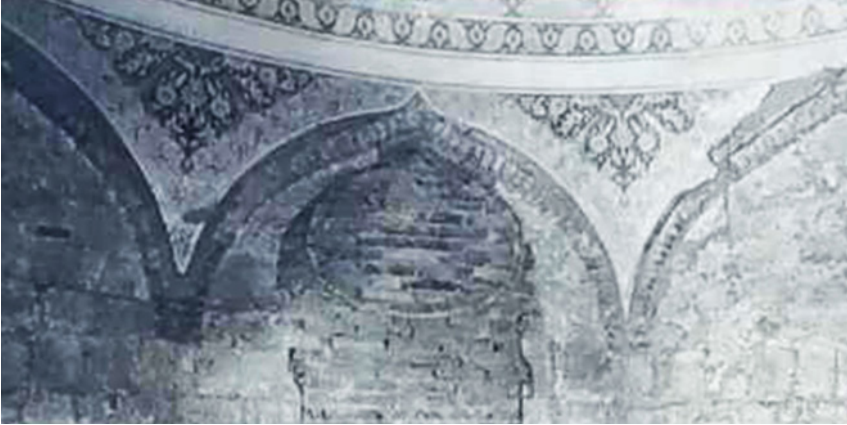
Fotoğraf 6: Yukarıdaki fotoğrafta görülen kalemîşi süslemelerden ayrıntı