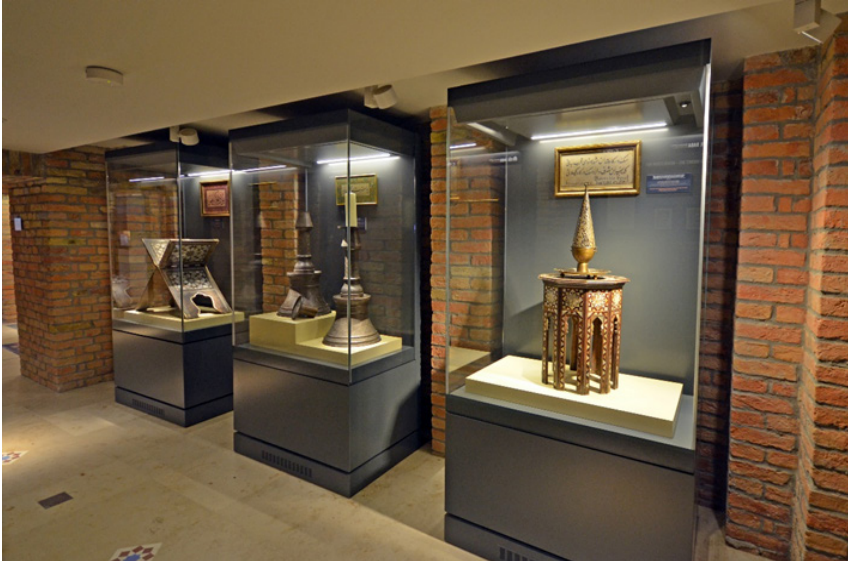
Fotoğraf 3: Ahmed Hikmet Bey'in talebiyle İstanbul'dan gönderilen şamdanlar, rahle, sehpa ve buhurdan günümüzde Gül Baba Müzesi'nin 4. salonunda teşhir edilmektedir. (2018, Mehmet Emin Yılmaz)