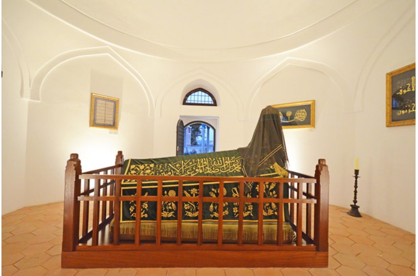
Fotoğraf 8: Gül Baba Türbesi'nin iç mekânı (2018)