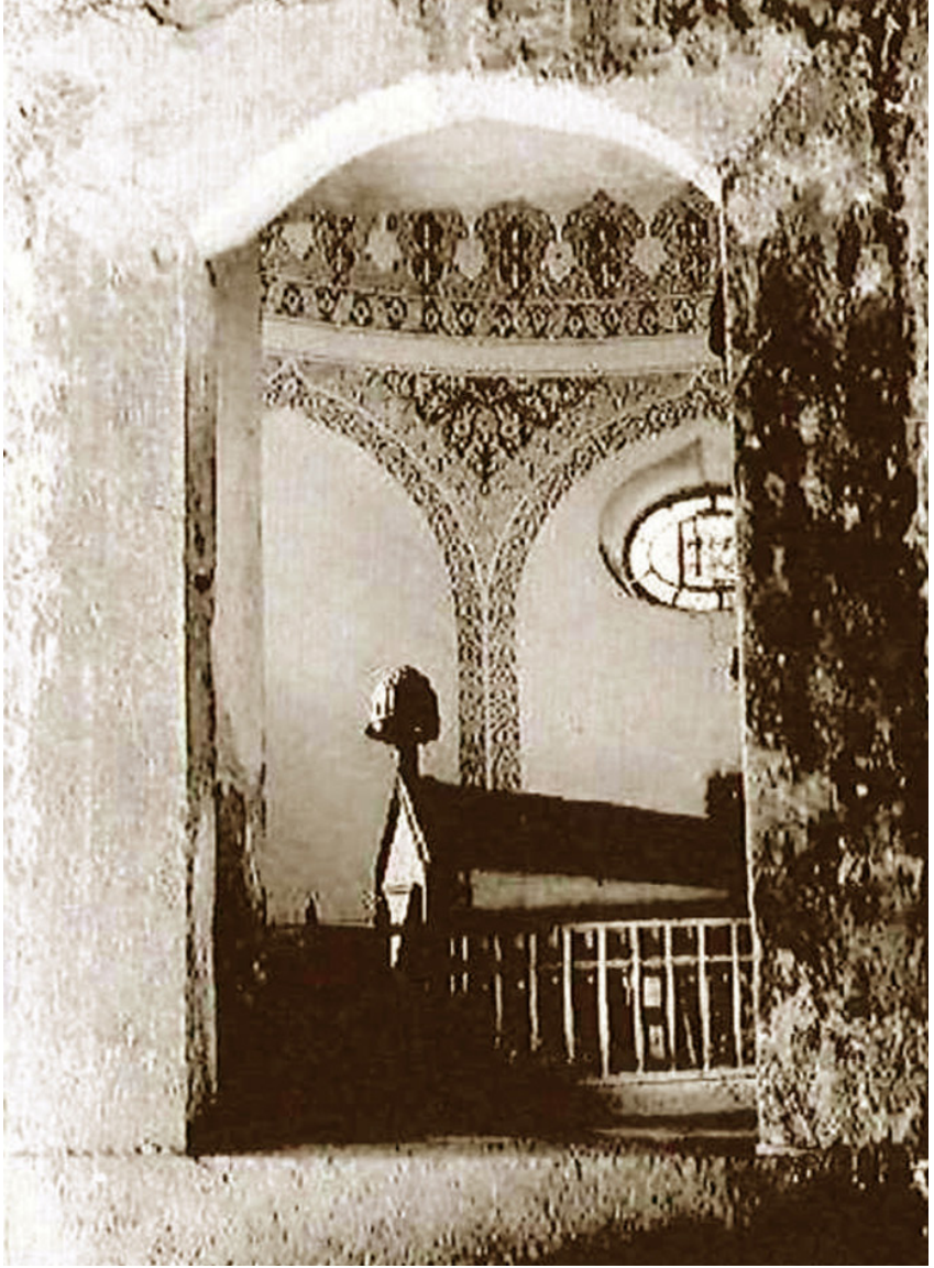
Fotoğraf 4: Mimar Kemâleddin Bey'in yaptığı onarım sonrasında Gül Baba Türbesi (Lászay 2015:11),