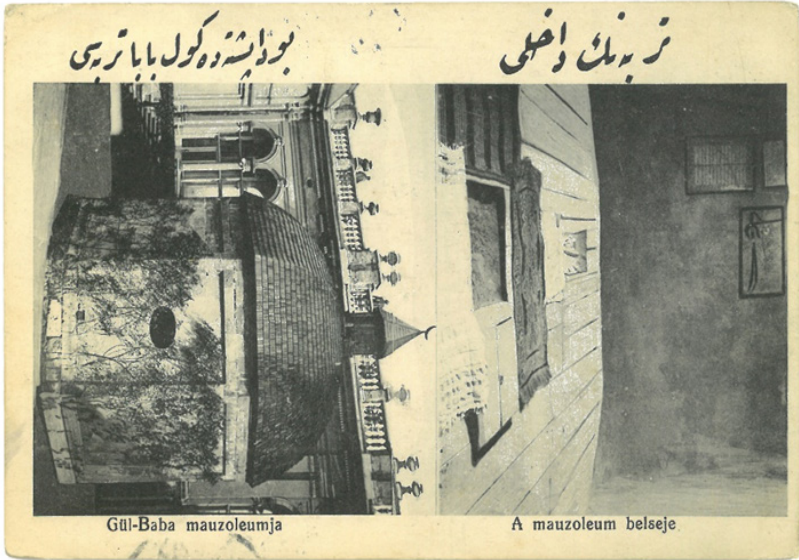
Fotoğraf 1: Ahmed Hikmet Bey'in Yusuf Akçura'ya Peşte'den yolladığı Gül Baba resimli kartpostal – 1915 (Mehmet Emin Yılmaz arşivi)