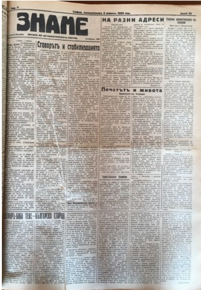
Zname Gazetesi, 2 Nisan 1928, sayı 75, sayfa 1: “Bulgar Eski Eseri Demir Baba Tekkesi”

Ocak ayında gazetelerde Bulgar Çarı Omurtag'ın mezarının tahkir ve tezvil edildiği haberi yayımlandı. Bu haber, Sofya'da çıkan Rehber Gazetesi'nin 4 Şubat tarihli ve 3. sayısıyla Razgrad Arkeoloji Cemiyeti tarafından gündeme getirilen tekke ve mülkiyetinin yasadışı sahipleri, yani Razgrad Vakıf Komisyonu elinden alınması meselesi aleyhinde ironik bir not yayınlamaya sevk etti. Söz konusu gazete, tekkenin mülkiyeti, komşu Bulgarların nefret ve tamamı tahrik etmektedir diye yazmakta ve daha 25-30 yıl önce tekkeye Sveti Dimitir adını vermekle onu ihtilâs etmek istediklerini, fakat taraflarından Ruse'de açılan dava, asılsız olduğu için onlara yardım edememiş. O zamandan bu yana tekke Razgrad Müslüman Cemaati idaresi altında kalmıştı. Fakat