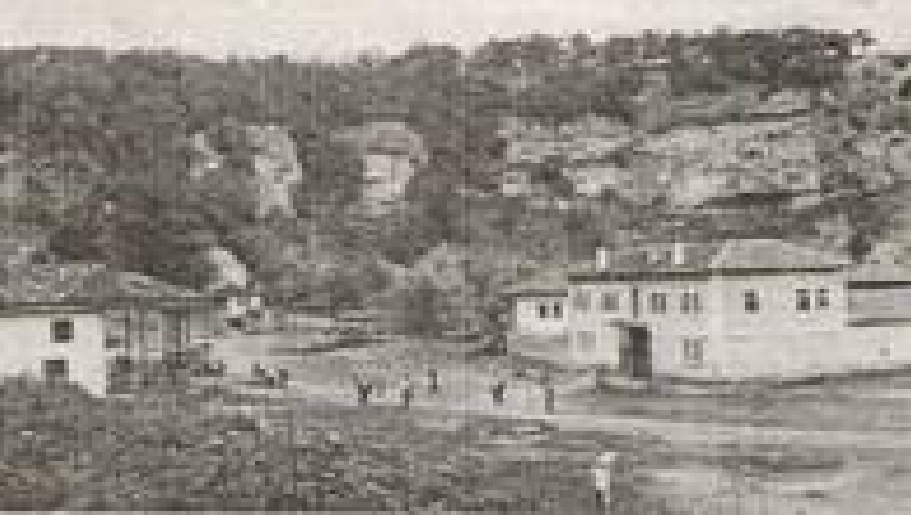
Fotoğraf 10: 1930 yılında “Sveti (Aziz) İliya” gününde Demir Baba Tekkesinde düzenlenen ulusal şenlik (İliev-Yordanov, 1931: 13).