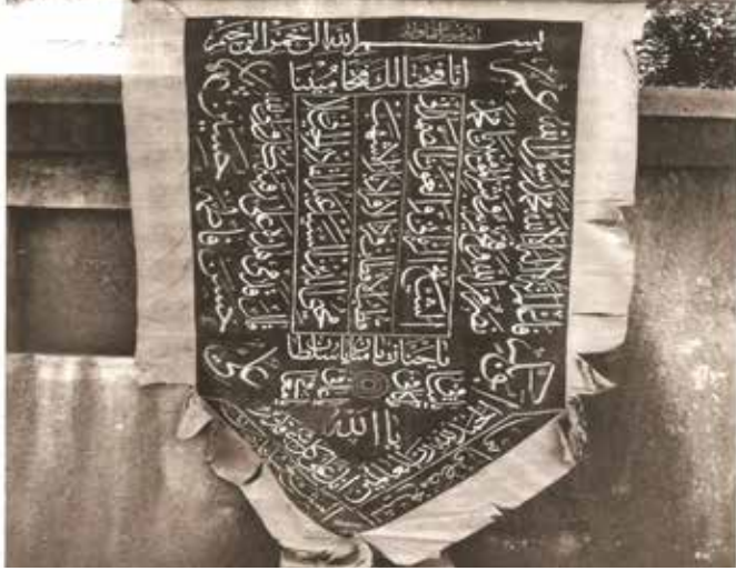
Şekil 5. Üzerinde Fetih Süresi'nin ilk âyeti, Allah'ın bazı isimleri, Abdülkâdir Geylânî'nin ve Hulefâ-i Râşidîn'in isimleri bulunan sancak

Denizde kaybedilen sancaklar dikkate alındığında elde mevcut ilk Osmanlı sancağının 1559'a tarihlendiği söylenmektedir. O zamanlar kayrak taşı renginde olan Osmanlı sancağı, sonradan yeşil olmuştur. Hz. Muhammed'in yeşil sancağı zamanla farklı tonlarda kullanılmış olsa bile Ehl-i Beyt'i ifade ettiği düşünülen bu renk Osmanlı sancaklarında sabit bir renk olarak varlığını sürdürmüştür (Goodwin, 2011: 75).