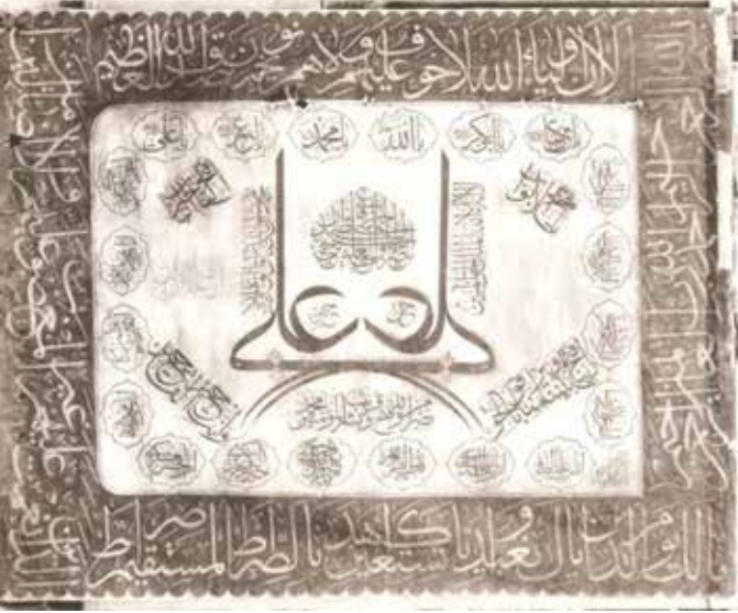
Şekil 4. Üzerinde Fatiha Süresi, Ehl-i Beyt'in ve On İki İmam'ın isimleri bulunan sancak

Bektaşî Tarikatı ile organik bağı bulunan Yeniçeri Ocağının kanun ve kaidelerini beyan eden bir eserde Hz. Peygamber'in sancağı şöyle yer bulmuştur: “Sual: Kuşağı nerede kuşandın? Cevap: Erenler meydanında, gök kubbenin altında pirlere huzurunda erkân kapısında Muhammed Mustafâ (sav) Efendimizin sancağı tahtında kuşandım (Anonim-5, ty: 18 a-b ) ... Sual: Ocak ağalarının başındaki tuğlar ve üsküfler kimden kaldı? Cevap: Ebâ Müslim Emir Abdurrahman'dan kaldı ... (Anonim-5, ty: 22 a-b ).”