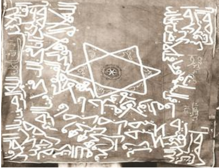
Şekil 2. Üzerinde Âyete'l-Kürsî, “Yâ Hazreti Abdülkâdir Geylânî” yazısı ve mühr-i Süleyman nakşedilmiş bir sancak

Dolayısıyla tarikat kıyafetleri alelade unsurlar olarak görülmemekte, bu kıyafet ve eşya manevi bir kökene atıfta bulunmak suretiyle manevi yükselişi ifade etmektedir. Tâc, hırka, çerağ, sofrâ ve seccâde, alem gibi kıyafetler ve tarikat eşyası, karizmasını ruhani bir silsileden almaktadır (Anonim-2, ty: 1 a , 8 b ). Buna göre Allah'ın emri ile önce Cebrail vasıtasıyla Hz. Peygamber'e sonra sırasıyla, Hz. Ali, Ahmed Yesevî ve Hacı Bektaş-ı Velî'ye intikal eden emanetler dört kapı kırk makam düsturu çerçevesinde sembolik değer taşıyan unsurlar olarak görülmektedir. Seyahatleri sırasında sık sık tekke ziyaretleri yapan Evliya Çelebi, Tosya'daki Koyun Baba Türbesi'nde bulunan emanetlerin, Ahmed Yesevî'nin Hacı Bektaş-ı Velî'ye verdiği zikredilen mukaddes eşyalar olduğunu iddia eder ve şöyle der: Koyun Baba bizzat Hacı Bektaş'ın halifelerindendir. Tekkeyi gezip görerek fukaraları ile konuştuk ve Baba nimetlerinden yedik. Hâlâ nurlu kubbelerinde o hazretin Hacı Bektaş Velî'den aldığı fakirlik nişanelerinden tâc, hırka, seccâde, tabıl, alem, kudüm, pallhenk, asâ ve tâc saklıdır (2003: 1-525). Hatta Allah'ın Hz. Âdem'in tevbesini kabul ederek tekrar sırtına keramet hilatını, başına ise saadet tâcî geçirmesi ve altına hilâfet seccâdesini de döşeyip beline ise ibadet kemerini kuşatması tasavvufî bir kabuldür (Kara, 2008: 382).