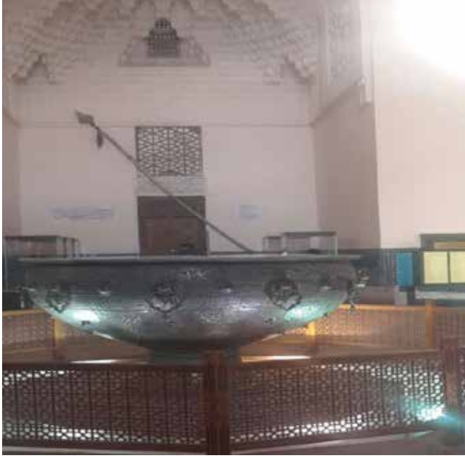
Şekil 7. Ahmed Yesevî Türbesi'nde tay kazanın ardındaki duvarda sergilenen tuğ ve alem (25.02.2016-Kazakistan)

referanslarının bir kısmı İslâmî olmakla birlikte tuğ gibi unsurlar dikkate alındığında eklektik bazı tesirler de içeren hükümdarlık alametleri ve hilafet nişanları arasında görece bir ilişki kurmak mümkündür. İslam halifesinin bir hükümdara adı geçen eşyayı hediye olarak göndermesi, halifenin söz konusu hükümdarın meşruiyetini kabul etmesi anlamına gelmektedir (İbn Fazlan, 1975: 44).