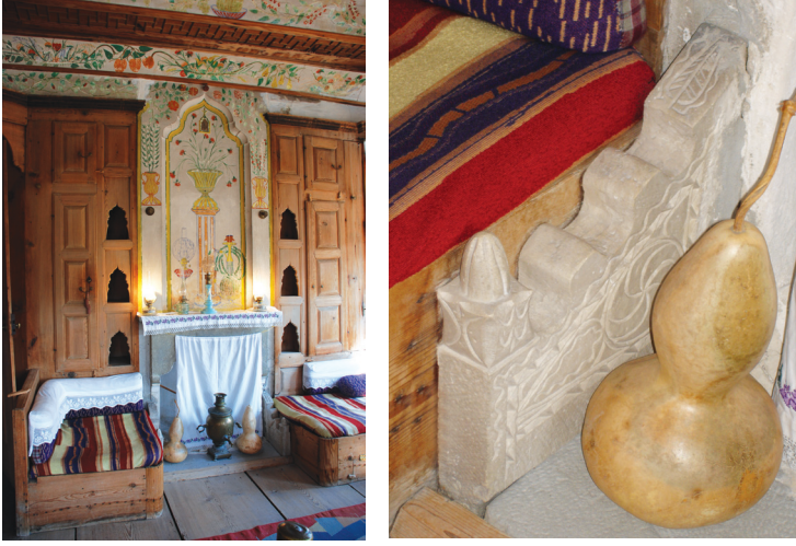
Resim 12: Sipahioğlu Konağı'nda ocak- sedir- dolap ilişkisi ve ocağın koltuk taşında oyma işçiliği.