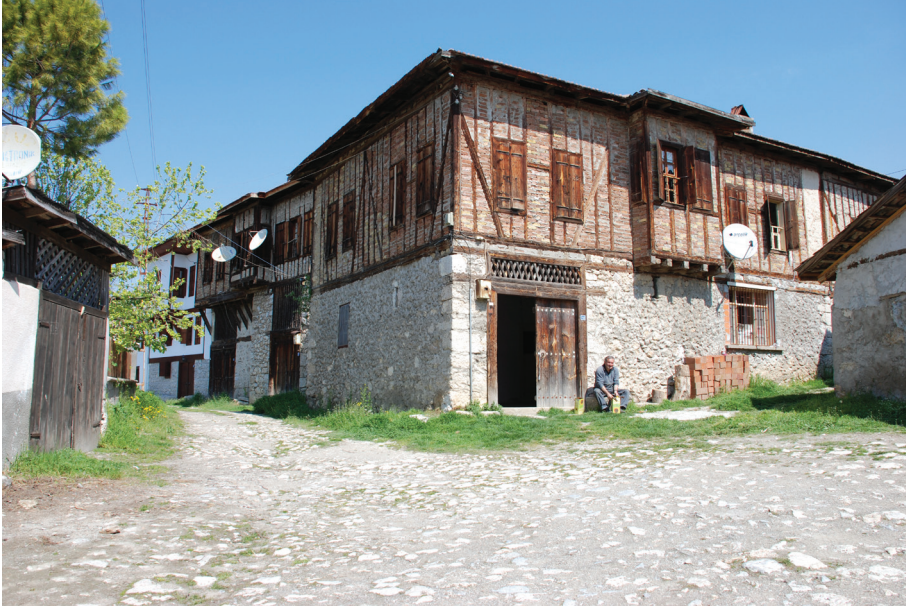
Resim 3: Yörük Köyü'nde evlerin dış cephelerinde çıkma ve cumbalar az sayıda görülmektedir. Evlere çift kanatlı bir kapı ile girilmektedir.

Yörük Köyü evlerinin birinde görülen önemli bir özellik de Deftergil Evi olarak bilinen konutta bir odanın tepeden aydınlatılan bir odasının bulunmasıdır. Bu örnek, köy konutlarının göçebe dönem barınaklarından gelişmiş olduğunu göstermektedir (Özköse 2000: 122) (Resim- 4 ). Göçebe dönem barınağı olan yurt çadırında da iç mekân çadırın tavanında açılmış bir delikten aydınlatılmakta ve havalandırılmaktaydı.