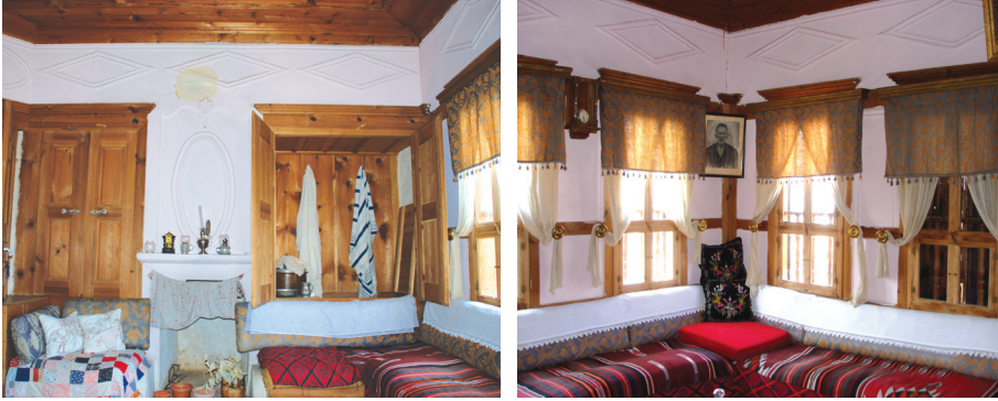
Resim 13: Solda Sucu Hafız Evi'nde başoda, sağda ara kat odası.

Odalara giriş incelenen örneklerde de görüldüğü üzere geleneksel Türk evindekinin aksine bir paravan ile ayrılmamıştır ve odalara kapıdan direk giriş sağlanmıştır. Ayrıca diğer geleneksel Türk evi uygulamalarında olduğu gibi Yörük Köyü'ndeki evlerin odalarının girişi ile odanın zemininde kot farkı uygulanmamıştır. Oda kapıları tablalı konstrüksiyonda kuru geçme tekniğinde yapılmıştır. Kapı çerçevesi çam ağacından tablası ise ceviz ağacından oluşturulmuştur. Sucu Hafız Evi'nde olduğu gibi bazı evlerde kapıların üst yüzeyleri yağlı boya ile boyanmıştır.