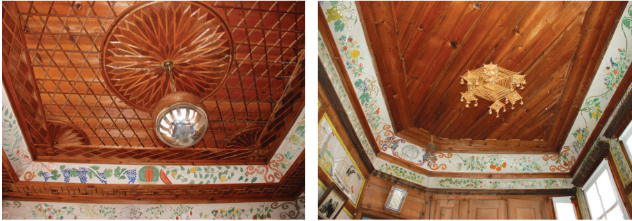
Resim 14: Solda başoda tavan süslemeleri ve aynalı avize, sağda tavan süsü- Sipahioğlu Konağı.

Her odanın kendine ait bir halısı bulunmaktadır. Sedirleri oluşturan minderlerin üzeri özel dokumalarla süslenmiştir. Esasen bu dokumalar salt dekoratif amaçlı olmayıp sedirdeki minderlerin bütünlüğünü sağlamak amaçlı kullanılmıştır. Pencereerde beyaz işli perdeler kullanılmıştır. Sucu Hafız Evi'nde saraydan geldiği belirtilen özel dokuma perdeler ve perde kornişleri kullanılmıştır (Resim-15). Kişisel temizliğe önem veren Türkler için yıkanma önemli bir günlük işlemdir. Yıkanma işlevi için bu odalarda “hamamlık” olarak isimlendirilen özel dolaplar yapılmıştır (Resim-13, Resim-15). Yıkanılacağı zaman dolabın içinde depolanan yorgan, döşek gibi eşyalar çıkarılmakta ve dolabın altında yer alan ahşap kapak kaldırılarak dolap bir yıkanma küvetine döndürülmektedir. Öte yandan, Hersek ve Merakî (2003:163) araştırmalarında köyün en eski evi olan Odabaşığıl Evi'nde olduğu gibi bazı örneklerde bünyesinde taştan inşa edilmiş ev hamamı yer aldığına dikkati çekmektedir.