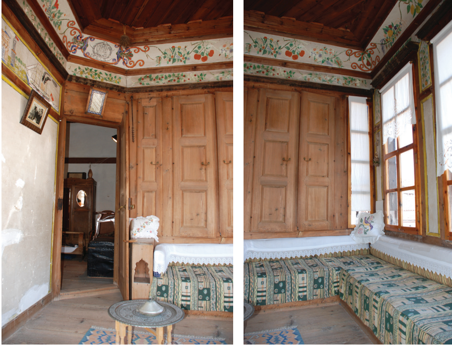
Resim 10: Odada giriş- pencere, sedir, hamamlık ilişkisi. Sipahioğlu Konağı.

Odaların dış mekânla bağlantısı pencerelerle sağlanmaktadır. Bölgenin ormanlık olmasından dolayı ahşap torna işçiliğinin gelişmesi nedeniyle pencerelerin dışında torna işi ile şekillendirilmiş ahşap korkuluklar yer almaktadır. Hatta bu yöredeki torna ustalarının Beypazarı gibi başka kentlere de giderek evlerin süsleme işlerinde çalıştığı bilinmektedir (Aksulu 1985: 20). Küçük kayıtlarla bölünmüş 75-80 santimetre genişliğindeki pencerelerin odaya bakan kısmında ise sedir yer almaktadır. Sedire oturan kişi rahatlıkla dışarıyı seyredebilmektedir (Resim-10). Odanın odak noktası ısıtma ve yemek yapma işlevini gören ve dekorasyonuna özen gösterilen ocaktır. Bu köyde genellikle kalker taşı kullanılarak yapılan ocağın üzerinde davlumbaz adı verilen, lamba vesaire koymak için yapılmış bir raf bulunmaktadır. Davlumbazın her iki kenarında eşya koymaya yarayan ve testere ile oyma işçiliğiyle şekillendirilmiş “oyma” olarak isimlendirilen nişler yer almaktadır. Ocağın tabanı dikdörtgen ya da dairesel formda odanın içine taşmaktadır. Günay (1999: 298) eserinde taş işçiliği ustalarının bölgede yaşayan Rumlar olduğunu belirtmektedir. 19. yüzyılın ikinci yarısından itibaren odaların ısınmasını kolaylaştırmak için ocakların bacasına soba borusu bağlanmış ve soba ısıtma aracı olarak odalara girmiştir (Resim-9). Sedirle ve ocakla çevrelenen odanın ortası esnek kullanım için boş bırakılmıştır. Depolama işlevi “hamamlık” adı verilen dolaplar ile çözümlenmiştir (Kara 2005: 58).