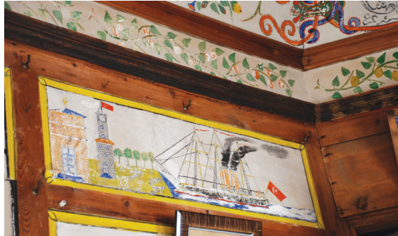
Resim 11: Solda Sipahioğlu Konağı'nın başodasında kalem işi süslemeler, sağda bu kalem işleri arasında yer alan İstanbul konulu duvar resmi.