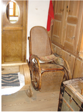
Resim 17: Sipahioğlu Konağı’nda Thonet marka sallanır iskemle ve eyvanda bulunan büfe.