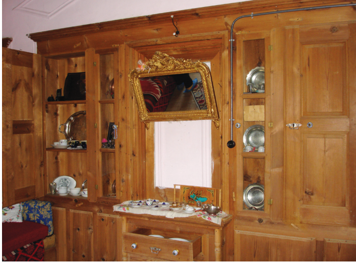
Resim 18: Sucu Hafız Evi'nin odasında Batı tarzı dolap ve çekmeceler.