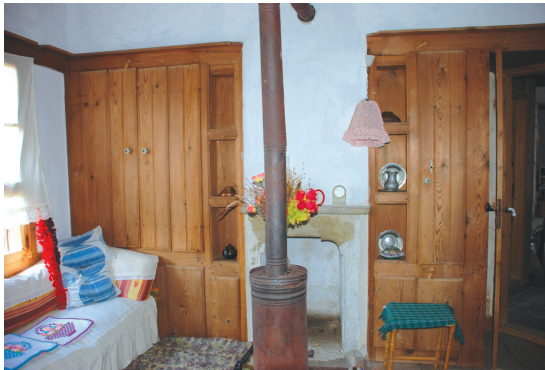
Resim 15: Sedir- ocak- dolap ve hamamlık ilişkisi. Sucu Hafız Evi.