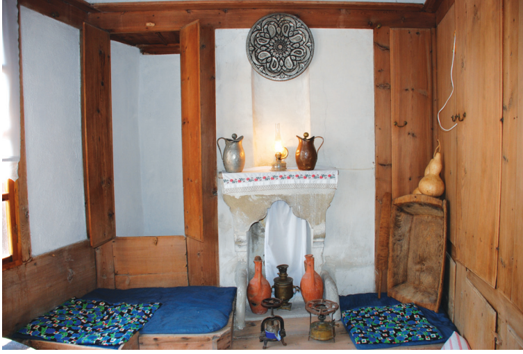
Resim 16: Orta katta aşevi ya da ekmekevi olarak isimlendirilen oda. Sipahioğlu Konağı.

Orta katta yer alan odalardan biri ise mutfak işlevi için özel olarak düzenlenmiştir. “Aşevi” ya da “ekmek evi” olarak isimlendirilen bu odaların düzenlemesi de diğer odalarla aynıdır. Ancak ocakları daha büyük, dolapları ve rafları daha fazla, dekorasyonları ise oldukça yalındır (Resim-16).