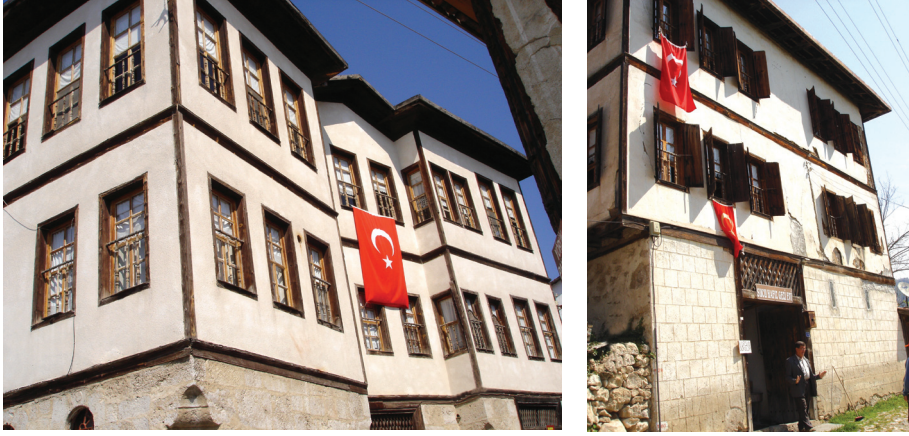
Resim 1: Solda Sipahioğlu Konağı, sağda Sucu Hafız Evi.

Çalışmanın ilk safhasında Yörük Köyü yerleşiminin tarihsel ve genel özelliklerine değinilmiştir. İkinci safhada Yörük Köyü evleri özelinde geleneksel Türk evinin genel özellikleri belirtilmiş, üçüncü safhada ise Yörük Köyü evinin oda özellikleri temel alınarak geleneksel Türk evinin oda kuruluşu ve dekorasyonu araştırılmıştır. Dördüncü safhada araştırma sonucunda elde edilen bulgular verilerek Yörük Köyü kapsamında geleneksel Türk evinin odasının oluşumunda konut kullanıcısının yaşam kültürü ve alışkanlıklarının etkileri tespit edilmiştir.