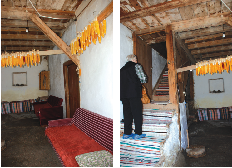
Resim 5: Solda zemin katta taşlık mekânı ve kilere geçiş, sağda taşlıktan çardağa çıkış- Sucu Hafız Evi.

Konutların bir yanında veya tüm çevresinde yer alan açık mekânların içinde kuyu, ocak, pekmezlik veya samanlık gibi üniteler vardır. Sokaktan yüksek bir duvarla ayrılan konuta çift kanatlı kapı ile girilmektedir (Resim-3). Bu kapının tek kanadı daima sabit dururken eve giriş ve çıkış için kapının tek kanadı kullanılmaktadır. Yörede demircilik önemli bir iş kolu olduğundan kapı tokmakları özenle işlenmiştir. Her evin kapısının tokmağı ayrı biçim ve özelliktedir. Kapıdan girildiğinde zemin katta taşlık, mutfak, ahır ve depo hacimleri yer almaktadır. “Taşlık” mekânı zemini taş kaplı olduğu için bu ismi almıştır (Resim- 5). Merdivenden çıkışta merdiven sahanlığında erzak depolama amaçlı dolaplar tasarlanmıştır (Resim-6).