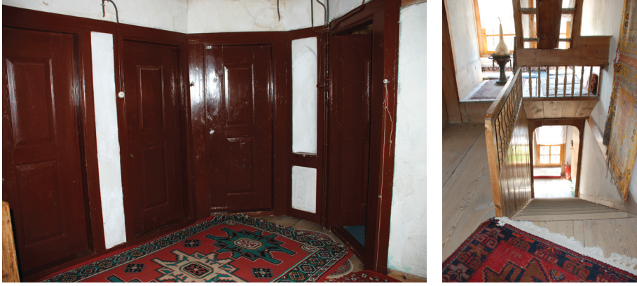
Resim 7: Solda, pahlı köşe sofaı plan tipinde oda kapılarının yerleşimi- Sucu Hafız Evi, sağda çardak- merdiven ve özel oturma köşesi ilişkisi- Sipahioğlu Konağı.