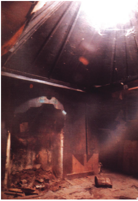
Resim 4: Yörük Köyü evinde tepeden ışık alan oda- Deftergil Evi (Özköse 2000: 122).

Yörük Köyü evlerinin birinde görülen önemli bir özellik de Deftergil Evi olarak bilinen konutta bir odanın tepeden aydınlatılan bir odasının bulunmasıdır. Bu örnek, köy konutlarının göçebe dönem barınaklarından gelişmiş olduğunu göstermektedir (Özköse 2000: 122) (Resim- 4 ). Göçebe dönem barınağı olan yurt çadırında da iç mekân çadırın tavanında açılmış bir delikten aydınlatılmakta ve havalandırılmaktaydı.