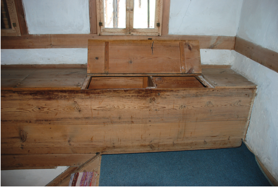
Resim 6: Merdivenden çardağa çıkışta yapılmış erzak depoları- Sucu Hafız Evi.

Daha önce de değinildiği üzere, orta kat genelde kış mevsiminde kullanılmak üzere kolay ısınması nedeniyle alçak tavanlı inşa edilen odalardan oluşmaktadır. Üst kat geleneksel Türk konutunda değişmeyen bir özellik olarak esas yaşama katıdır. Işığa ve manzaraya göre biçimlenen üst katta Türk evinin tasarım çekirdeğini oluşturan odalar yer almaktadır. Odaların sayısı iki ile beş arasında değişmektedir. Odaları birbirine yörede “çardak” olarak isimlendirilen sofa bağlamaktadır. Evlerin çoğu dış sofalı plan tipinin pahlı köşe sofalı türüne uygun olarak inşa edilmiştir ve çoğunda da sofaya eklenmiş bir eyvan bulunmaktadır (Resim-7). Sipahioğlu Konağı'nda olduğu gibi harem ve selamlık ayrımı olan simetrik planlı evler de bulunmaktadır. Ayrıca helâ, abdestlik ve kiler de sofayla bağlantılıdır. Çardağın bir bölümünün yükseltilerek özel oturma köşeleri yapıldığı görülmektedir (Resim- 7). Odalara köydeki evlere has bir özellik olarak sofaya diyagonal konumlanmış kapılarla girilmektedir (Resim- 7).