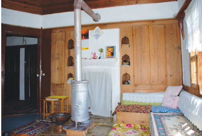
Resim 9: Odaya giriş, ocak, sedir ve nişler. Sucu Hafız Evi.