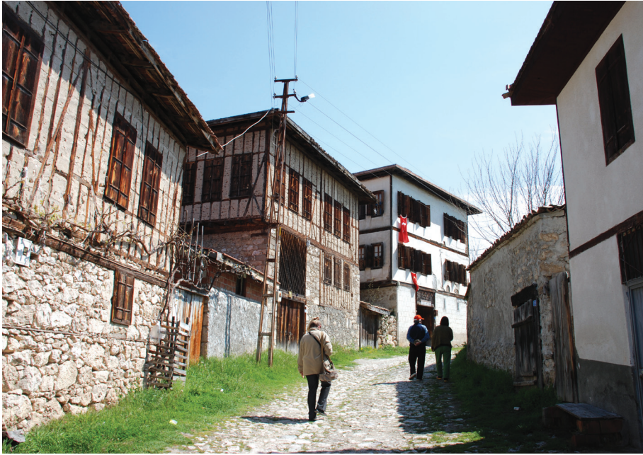
Resim 2: Yörük Köyü genel görünüm.