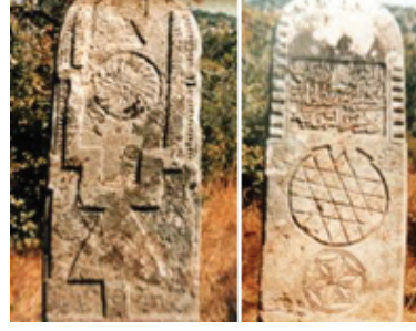
Fotoğraf 11: Hacemiroğulları Beyliği'nin İlk Merkezinde Mezar Taşı (Kaleköy-Mesudiye)