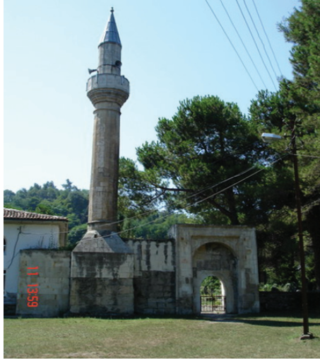
Fotoğraf 12: Çepni Türkmenleri/Hacıemiroğulları Beyliği'nin İkinci Merkezindeki Eskipazar Camisi'nin Giriş Kapısı (Eskipazar-Ordu)

Süleyman Bey, ordusuyla beraber Canik Dağları'nın zirvelerinden sahile inmiş; Ordu, Giresun ve Vakfikebir'in batısını bir daha değişmemek üzere Türk vatani hâline getirmiştir. Canik Dağları'nın zirvesinin fethi tamamlandıktan sonra Süleyman Bey zamanında, muhtemelen 1380'li yıllarda, Hacıemiroğulları Beyliği'nin başkenti de değişmiştir. Beyliğin başkenti daha önce Mesudiye'nin Kale köyünde iken bugünkü Ordu il merkezinin 4 km güneyinde kalan Eskipazar 'a taşınmıştır. Buraya, başkent anlamına gelen Ordu adı verilmiştir. Ordu ilimizin adı, bu olaydan kalmıştır.