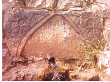
Fotoğraf 3: Çeşme Üzerinde (en sağda ve en solda) Çepni Damgası (Serenli Beldesi-Niksar)

Trabzon Rumları, 1277'de Çepni Türkmenlerinin elinde bulunan Sinop'a denizden saldırıda bulunurlar. Çepni Türkmenlerinin, Rumları yenilgiye uğrattığını kaynaklardan öğrenmekteyiz (İbn Bibi, 1996: 238-239). Bu savunmaya katılan Çepnilerin, Hacıemiroğulları ile ilgisinin olup olmadığı bilinmemektedir. Fakat bu bölgeye yaşayan Türklerin daha sonraki yıllarda Ünye tarafına doğru kaydıkları ve Bayram Bey'in idaresine girdikleri tahmin edilmektedir (Sümer, 1991b: 7). 1591'de Bayburt sancağı Kelkid nahiyesi Çepni karyesinde Çepni Türkmenleri 14 hanedir (Halaçoğlu, 2009: 532). 1455 yılında kaleme alınan tahrir defterine göre, Ordu sınırları içerisinde Çepnilere ait dört yer ismi bulunmaktadır: Hapsaman (Gölköy)'da