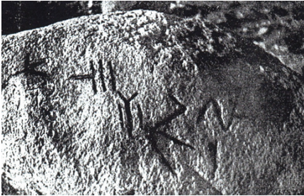
Fotoğraf 2: Suşehri Sarıyar Yaylası'nda Taş Üzerinde Oğuz Boyları Damgaları (Sağ alt köşede Çepni damgası)

Dânişmendlilerin ikinci başkenti Niksar'da ise Çepnilerle ilgili bilgiler, diğer boylara göre daha çok öne çıkmaktadır: Çepnilere ait yer isimlerinin büyük bir çoğunluğu, Anadolu'nun kuzeyinde yoğunlaşmıştır. Türklerin Anadolu'da inşa ettiği ilk büyük eserlerden biri olan ve günümüze ulaşan Niksar Ulu Camii'nin 1145 yılında Çepnizâde Hasan Efendi tarafından yaptırılması ve yine Niksar'da Çepnibey ismiyle bir mahallenin bulunması, 1530 tarihli tahrir defterine Niksar'da Çepni Bey evlatları cemaatinden alınan vergilerin kaydedilmesi (387 numaralı defter, 550, 552), Niksar'ın hemen yanında Tozanlı (Almus)'da Diyar-ı Çepni mezrasının (387 numaralı defter, 447), İskefsir (Reşadiye)'de Çepni Yusuf karyesinin (387 numaralı defter, 604) bulunması önemli deliller olsa gerektir. Ayrıca Niksar Serenli beldesinde bir çeşme üzerinde Çepni damgası bulunmaktadır: