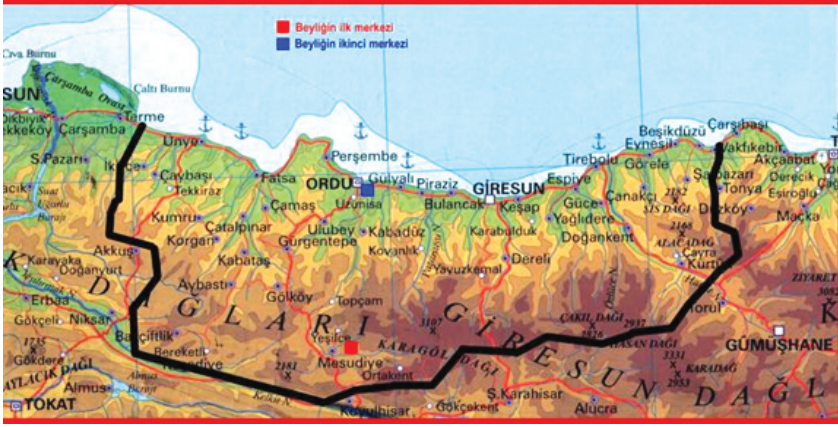
Harita 1: 1427'de Hacıemiroğulları Beyliği'nin Sınırları