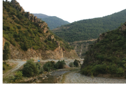
Fotoğraf 9: Güvenç Abdal Kapısı (Harşit Çayı Üzeri-Taşlıca Köyü-Kürtün)

Hacı Bektaş-ı Veli, en güvendiği dostlarından birisi olan Güvenç Abdal'ı 1260'lı yıllarda Kürtün'e göndermiştir. Güvenç Abdal, Süme Deresi'nin yaklaşık 10 km kuzeyine, stratejik bir noktaya yerleşmiştir. Güvenç Abdal'ın yerleştiği geçidin adı, Güvende Kapısı olup bu isim günümüze kadar ulaşmıştır 15 .