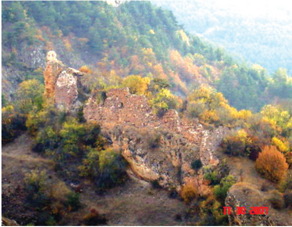
Fotoğraf 6: Çepnilerin/Hacıemiroğulları Beyliği'nin İlk Merkezi-Mesudiye Kaleköy Kalesi

Hacıemiroğullarının ataları Dânişmendliler, Malazgirt Savaşı'ndan (1071) hemen sonra tarih sahnesinde yer almışlardır. İlk fethettikleri yerler Sivas, Tokat, Amasya, Çorum, Yozgat, Kayseri, Malatya, Gümüşhane ve çevresidir. Ağırlıklı olarak Orta Anadolu'da yerleşmiş olmakla beraber, Türkiye'nin kuzeyinde de mücadeleler vermişlerdir. Bu bölgede etkili olabilmek için başkentlerini Sivas'tan Niksar'a taşımışlardır. Dânişmend Gazi tarafından bazı yörelerde Karadeniz sahillerine yaklaşılmış 7 , zaman zaman da geri çekilmek zorunda kalmıştır. Dânişmendliler, Mesudiye'nin 6 km kuzeydoğusunda bir sınır kalesi yapıp yöredeki sınırları bu kale vasıtasıyla kontrol etmişlerdir. Anadolu Selçukluları, 1178 yılında bu beyliğin varlığına son vermiştir. Dânişmendli topraklarında yaşayan Çepnilerin bir bölümü, Selçuklular tarafından Çanakkale ve Balıkesir civarında iskân ettirilmiştir. Burada iskân ettirilenler, daha sonra Karasioğulları Beyliği 'ni kurmuştur (Uzunçarşılı, 1988: 96-103).