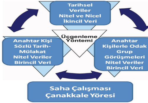
Şekil 1. Data nirengileme

Bu kapsamda, yöredeki yerel Tahtacıların oluşturduğu derneğin çalışmalarına katılmış, saha çalışmaları derneğin aracılığı ve bilgisi dâhilinde gerçekleştirilmiştir. Söz konusu verilerin toplanması 2009 yılından 2013 yılına kadar geçen zaman aralığı içinde, çeşitli Tahtacı köylerinin ziyaret edilmesi, ses ve görüntü kayıtları eşliğinde sözlü tarih, görüşme ve odak grup görüşmeleri yapılması suretiyle elde edilmiştir.