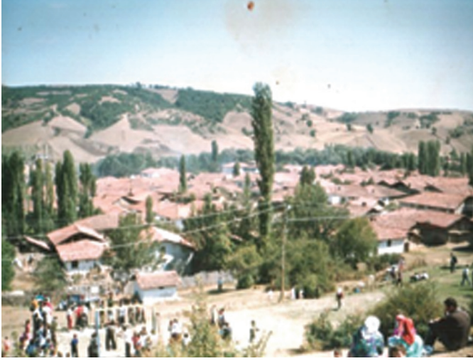
Resim 2. Keçeci Baba Türbesi