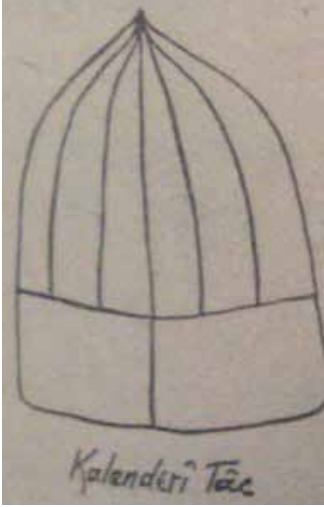
Şekil 5: Kalenderî tâcın simgesel çizimi Noyan, 1987: 289)

Günümüzde kullanılmamakla beraber geçmişte Bektaşilerin kullandığı tâc şekillerinden birisidir. Şekil 5'te görülüşü gibi, tepesinde düğme olmayan ve dilimleri dıştan dikişli bulunmayan, kubbesi on iki, lengeri dört dilimli beyaz tâc şeklindedir (Gölpınarlı, 2005: 320-321) .