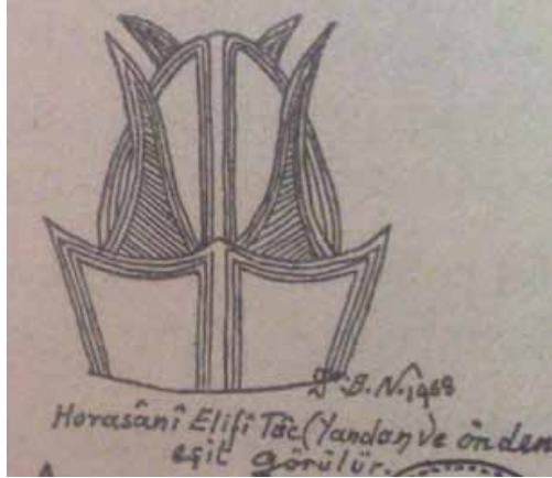
Şekil 3: Horasâni Elifi tâcin simgesel çizimi (Noyan, 1987: 289)

Sonradan beyaz keçeden, lengeri dört, kubbesi iki dilimli sivri tâca da 'Elifi Tâc' denmiştir ki bu, asıl Horasâni Tâctan bozmadır ve Merdivenköyü Bektaşî Tekkesi mezarlığında bu tâci taşıyan mezar taşları vardır (Gölpınarlı, 2005:115).